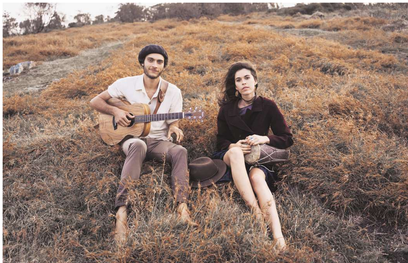
Saije aus Australien bringen großartigen Indie-Folk mit.

► Bei einem Doppelkonzert treten Blue Note und das Lina Ross Trio am 15. September im Hölderlin Eins auf. Die Band Blue Note spielt smooth Jazz, Latin, Bossanova und Pop von Interpreten wie