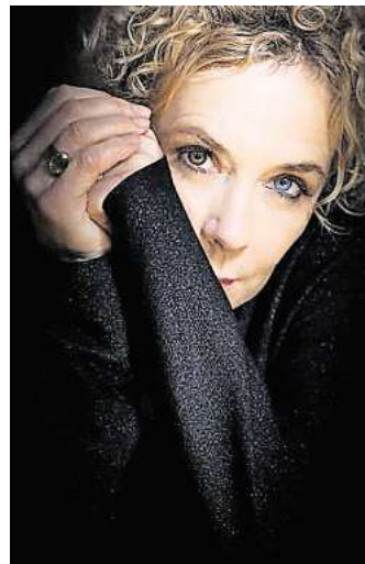
Schauspielerin Katja Riemann liest aus ihrem Debütroman.