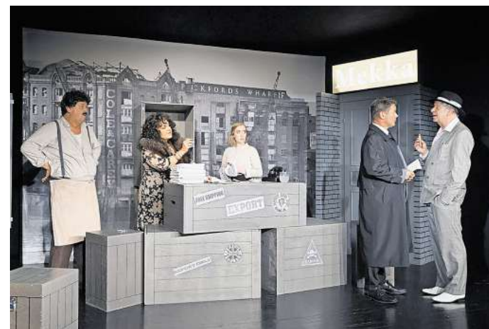
Das Neue Theater bringt ein Kriminalstück nach Edgar Wallace auf die Bühne.