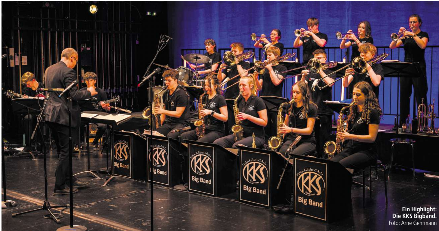
Ein Highlight: Die KKS Bigband.