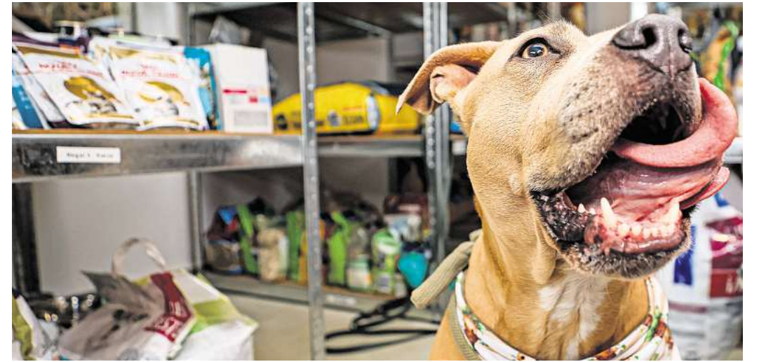
Passt auf: Shaffordshire Terrier Cookie hat ein Auge auf die Tiertafel-Lager-Ware.