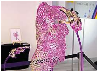
Teil der Ausstellung ist das Exponat „Nicht noch ein Stück“.