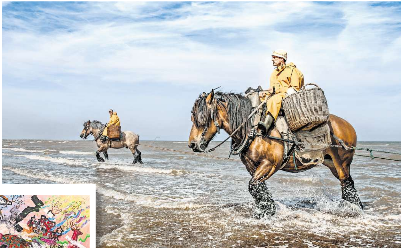
Auch am Zinnober-Wochenende: Bilder von Rolf Nobel sind in der Ausstellung „Arbeiter der Meere“ in der Galerie für Fotografie (GAF) zu sehen.

In der GAF, Seilerstraße 15 D, werden Foto-Geschichten von Rolf Nobel über „Arbeiter der Meere“ präsentiert, eine Hommage an Berufe wie Fischer und Leuchtturmwärter und die Menschen, die diese Berufe ausüben. Zudem findet während des Zin-