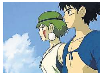
Der Anime „Prinzessin Mononoke“ wird am Nachhaltigkeitstag im solarbetriebenen Kino gezeigt.

HANNOVER. Das Stadtteilzentrum Ricklingen, Anne-Stache-Allee 7, lädt zu einem bunten Tag rund um nachhaltige Alternativen ein. Am Sonnabend, 6. September, beginnt um 16 Uhr eine Kleidertauschparty: Einfach bis zu zehn saubere und gut erhaltene Kleidungsstücke und bis zu fünf Accessoires mitbringen und auf den Tischen verteilen – und dafür andere Teile mitnehmen. Nach dem gleichen Prinzip findet der „Tauschrausch“ für Dekoration, Bücher, Werkzeug, kleine Möbel, Spielzeug und mehr statt. Eine kreative Upcycling-Werkstatt lädt zum Mitmachen ein, im Repair-Café können defekte Fahrräder (Keine E-Bikes und Pedelecs!) repariert werden, und in der Kids Area warten spannende Kinderaktionen. An einer „Devil Sticks“-Station können Jonglierstangen gebaut werden, und das Glücksrad dreht sich. Das solare Wanderkino Cinema del Sol zeigt den ikonischen Anime-Film „Prinzessin Mononoke“ (Einlass: 19.45 Uhr, Filmbeginn: 20 Uhr), ein Meisterwerk von Hayao Miyazaki, das Natur, Mensch und Mythos in einer tiefgründigen Geschichte über Konflikt und Harmonie miteinander verwebt. Der Eintritt zum Nachhaltigkeitstag ist frei. R/H/R