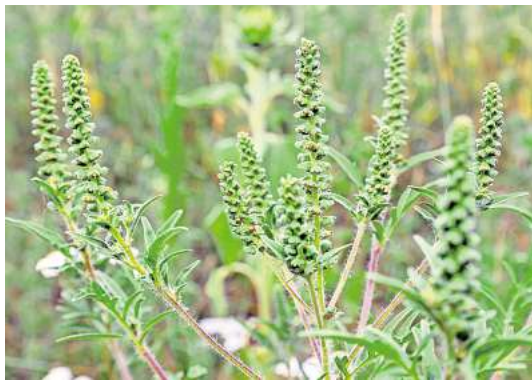
Allergieauslöser: Wer Ambrosiapflanzen im Garten entdeckt, sollte handeln und die Pflanzen entfernen.