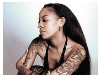
Meditative Klangreise: Tekhole eröffnet am Samstag die Main Stage beim Fuchsbau Festival.