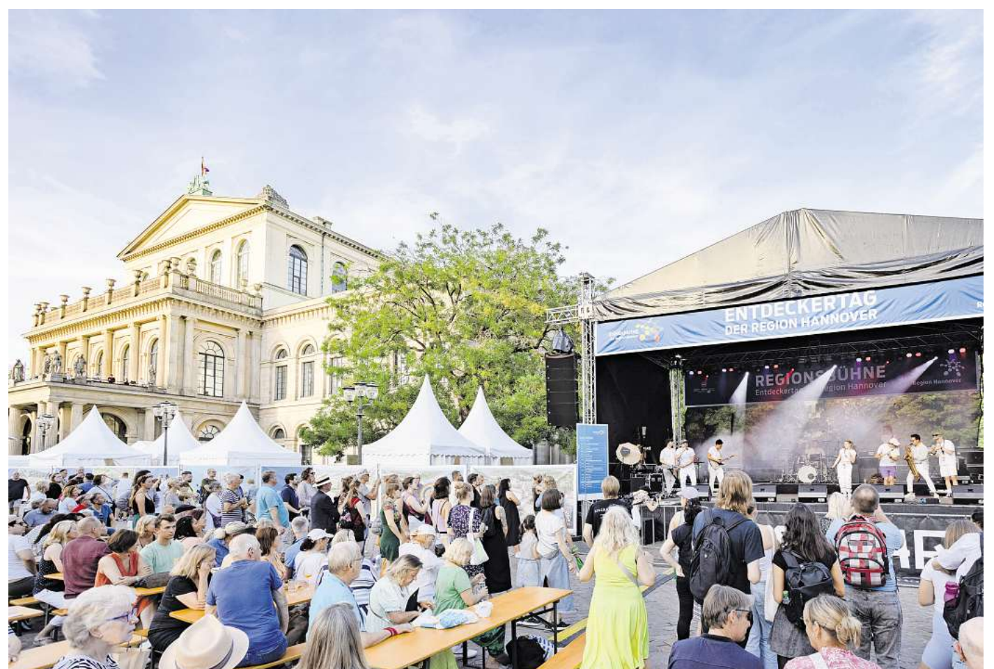
Der Opernplatz ist Hannover das Herz des Entdeckertages.

Neustadt am Rübenberge ist mit drei Angeboten vertreten: Im Naturpark-Haus in Mardorf am Steinhuder Meer ist Tag der offenen Tür, im Schloss Landestrost spielen Studierende der HMTMH Klassikkonzerte, und die Volkshochschule Hannover Land zeigt die Fotoausstellung „Lieblingsorte“ in der Region Hannover. Seelze bietet sechs Tourenziele: In der Innenstadt