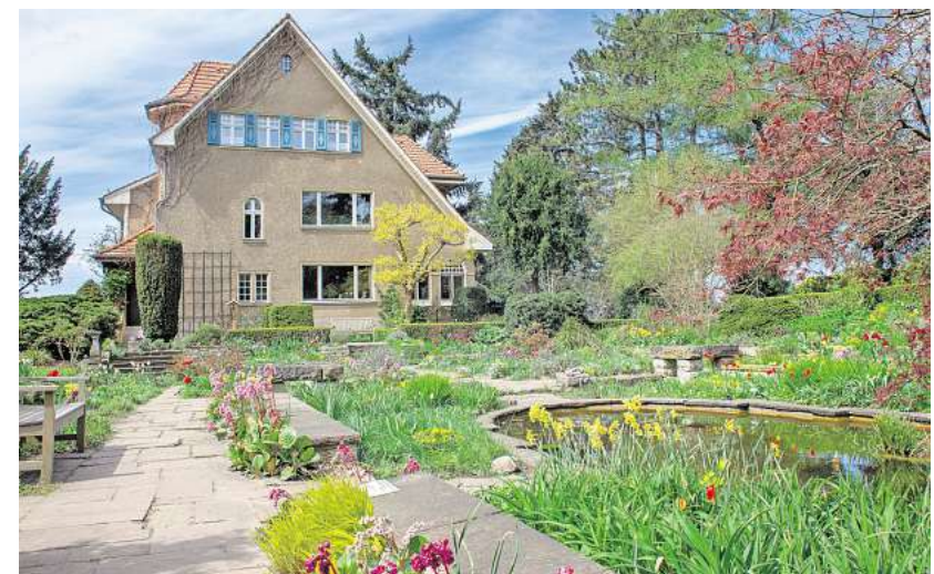
Unterschiedliche Ebenen ermöglichen, einen Garten größer und interessanter wirken zu lassen.

Das Prinzip, einen Garten auf mehreren Ebenen zu modellieren und dadurch förmlich Land zu gewinnen, funktioniert nicht nur auf Hanggrundstücken mit Ausblick. Auch innerhalb eines eher flachen Gartens ergeben sich auf diese Weise interessante Perspektiven. Für ein nur um wenige Zentimeter erhöht liegendes Sonnendeck sind gar keine Erdarbeiten nötig. Trotzdem wird das Deck in seiner Bedeutung betont – und man bekommt förmlich den Überblick. Umgekehrt