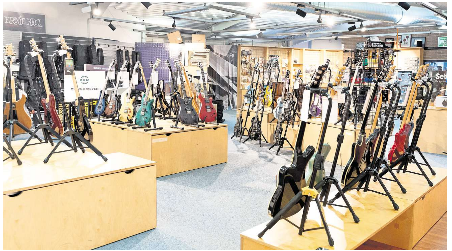
Schöne Dinge: Die Gitarrenauswahl im PPC ist auch was fürs Auge.

Die Räume unten, in denen früher Tasten, Blas- und Perkussionsinstrumente verkauft wurden, sind nach Corona auf- und abgegeben worden. Ja, die Pandemie hat der Kultur richtig wehgetan, auch den Zulieferern der stillgelegten Kunstlerstraße. Und nun haben die PPC-Ge-