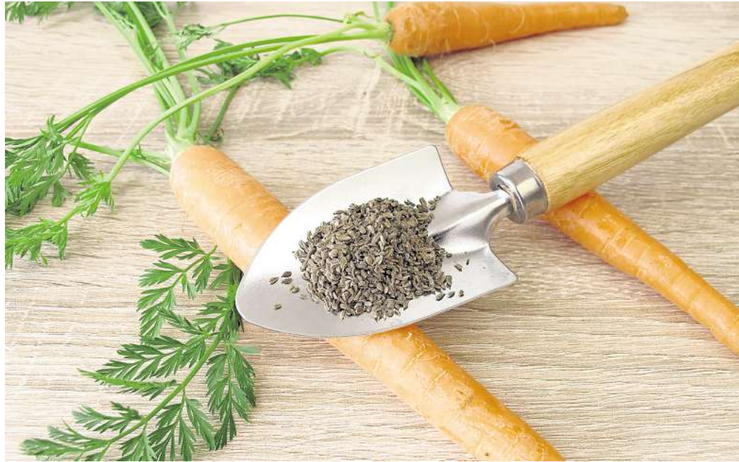
Schier endlose Vermehrung: Selbst gesammeltes Saatgut bringt genau jene Pflanzen hervor, die sich bereits im eigenen Garten bewährt haben.

Das bedeutet: Das Saatgut ist natürlich vermehrbar. Hybridsorten hingegen, wie man sie häufig bei großen Saatgutpro-