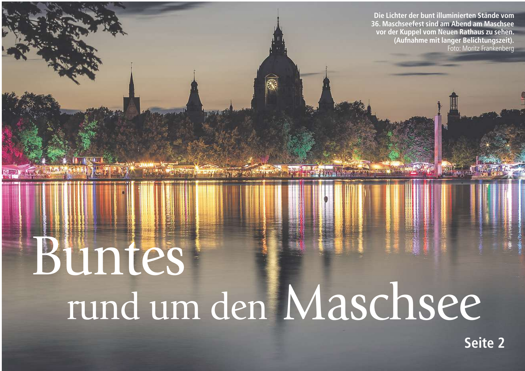
Die Lichter der bunt illuminierten Stände vom 36. Maschseefest sind am Abend am Maschsee vor der Kuppel vom Neuen Rathaus zu sehen. (Aufnahme mit langer Belichtungszeit).

➤ Weitere Informationen zu Hanni gibt es im Serviceportal: serviceportal.hannover-stadt.de oder per E-Mail an ki-k@hannover-stadt.de