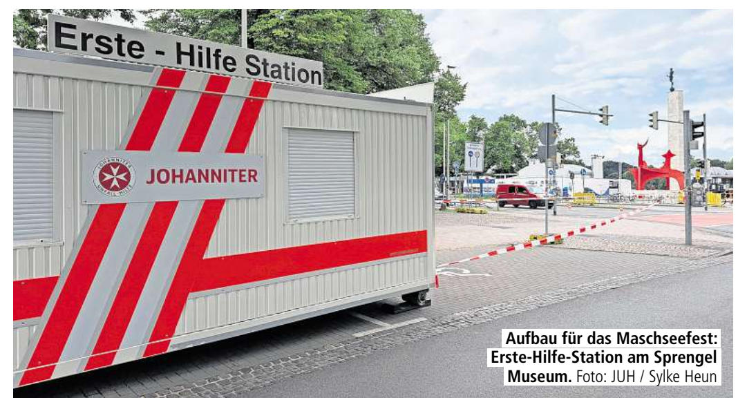
Aufbau für das Maschseefest: Erste-Hilfe-Station am Sprengel Museum.

sind die Johanniter da. Mit Einsatzfahrzeugen, vom Rettungswagen (RTW) bis hin zum Notarztsanitätsfahrzeug (NEF), aber auch mit Abrollcontainern und Erste-Hilfe-Stationen. Die Standorte sind auch auf den Karten für die Gäste des Maschseefestes verzeichnet. Eine Unfallhilfsstelle liegt am Kurt-Schwitters-Platz, eine andere auf dem Parkplatz