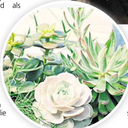
Luftreinigende Eigenschaften: Sukkulenten und Kakteen sind fast immer eine gute Wahl fürs Schlafzimmer.

sinnvoll sein kann – im Sommer weniger. Daher empfiehlt es sich, mit Hilfe eines Hygrometers den Wert im Auge zu behalten. Als Faustregel gelten 40 bis 60 Prozent