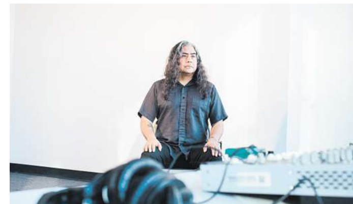
Im Kunstverein: Raven Chacon