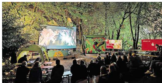
Impression eines Kinoabends im Biergarten Gretchen.