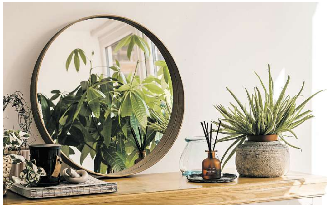
Pflanzen können zur ruhigen Atmosphäre eines Schlafzimmers beitragen.

Ob man ihn im Schlafzimmer haben möchte, ist also jedem selbst überlassen.