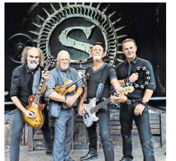
Live: Santiano.

Starke Gitarren-Riffs, ausgelassenes Publikum und Hits wie „Frei wie der Wind“, „Sturmgeboren“ oder „Volle Fahrt“ – das verspricht ein Konzert von Santiano. Im Sommer kehren die norddeutschen Rockstars mit ihrer Erfolgstournee „Doggerland“ auf die Open-Air-Bühnen