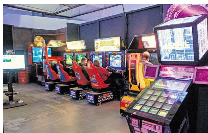
Besucher testen beim Senak Peak die Spielautomaten im Arcade-Museum Hi-Score, das vom Aufhof in die Südstadt umgezogen ist.

Eintritt: Kinder ab drei Jahren zahlen 24,90 Euro und Kinder ab