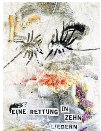
Zehn Lieder, eine Hommage an Hildegard Knef.