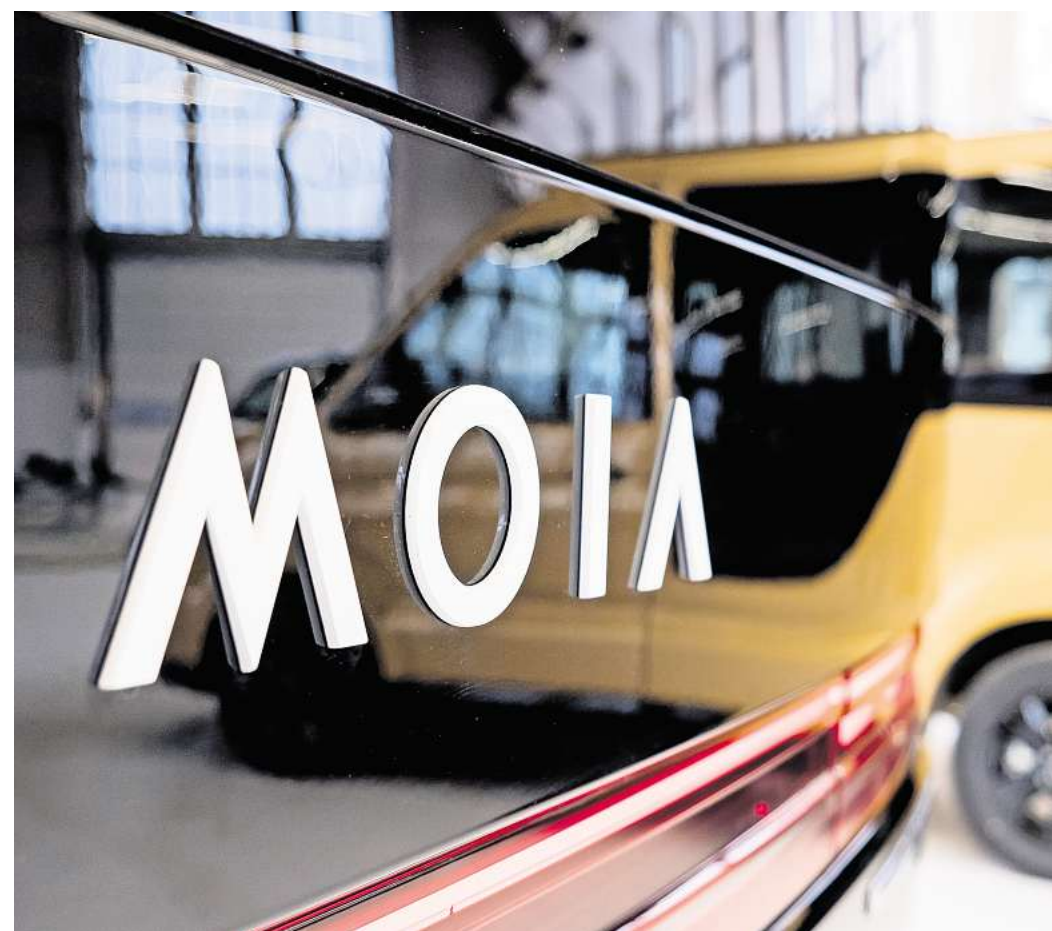
Aus nach sieben Jahren: Moia-Kunden können keine Fahrten mehr in Hannover buchen.

Erst im Juni 2025 hatte VW in Hamburg einen auferüsteten ID.Buzz als Robotaxi vorgestellt. Bis Ende 2026 soll er die Zulassung für einen fahrerlosen Einsatz nach dem sogenannten Level 4 bekommen. Tausende Exemplare will VW dann im Werk in Stöcken bauen. Sie sind allerdings vorerst