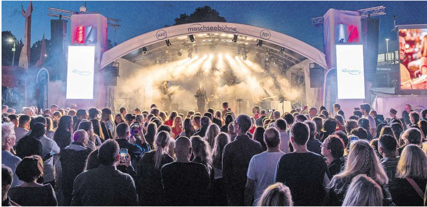
Eindrücke von der Single-Party „Fisch sucht Fahrrad“, mit der Band „Vergeben“ auf dem Maschseefest 2024.

Big-Band-Klänge, Soul und Glam-Rock, eine Pitch-Show und Poetry-Slam: Das bietet das HAZ-Programm.