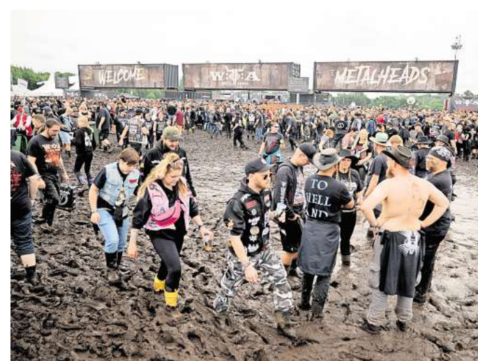
Schlamm Schlacht in Wacken: 2023 mussten Metal-Fans knöcheltief im Modder über das Gelände des größten Heavy-Metal-Festivals der Welt stapfen.

G wie Gummistiefel: Gummistiefel gehören in jedes Gepäck – viele machen daraus längst ein modisches Accessoire.