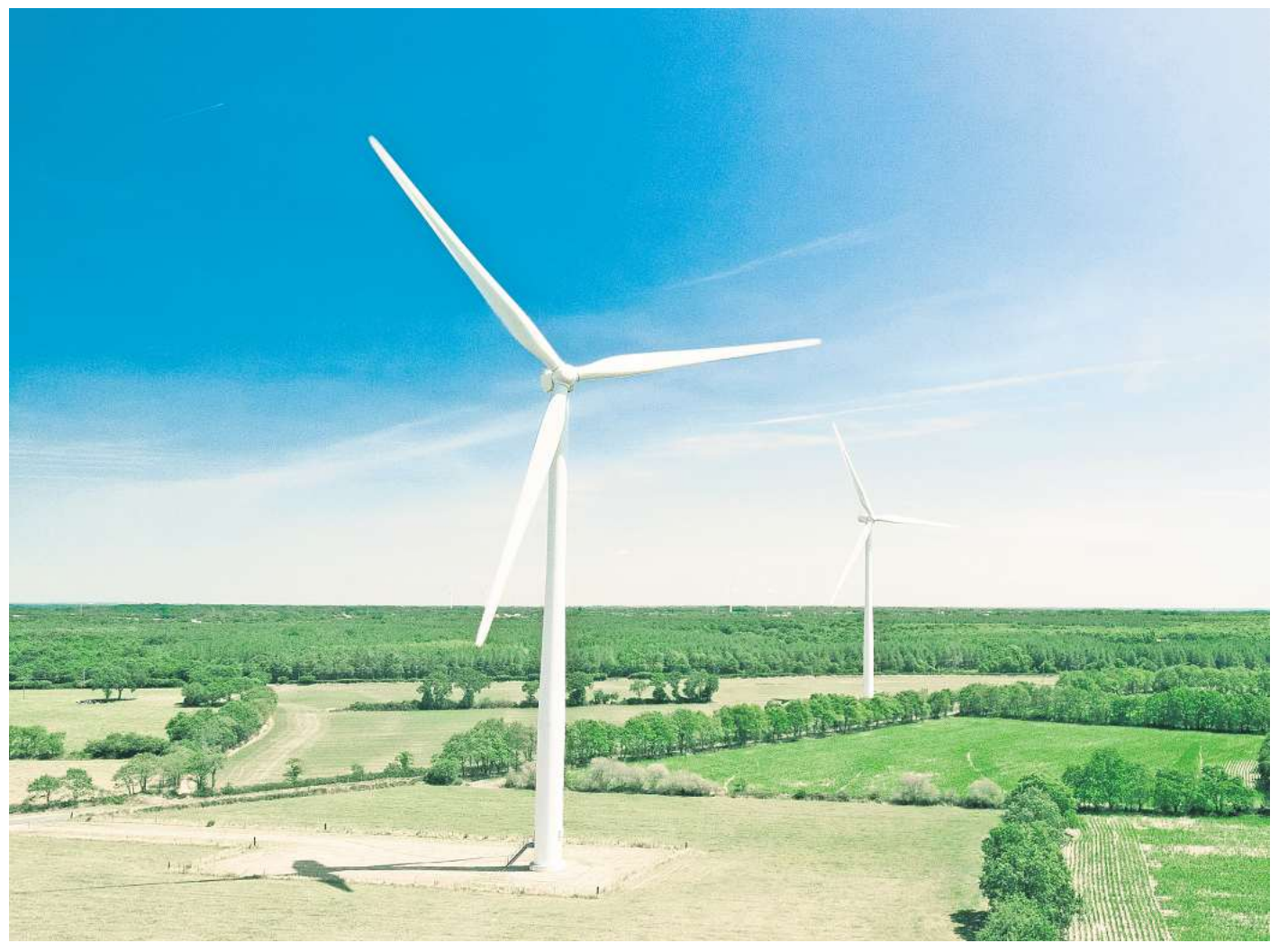
Windenergie-Verbände warnen vor einer politischen Kehrtwende beim Ausbau erneuerbarer Energien, die letztlich aufgrund unrealistischer Bedarfsschätzungen der gesamten Wirtschaft Schaden würde.

Ein weiterer zentraler Punkt des gemeinsamen Papiers von