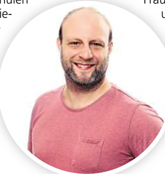
Diplom-Pädagoge und Autor Sebastian Tippe hält regelmäßig Workshops an Schulen.

Sebastian Tippe Diplom-Pädagoge und Autor