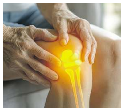
Gelenkverschleiß im Knie ist die häufigste Arthrose-Form.

Das Knie zieht, die Hüfte sticht, die Schulter wird steif: Arthrose, eine der häufigsten Volkskrankheiten hierzulande, beginnt oft leise und endet in einem Alltag mit Schmerz, weniger Lebensfreude und Beweglichkeit. Was Millionen Betroffenen Hoffnung schenkt: Ein pflanzlicher Wirkstoff, der unabhängig davon seit Jahren in der komplementären Krebstherapie eingesetzt wird, ist in einem rezeptfreien Arzneimittel, zugelassen bei Arthrose, hoch konzentriert enthalten!