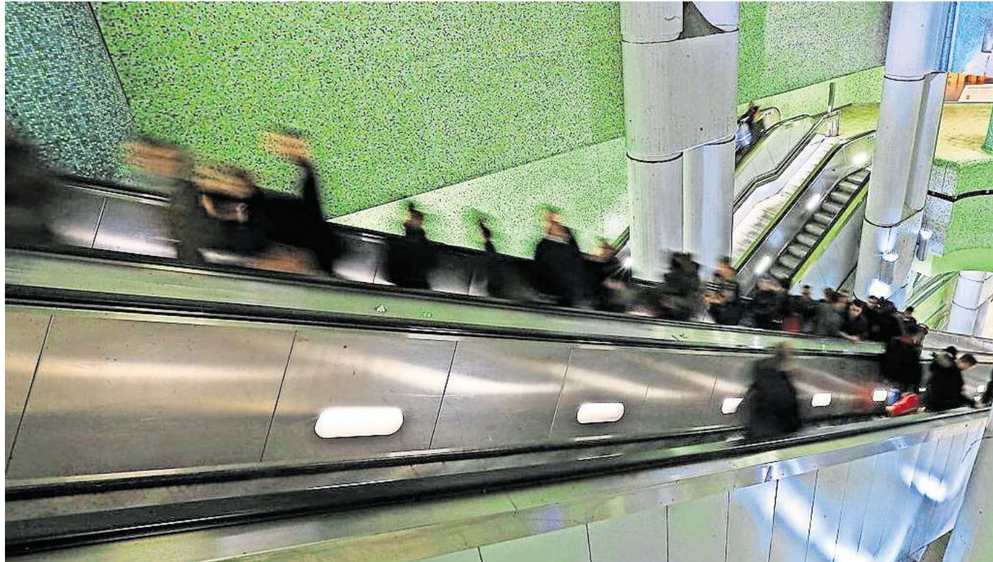
Bringen Fahrgäste aus der Station nach oben: Die Rolltreppen in den Stationen der Üstra wie hier am Kröpcke.

1925 GAB ES DIE ERSTE IN DEUTSCHLAND – seitdem hat sich auch in Hannover viel getan