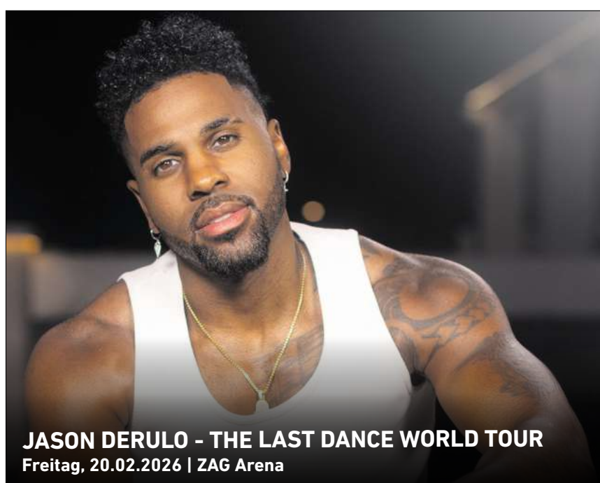
JASON DERULO - THE LAST DANCE WORLD TOUR Freitag, 20.02.2026 | ZAG Arena

musikzentrum-hannover.de/ 30-jahre-rockmobil/