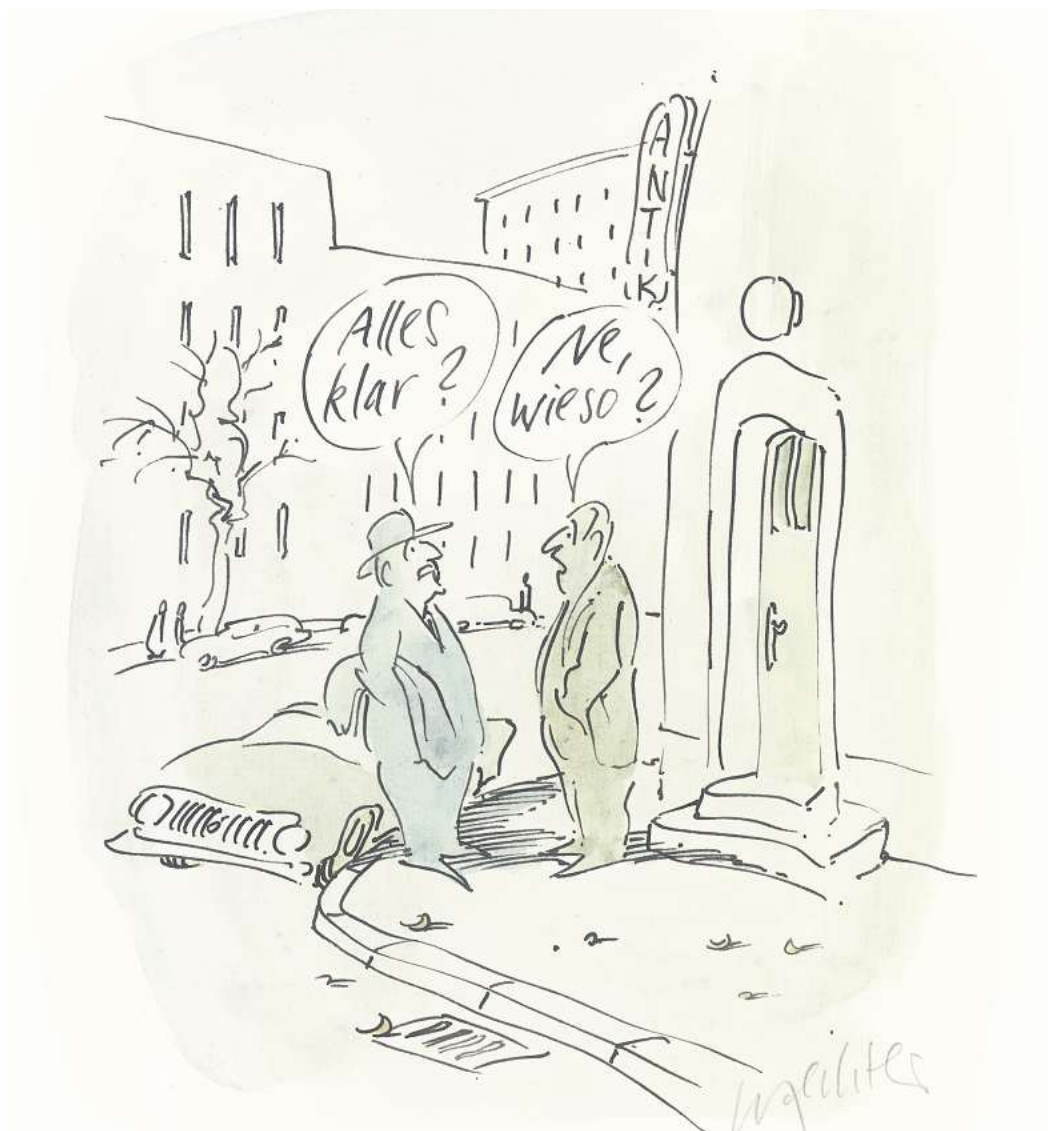
F. K. Waechter: „Alles klar – Ne wieso“, o. J.