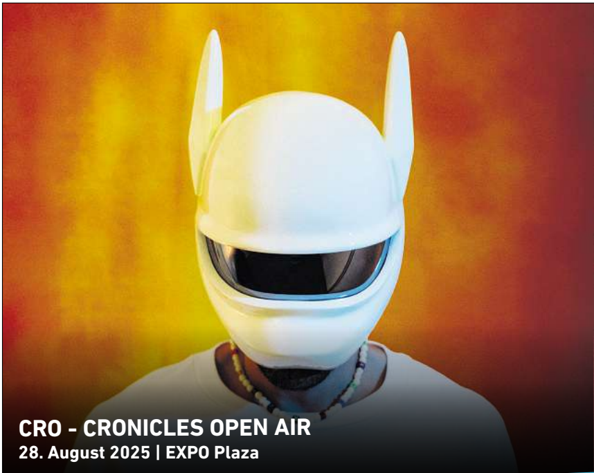
CRO - CRONICLES OPEN AIR 28. August 2025 | EXPO Plaza

Ihr persönlicher Ticketservice der HAZ & NP