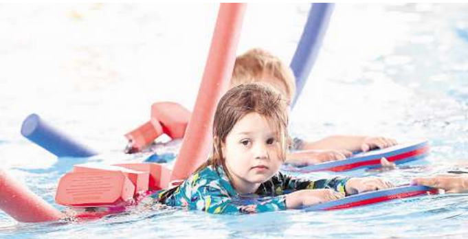
Schwimmoffensive der Region Hannover: Tausende Kinder lernen kostenlos schwimmen – auch mit Unterstützung der NP.

dem CVJM und Waspo, stehen folgende Bäder zur Verfügung: Misburger Bad (21. Juli bis 10. August), Volksbad Limmer (23. Juni bis 1. August), Annastift in Bemerode (28. Juli bis 10. August), Buntbad in Hemmingen (7. bis 18. Juli), Delphi Bad in Gehrden (7. bis 18. Juli) sowie das Freizeit- und Bewegungsheim Abbensen, Wedemark (23. Juni bis 1. August).