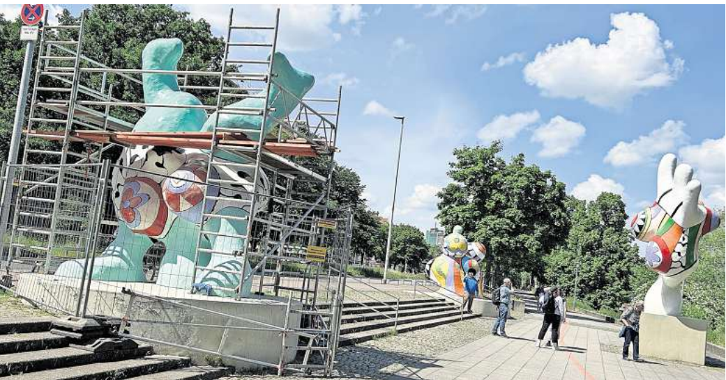
Die Stadt macht die Nanas am Hohen Ufer wieder hübsch.

Die Dauer der Arbeiten sind nach Angaben der Stadt abhängig nach Aufwand und sind abhängig von der Witterung. „Bis Ende Juni sollten die Arbeiten aber abgeschlossen sein“, so die Stadt. Die Gesamtkosten belaufen sich auf rund 35.000 Euro.