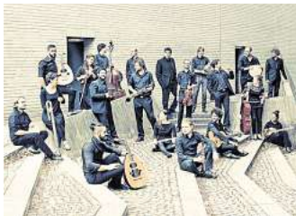
Asamura Ensemble

Friedrich Händel. Im Hofsaal präsentiert das Flex Ensemble Werke von Mozart und Brahms, danach gibt es unter anderem vierhändiges Klavierspiel nach Samuel Barber vom Duo Ion-Yilmaz und Bach-Interpretationen der Hannoverschen Hofkapelle (20 Uhr). „Transkulturelle Bach-Neudeutungen zu Klangmosai-ken“ stehen auf dem Programm des Asamura Ensemble, das Klassik weiterdenkt und unter Berücksichtigung kultureller Zugehörigkeit und Diversität neu und innovativ erlebbar machen