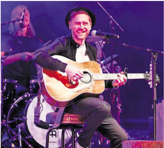
Eigentlich kennt man ihn hier eher so: Johannes Oerding ist sonst auf Bühnen zu Hause, nun wagt er sich auf den Fußballplatz des Eilenriedestadions.

„Kicken mit Stars“ beginnt um 10 Uhr, Anpfiff im Eilenriedestadion ist um 13.30 Uhr. Stehplatzkarten kosten 19, wer das Spektakel lieber im Sitzen verfolgen will, zahlt 25 Euro. Ein Familienpaket für zwei Erwachsene und zwei Kinder bis einschließlich 14 Jahre gibt es ebenfalls, Kostenpunkt 60 Euro.