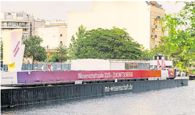
Die Ausstellung befindet sich im Bauch eines umgebauten Frachtschiffes.

künstlichen Blatt – seine Kombination von Photovoltaik und Elektrolyse in einer einzigen Zelle könnte in Zukunft grünen Wasserstoff im großen Stil produzieren. Wo und wie Wasserstoff eingesetzt werden kann, ist Thema weiterer Mitmach-Stationen.