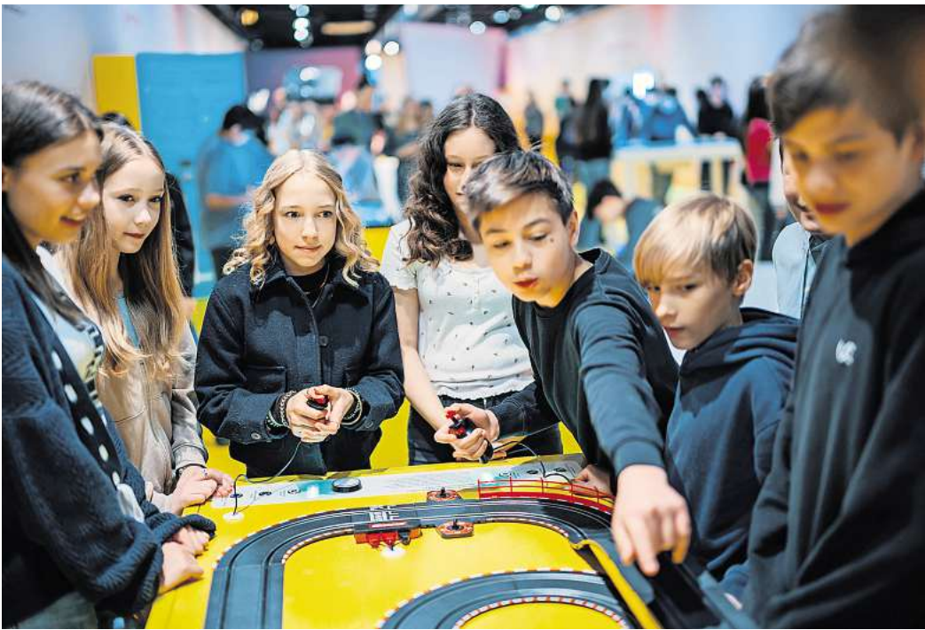
An rund 30 Exponaten können kluge Köpfe selbst aktiv werden und Fragen zur Energieversorgung der Zukunft nachgehen.

Das Helmholtz-Zentrum Heron experimentiert mit einem