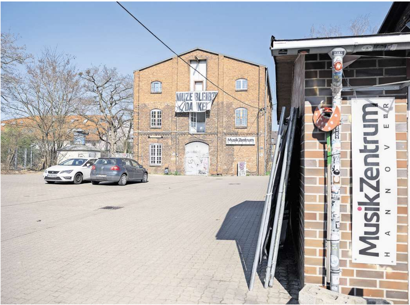
Gewerbe, Kultur und Wohnungen: So will die Stadt das Quartier rund ums Musikzentrum voranbringen Eine Studie im Auftrag der Stadt beschreibt, wie das Areal rund um das Musikzentrum entwickelt werden kann.

► 4. Leben im Quartier: Für Studierende gibt es ein Wohnheim