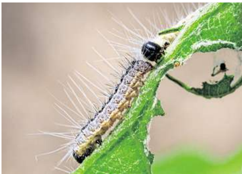
Juckreiz und Hautentzündungen: Die feinen Brennhaare der Eichenprozessionsspinner können für Menschen problematisch werden.

Außer Zecken lauern im Gras häufig Grasmilben. Die Bisse der nur wenige Millimeter großen Tierchen können beim Menschen einen starken Juckreiz auslösen und Hautekzeme verursachen. Ab Juni schlüpfen die Larven der Grasmilbe – und machen sich auf die Suche nach einem geeigneten Wirt. Häufig sind das Haustiere oder Menschen. Für den Schutz vor Grasmilben gilt ähnliches wie bei Zecken: Geschlossene Schuhe, lange Hosen und langärmelige Kleidung tragen, und das Absuchen von Körper und Kleidung nach dem Ausflug. Ist man gebissen worden, kann ein Juckreiz die Folge sein. Krankheiten übertragen die Tierchen nicht.