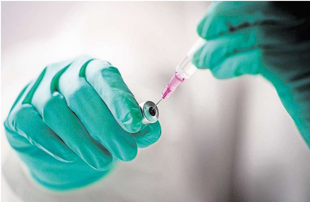
Heilung per Spritze: Die neue Impfung soll künftig vor allem Patienten mit Krebsmetastasen helfen.

Mit Krebspatienten zu arbeiten sei extrem motivierend, um gute Forschungsergebnisse voranzutreiben. In ein paar Jahren, so Wirths Hoffnung, könne der Impfstoff angewendet werden, „und vor allem Patienten im metastasierten Zustand helfen“. Als nächster Schritt müssten klinische Studien die Wirksamkeit und Sicherheit für die Anwendung beim Menschen nachweisen.