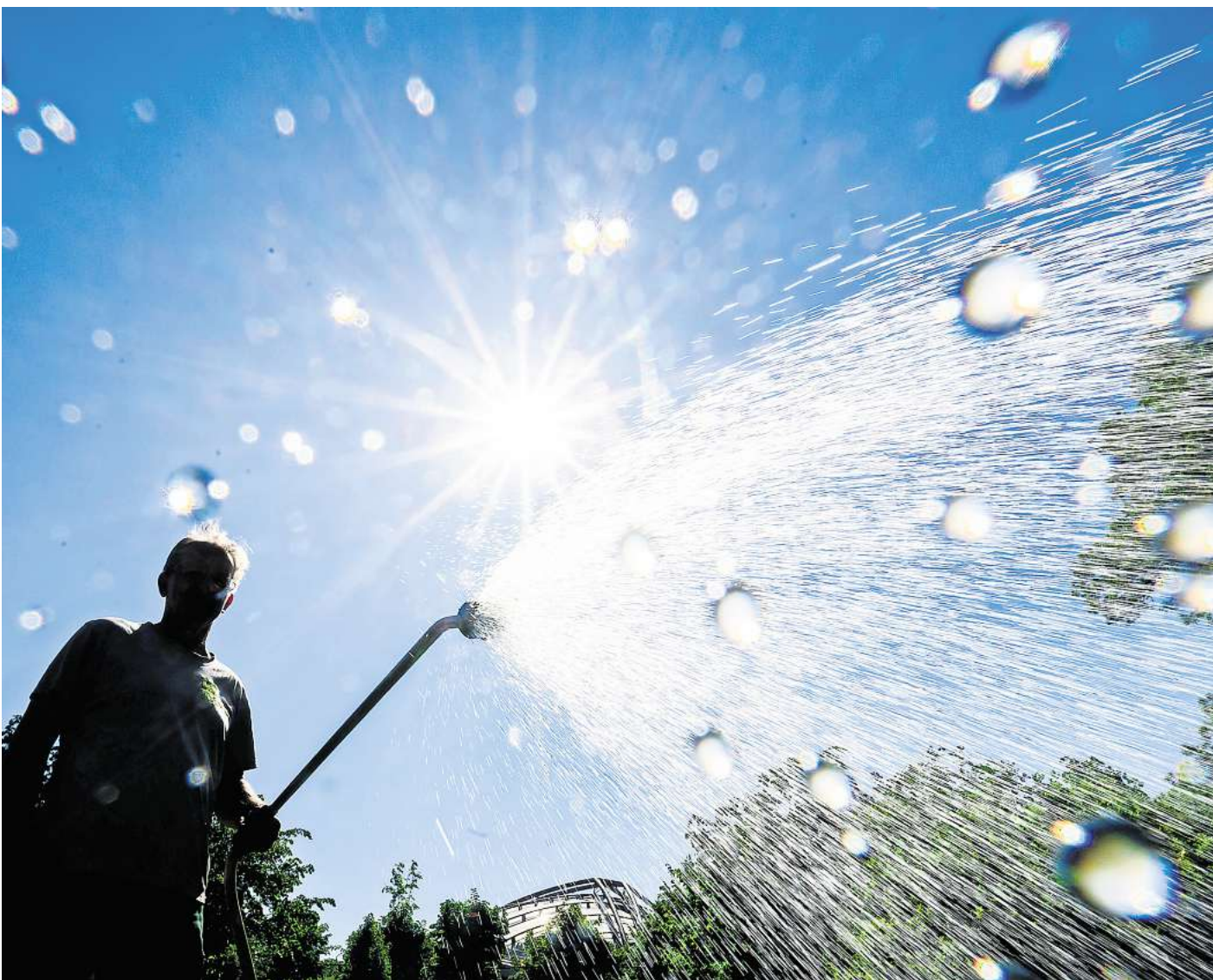
Effektiver beregnen: Bewässerung ist ab dem 1. Juni und ab 27 Grad nur noch zu Zeiten erlaubt, an denen die Verdunstung eingeschränkt ist.

Kalkarm und ein idealer pH-Wert: Regenwasser ist die beste Wahl für die Bewässerung des Gartens. Es lohnt sich also, Regen aufzufangen und zu sammeln. Der Klassiker dafür ist die Regentonne, aber auch mit anderen Gefäßen kann man Regen auffangen. Wird viel Wasser benötigt, kann eine Zisterne in den Boden eingegraben werden.