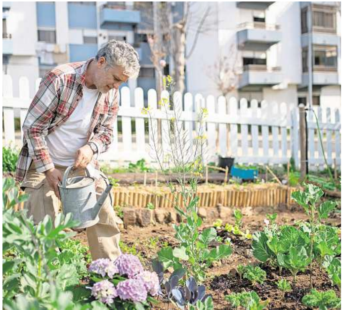
Der Gemüsegarten wird am besten morgens gegossen und möglichst nah am Boden.