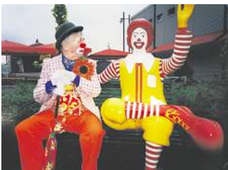
Jeremy Deller, Performance: „Has The World Changed or Have I Changed?“, Expo2000, Hannover