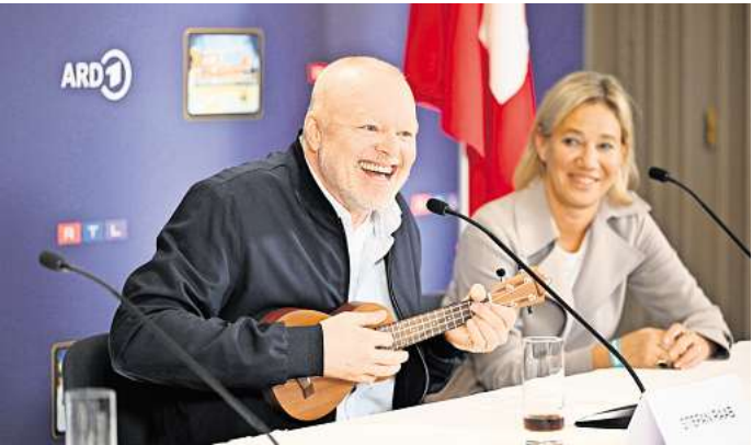
Chefsache: Stefan Raab war Teil der Jury bei der Suche nach dem deutschen Eurovision Song-Contest-Kandidaten.