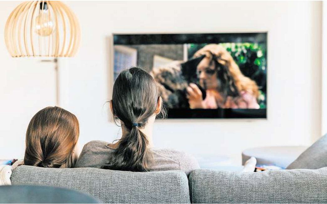
Nur selten sieht man im Fernsehen einen realitätsnahen Alltag.