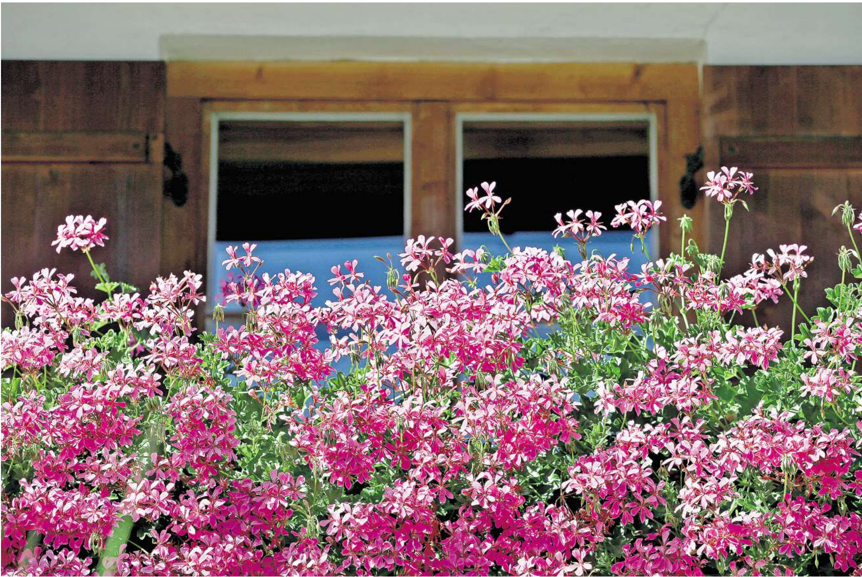
Blütenzauber am Balkon: Regelmäßiges Ausputzen hält Geranien gesund und blühfreudig.

Schädlinge können Geranien nichts anhaben. Bei Pilzbefall sollte man befallene Blätter sofort entfernen und die Belüftung verbessern. Trauermücken können auf feuchte Erde hindeuten – den Boden also gut abtrocknen lassen.