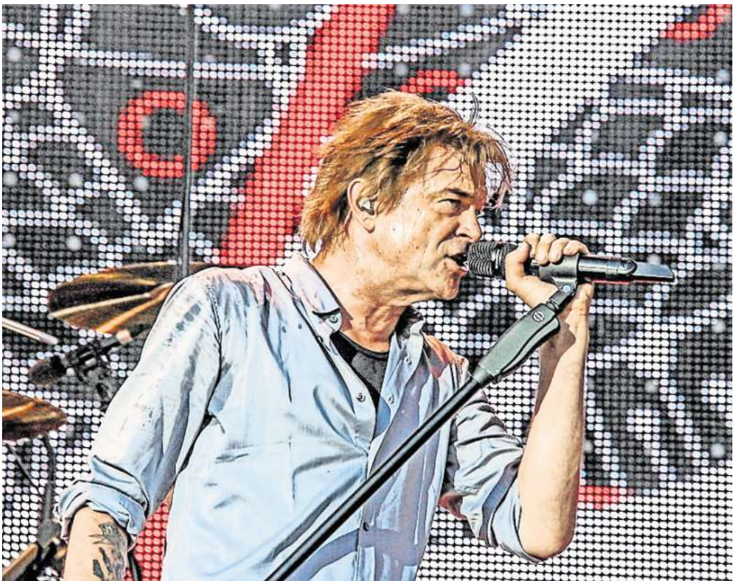
Campino von den Toten Hosen 2018 auf der Expo-Plaza

Der Vorverkauf für die „Trink aus! Wir müssen gehen“-Tour ist gestartet. Ticketinfos gibt es unter www.dth.de