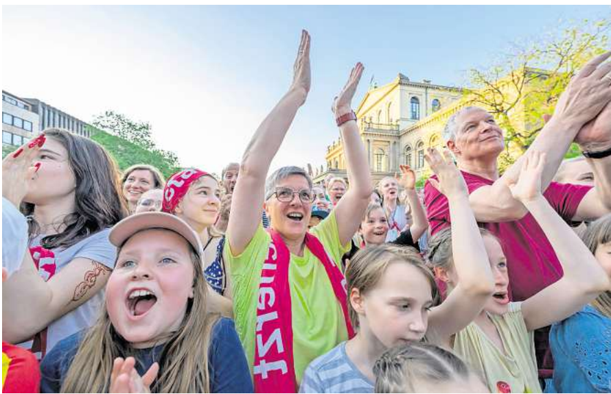
Fröhlicher Kirchentag: Hannover sammelte als guter Gastgeber Punkte.

von Social-Media-Kommentaren unbestimmter Anzahl genannt wird. Und auch wenn Hannover da immer wieder abräumt (Fahrradfreundlichkeit, ÖPNV; Stadtgrün, Einkaufsbahnhof, Medizinstandort): Als Lokalfatalist rechnet man selbstverständlich stets mit dem Ärgsten. Wie jetzt gerade. Eine bunt zusammengewürfelte Ranking-Sammlung, vom Portal „stern.de“ unter der wenig feingliedrigen Überschrift „Die schlimmsten Städte Deutschlands“ aufgezählt. Auch hier verzahnen sich, grob gesagt, seriöse Kategorien mit dem, was die Leute so sagen. Es geht darum, wie hässlich die Stadt ist, wie unglücklich oder unhöflich ihre Bewohner sind, und es geht um wirtschaftlich oder polizeilich halbwegs belegbare Kriterien wie Lebenshaltungskosten, Mietspiegel, Kriminalität, Armut oder Stadtflicht. Reflex in Hannover: Da sind wir dabei. Denn als Hannoveraner pflegt man zu solchen Tabellen eine solide Hassliebe. Man möchte den Namen seiner Stadt eigentlich nicht lesen, aber – ist der Ruf erst ruiniert – ganz leer möchte man bei einer solch exquisiten Sammlung von Abgründen auch nicht