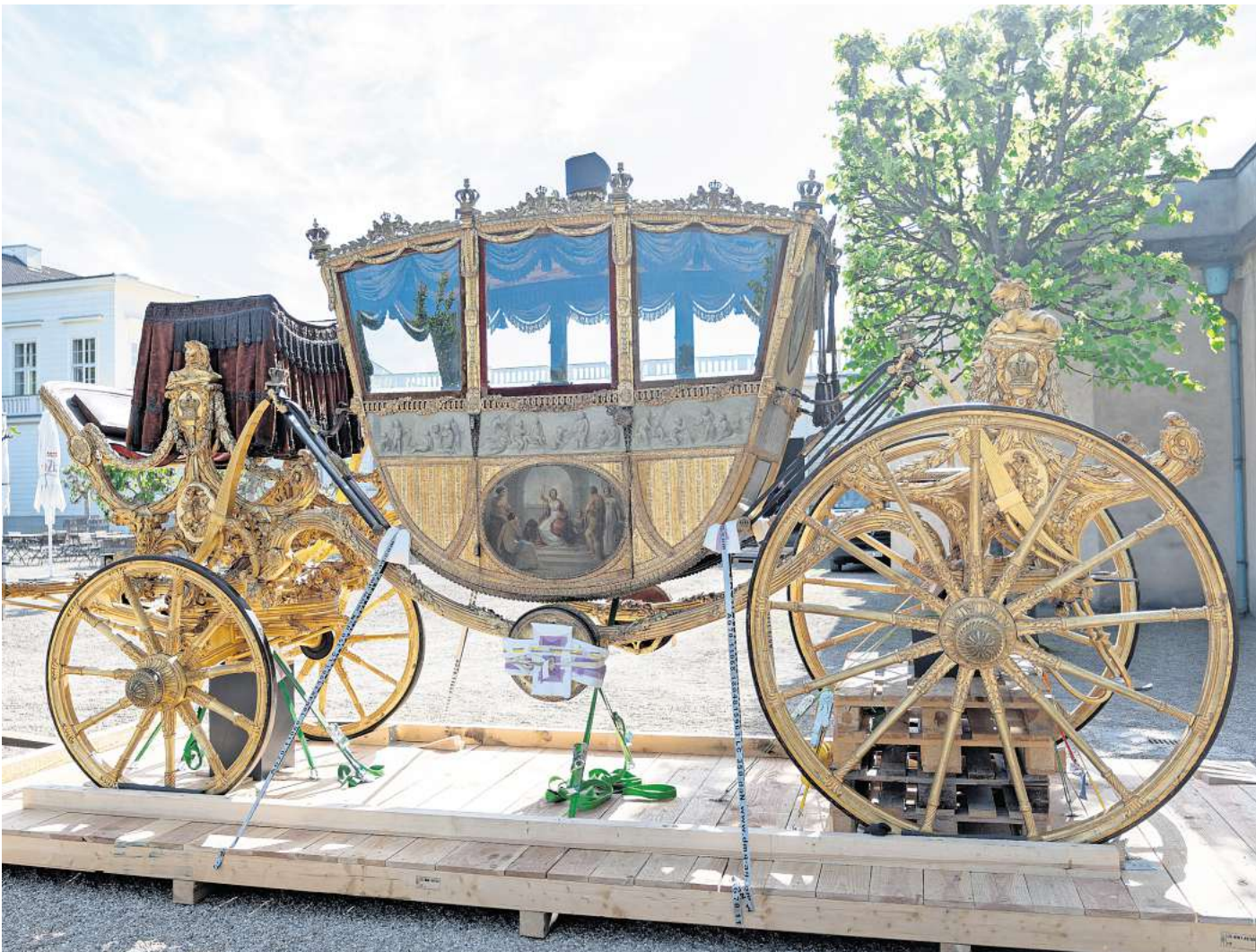
Angekommen: Die Hauptstaatskarosse der Welfen wird künftig im Schlossmuseum Herrenhausen ausgestellt.

„Vor 28 Jahren habe ich diese Kutsche nach Berlin befördert“, erinnert sich Szarata. Damals habe es sich um eine Leihgabe für ein Museum gehandelt. Daher wisse er genau, wie mit dem Holzgefährt umzugehen sei.