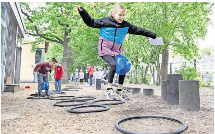
Bewegte Pause: Schüler und Schülerinnen der Grundschule Krähenwinkel kommen mit der Initiative Bewegungspass in Schwung.

Volksbank dafür, möglichst sämtliche Wege zur Schule und zum Sportverein ohne Elternfahrzeug zu bewältigen.