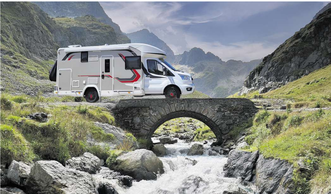
Bevor es auf große Fahrt geht, sollte das Reisemobil gründlich vorbereitet werden.

Achten sollte man auch auf Standplatten, die bei ausgedehnten Standzeiten entstehen können. Dabei wird der Reifen unrunder. Das macht sich beim Fahren durch ein deutliches Vibrieren bemerkbar. Im Zweifelsfall