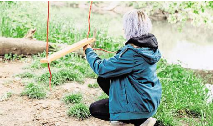
Die Schaukelguerilla hängt Schaukeln überall dort auf, wo es sich gut schaukeln lässt – damit immer mehr kleine und große Menschen Spaß am Kindsein haben.

Dann malt sie auf ein neues Brett die Zahl 107. So weit ist sie inzwischen. Das hängt sie in den Leineauen auf, direkt am Wasser. Ein Spaziergänger bleibt spontan stehen, beobachtet sie. „Es gibt doch nichts Schöneres, als unter einem Baum so zu schaukeln“, schwärmt er.