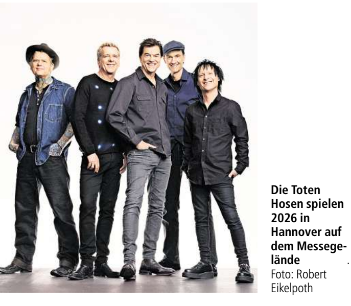
Die Toten Hosen spielen 2026 in Hannover auf dem Messegelände