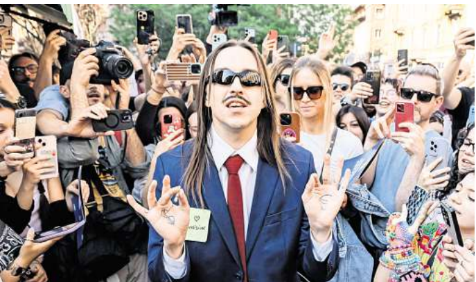
Der Este Tommy Cash zieht mit „Espresso Macchiato“ Italienklischees durch den Kakao.