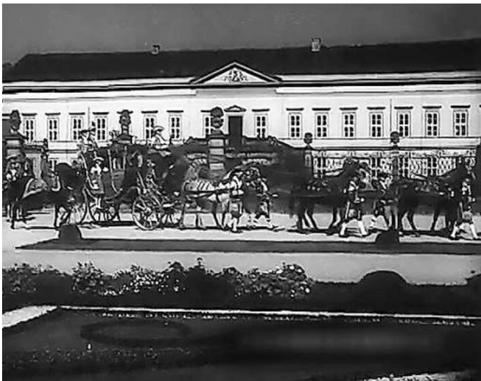
Vor dem Schloss: Welfenkutschen rollen durch Herrenhausen.

Neben dem Film mit den Welfenkutschen ist dabei auch „Der Große Garten“ zu sehen. Dieser mit großem Aufwand produzierte Film von Regisseur Herbert