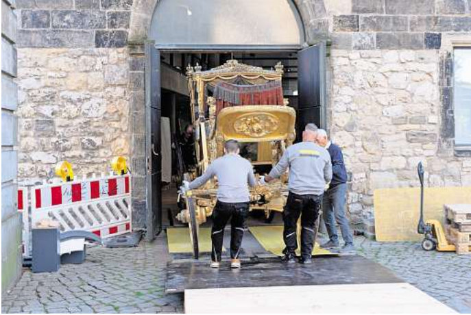
Millimeterarbeit: Im Vorfeld wurden alle Türen und Tore genau vermessen, damit es keine unliebsamen Überraschungen beim Herausrollen der Kutschen aus dem Historischen Museum gibt.