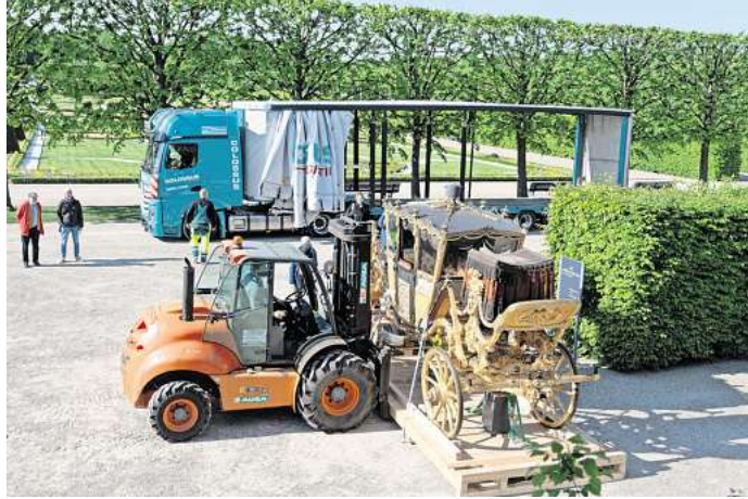
Vorsicht ist die Mutter der Porzellankiste: Ganz langsam und sorgfältig werden die Kutschen mit dem Gabelstapler vom Hänger abgeladen.