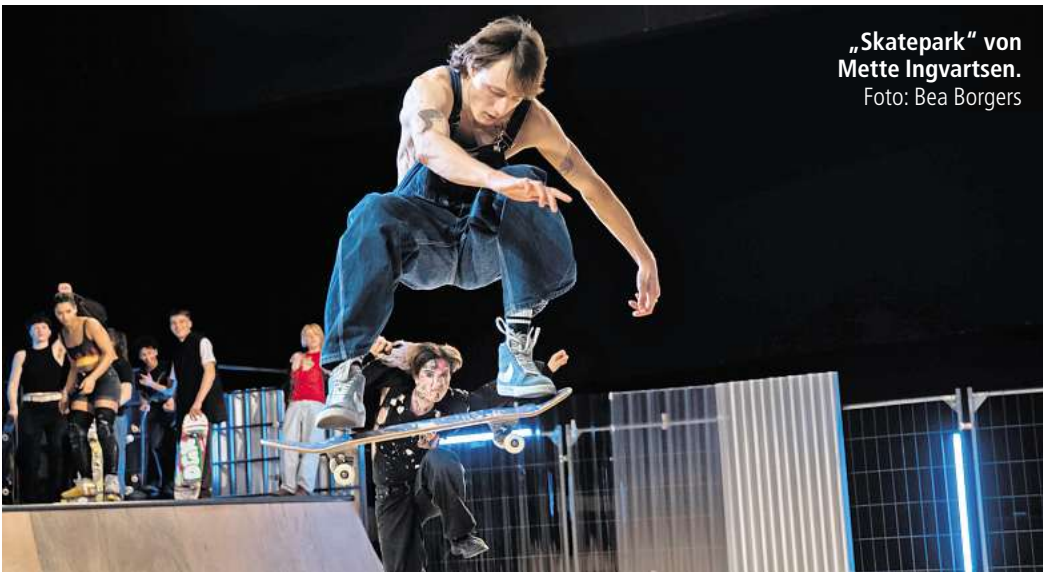
„Skatepark“ von Mette Ingvarsen.

rin Elisabeth Klinck. Zusammen lassen sie sphärischen Soundlandschaften zwischen Klassik und Pop entstehen. Gotopo (7. Juni, 21 Uhr) werbt in ihrer Musik und ihren provokanten Shows folkloristische Saiteninstrumente mit techno-inspirierten Jams.