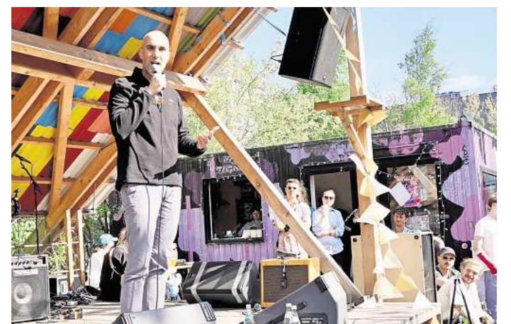
Belit Onay besuchte das Platzprojekt. Der Oberbürgermeister bezeichnete die Initiative als „lebendigen Ausdruck von Gemeinschaft und Stadtentwicklung von unten“.

► Nähere Informationen zum Platzprojekt und Veranstaltungsübersicht: platzprojekt.de