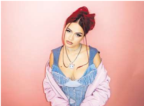
Badmómzjay ist bei der N-Joy Starshow dabei

ver Concerts (0511/12 12 33 33, hannover-concerts.de), www.eventim.de und an allen Vorverkaufsstellen zu haben. Kombitickets kosten 116,99 Euro. Je nach Art der Ticketbestellung (VVK-Stelle, Telefon, Internet) können zusätzliche Gebühren für Bearbeitung und Versand hinzukommen. Die Tickets berechtigen zur Nutzung der öffentlichen Verkehrsmittel an den Veranstaltungstagen im Bereich des Großraum-Verkehrs Hannover (GVH). Kinder von 3 bis 6 Jahren erhalten freien Eintritt.