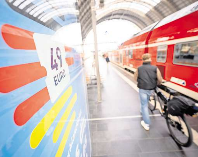
Erfolgsmodell 49-beziehungsweise jetzt 58-Euro-Ticket: Mindestens 13,5 Millionen Menschen nutzen derzeit das Ticket, das als Nachfolger des erfolgreichen 9-Euro-Tickets im Mai 2023 für 49 Euro an den Start ging.