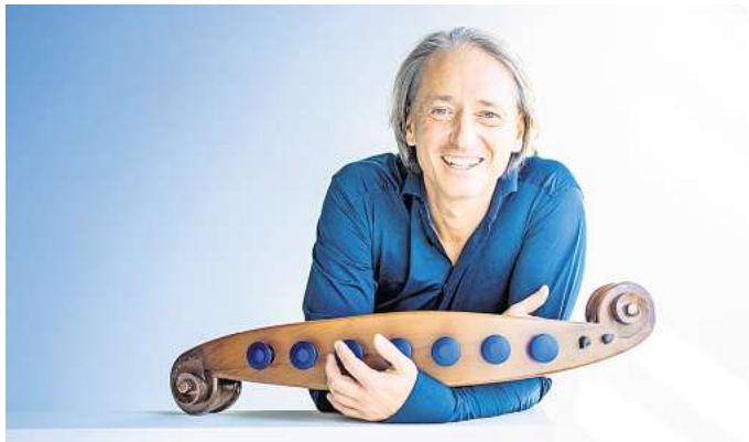
Martin O. kommt mit einem einzigartigen Loopgerät in den Kuppelsaal im HCC.

HANNOVER. Mit seinem 41. Programm „Wir mischen euch auf!“ rührt der Kinderzirkus Giovanni mit einer Show rund um Farben gegen das Schwarz-Weiß-Denken an. Wie eine monochrome Welt aussieht und was wir alles verlieren, wenn wir Eintönigkeit heraufbeschwören, möchten Feuerspucker und Jongleure, Seiltänzer und Schlangengymnasten in zwei (zunehmend) bunten Stunden zeigen. Die nächsten Aufführungen sind am Sonnabend, 10. Mai, und Sonntag, 11. Mai, jeweils ab 11 und ab 15.30 Uhr im Zirkuszelt hinter dem Johanneshof, Hermannhof 10. Der Eintritt kostet 12 Euro, für Kinder 6 Euro.