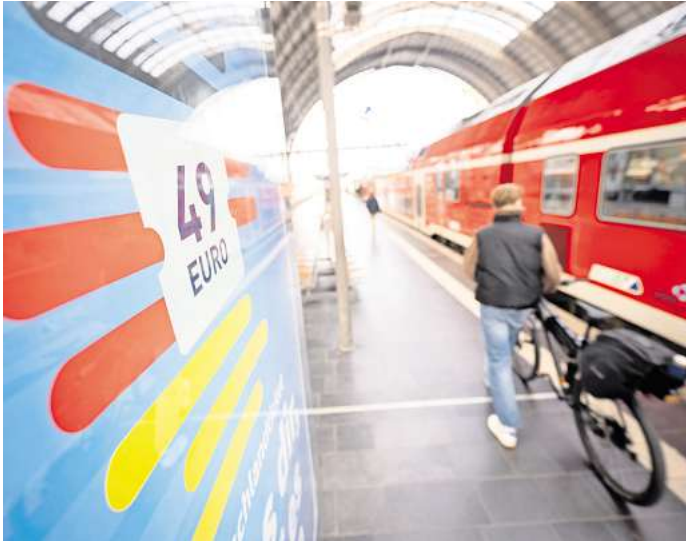
Erfolgsmodell 49-beziehungsweise jetzt 58-Euro-Ticket: Mindestens 13,5 Millionen Menschen nutzen derzeit das Ticket, das als Nachfolger des erfolgreichen 9-Euro-Tickets im Mai 2023 für 49 Euro an den Start ging.

ter vom Auto auf den ÖPNV umstiegen: 12 bis 16 Prozent aller Fahrten mit dem Deutschlandticket sind der Studienlage nach Fahrten, die vom Pkw verlagert wurden. Vor allem Menschen, die den öffentlichen Nahverkehr vorher nur selten nutzten, taten das nun häufiger. Das Ergebnis: Bis zu 6,5 Millionen Tonnen CO 2 wurden pro Jahr eingespart.