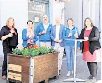
Die erste Pflanzkiste der IDG wurde aufgestellt.

zept der Pflanzkisten wurde als am schnellsten und einfachsten umzusetzen bestimmt. Die Kisten sind mobil auf Europaletten installiert und werden von der Vahrenheider Werkstatt gebaut, die eine Tischlerei und eine Gärtnerei unterhält. Als Aufstellflächen bieten sich gepflasterte Vorgärten privater Hand an, nun sucht die I.D.G. nach weiteren Plätzen für die Pflanzkisten in Döhren, verbunden mit einer Partnerschaft für die Bepflanzung und Bewässerung. Eine Bepflanzung ist individuell möglich und gewünscht, Partner und Sponsoren können mittels Plakette auf der Kiste verewigt werden. Interessierte können unter idg-hannover.de Kontakt aufnehmen. Die I.D.G. hofft, dass die Pflanzkiste von den Döhrenern als eine Art Initiator wahrgenommen wird und daraus weitere Ideen und Initiativen entspringen. RED