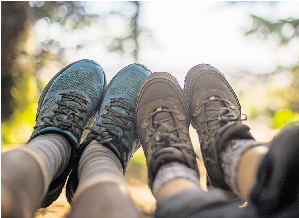
Beginn der Wandersaison: Beim Deistertag warten viele Aktionen.

Springe wird zum Zentrum für Naturbildung und Bewegung.