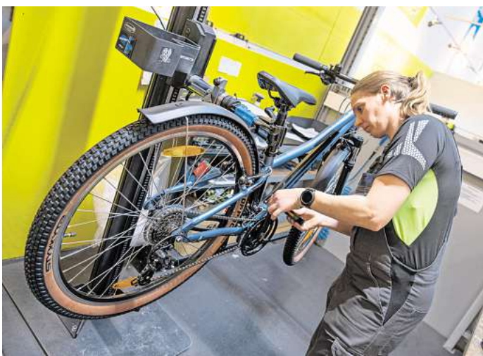
In den Fahrradwerkstätten läuft die Reparatur und Inspektion auf Hochtouren.

Aber: Wer sein Rad bereits vor dem Termin bringe, könne auf eine schnellere Reparatur hoffen. Denn mitunter, sagt der Fachmann, gebe es eine Umbuchung durch die Kunden. Daraus ergäben sich Lücken, die