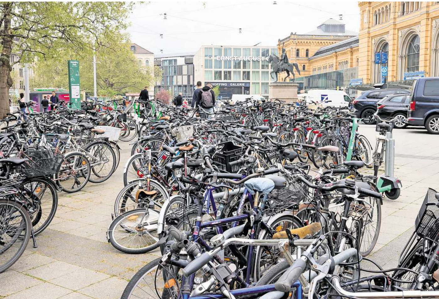
Fahrräder werden am Ernst-August-Platz vor dem Hauptbahnhof abgestellt. Unter ihnen finden sich auch manche, die nicht wieder abgeholt wurden.

Im vergangenen Jahr ließen die Aha-Beschäftigten insgesamt 1176 Schrotträder im Stadtgebiet entsorgen, im Jahr 2023 waren es 1081 – deutlich weniger als noch 2022, als nach Aussage von Sievers 1548 Räder in die Schrottpresse kamen. Die nicht mehr funktionsfähigen Räder fallen entweder Passantinnen oder Passanten auf, die den Fund dann an Aha melden. Oder die zuständigen Kontrolleure finden den Schrott bei ihren täglichen Rundgängen. Ein Fahrrad gilt nach Aha-Einschätzung dann als schrottreif, wenn es nur mit erheblichem finanziellen Aufwand wieder genutzt werden könnte. „Das ist zum Beispiel der Fall, wenn nur noch der Rahmen vorhanden ist, die Felgen so verbogen sind, dass sie erneuert werden müssten“, sagt Sievers. Deklarieren die Kontrolleure ein Rad als Schrott, dann bekommt es einen Aufkleber mit Frist und der Anforderung an den Eigentümer, das Rad zu entfernen. Falls das unterbleibt, holt Aha das Rad nach vier Wochen ab, lässt Daten wie Hinweisgeber, Rahmennummer und Farbe dokumentieren und das Rad anschließend verschrotten. „Die Entsorgung geschieht in Absprache mit Ordnungsamt, Polizei und Stadtverwaltung“, sagt Sievers und betont, die Kosten müssten die Gebührenzahler tragen. Einzige Ausnahme: Die Entsorgung der Räder, die auf dem Bahngrundstück stünden,