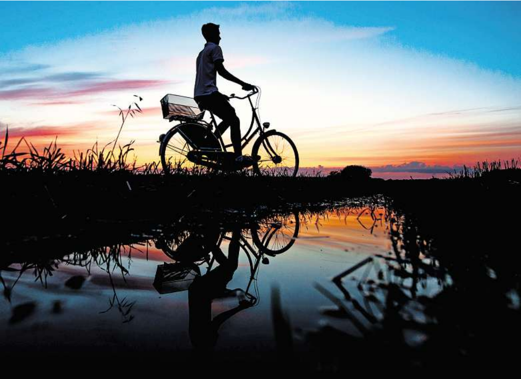
Die Ebenen des Emsradweges sind auch für Ungeübte gut zu schaffen..

Von der Quelle im Paderborner Land bis zur Mündung an der Nordsee in Ostfriesland führt der rund 385 Kilometer lange Emsradweg. Unter anderem die abwechslungsreiche Routenführung und das flache Gelände-profil mache die Strecke zu einem der beliebtesten Flussradwege Deutschlands, teilte die Interessengemeinschaft Emsradweg mit. Ein großer Teil des Radweges führt durch Natur. Unterwegs gibt es aber auch maritimes Flair: So kann man Binnenschiffe anschauen, Ozeanriesen bei der Meyer Werft bestaunen oder Technik am Emssperwerk entdecken. Wer am Ende des Weges in Emden noch Puste hat, kann für eine Extra-Runde noch mit dem Schiff zur Inseltour nach Borkum übersetzen.