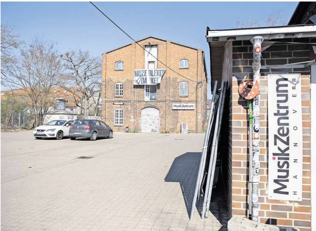
Gewerbe, Kultur und Wohnungen: So will die Stadt das Quartier rund ums Musikzentrum voranbringen. Eine Studie im Auftrag der Stadt beschreibt, wie das Areal rund um das Musikzentrum entwickelt werden kann.

Zugleich weisen die Planer auf Probleme hin. Ein großer Hemmschuh für den Bau von Wohnungen ist der Lärm. Züge donnern am Quartier vorbei, im Musikzentrum finden zum Teil laute Rockkonzerte statt. Und Konzertbesucher stehen nach den Veranstaltungen oft noch fröhlich lärmend vor der Halle. Dennoch sehen die Architekten