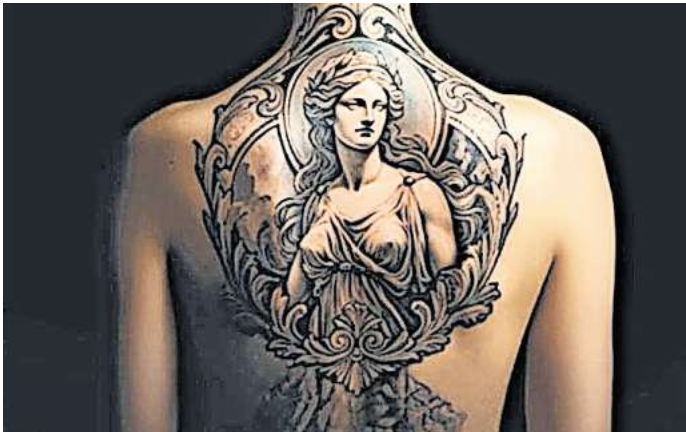
In der neuen Ausstellung im MAK geht es um Tattoos in der Antike und Tattoos mit antiken Motiven.

Ausdruck von Persönlichkeit. Die Ausstellung widmet sich den antiken Tätowierpraktiken in Ägypten, Griechenland und Rom und spannt einen Bogen ins Heute. Gezeigt werden dazu Fotografien zeitgenössischer Tätowierungen von Bildmotiven aus dem antiken Mittelmeerraum, die dafür Porträtierten sprechen über ihre Tattoos. RED