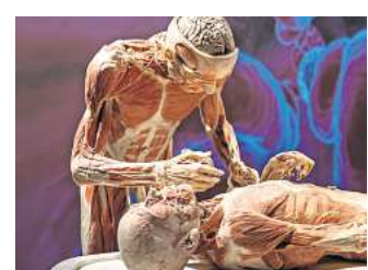
Ein Herzchirurg bei der OP.