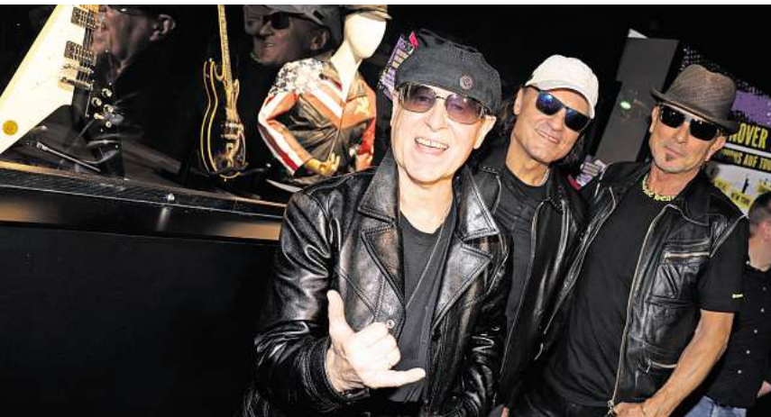
Klaus Meine, Matthias Jabs und Rudolf Schenker bei der Eröffnung der Rockstage im Flughafen Hannover.

Bandgründer Rudolf Schen-ker zeigte sich geschmeichelt von so viel Ehrerbietung. Er erin-nernte daran, dass die Rock-Pro-pheten im eigenen Land lange wenig galten. „Wir haben lan-ge wenig Zuwendung aus Han-nover und generell aus Deutschland bekommen – wir mussten uns dafür ins Ausland verdrücken“, sagte er. „Jetzt aber bekommen wir sie im Überfluss.“