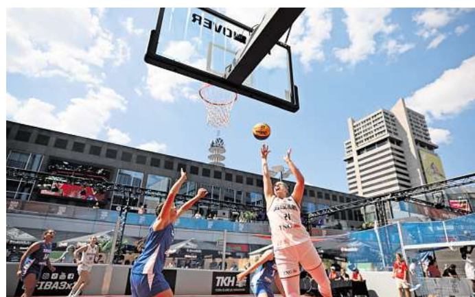
Das 3X3-Basketballfeld am Raschplatz wurde in den vergangenen Jahren sehr gut angenommen.

Zudem lehrt die Erfahrung aus den vergangenen Jahren, dass die Drogen- und Trunkerszene bloß vom Raschplatz verdrängt wird – in Richtung Fernroder Straße, aber auch weiter in Richtung List, wie Anwohner berichteten. Eine nachhaltige Lösung sehe anders aus, meinten Hilfsorganisationen.