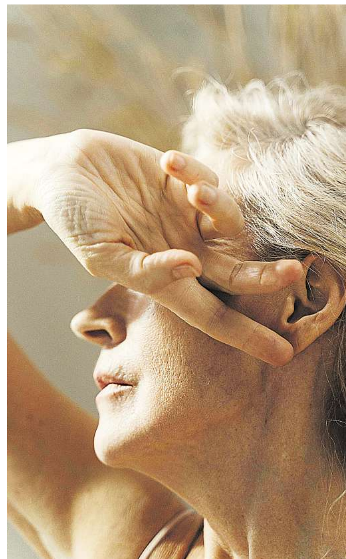
Große Hitze verkürzt langfristig die Lebenserwartung, weil sie Alterungsprozesse beschleunigt.