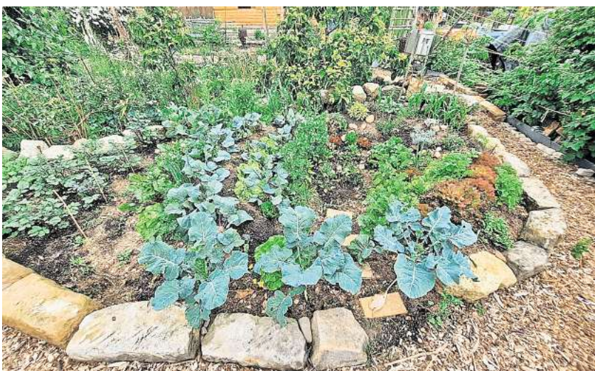
Ein Kraterbeet ist in drei verschiedene Zonen eingeteilt: die tiefe Zone, die Wallzone und die Randzone.

► Schritt 2: Wasser oder Steine im Krater Im Krater sammelt sich Wasser, sodass in der Mitte der Boden feucht ist. Zugleich ist die Windbewegung gering. Der Naturschutzbund Deutschland (NABU) empfiehlt, im Zentrum einen kleinen Teich anzulegen: So steht das Wasser für die angebauten Pflanzen zur Verfügung. Die höhere Feuchtigkeit führt außerdem dazu, dass im Sommer die Luft durch die Verdunstung gekühlt wird, im Winter fungiert sie als Wärmespeicher. So werden die extremen Temperaturunterschiede ausgeglichen. Alternative: Man kann den Boden des Kraters auch mit Steinen auslegen. Sie speichern über den Tag die Sonnenwärme und geben sie in der Nacht ab. ► Schritt 3: Pflanzen für die verschiedenen Zonen Ideal ist diese Art von Beet für den Anbau von Gemüse. Ein Kraterbeet ist in drei verschiedene Zonen eingeteilt: die tiefe Zone im Zentrum, die Hänge und die Wallzone. Unterschiedli-