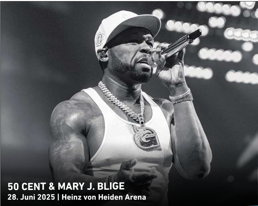
50 CENT & MARY J. BLIGE 28. Juni 2025 | Heinz von Heiden Arena

Ihr persönlicher Ticketservice der HAZ & NP