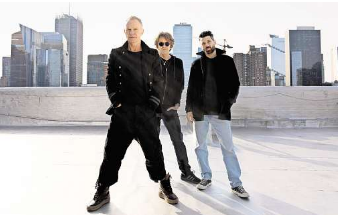
Sting präsentiert die größten Hits aus seiner Diskografie auf der Expo Plaza.

Zu Sting muss man nicht viel sagen. Gordon Sumner, so sein richtiger Name, betrat mit seiner Band The Police 1977 die Musikwelt. Bis zu ihrer Auflösung 1983 bekamen The Police insgesamt sechs Grammys und bescherten den Fans Klassiker wie „Message in a bottle“, „Walking on the Moon“, „Roxanne“, „So lonely“, „De Do Do Do, De Da Da Da“ und das oftmals missverständliche „Every breath you take“. Solo festigte Sting seinen Ruf als exzellenter Musiker mit „An Englishman in New York“, „If You Love Somebody Set Them Free“, „All This Time“ und „Desert Rose“. Zusammen mit dem virtuosen Gitarristen und