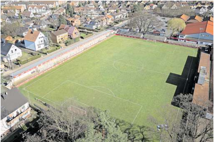
Das Wilhelm-Langrehr-Stadion soll für 10 Millionen Euro tauglich für die 3. Liga gemacht werden.

Etwa zwei Drittel der Kosten will der TSV durch Investoren decken. Und hofft auf Unterstützung der Stadt. Refinanzieren soll sich das Stadion zudem durch andere Nutzungsmöglichkeiten – es könnte sogar eine Event-Arena werden. Den Verbote gibt es in Havelse nicht. Die Pläne für den Neubau hat der Verein schon dem Garbsener Bauausschuss vorgestellt, der zugestimmt hat.