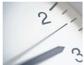
Die Zeit wird in der Nacht auf Sonntag um eine Stunde vorgestellt.