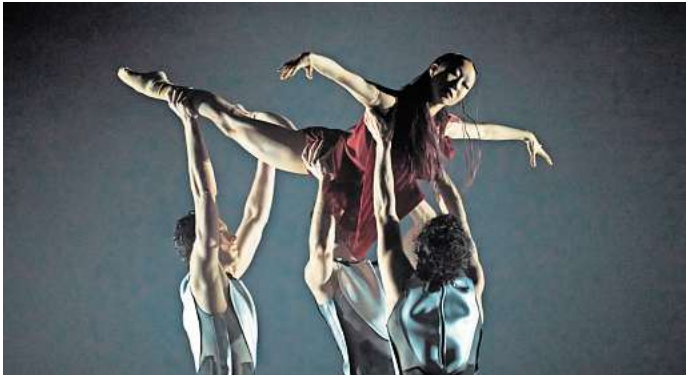
Ballett von Andonis Foniadakis: „Ikarus“.

gen seines Vaters Daedalus zu nah an die Sonne fliegt, nur um zu fallen und zu scheitern, hat seit jeher die menschliche Vorstellungskraft beflügelt. In einer Bewegungssprache voller roher, athletischer Energie lotet Foniadakis Grenzen aus. Die nächste Aufführung beginnt am Freitag, 21. März, ab 19.30 Uhr in der Staatsoper Hannover. 45 Minuten vor Beginn gibt es eine Einführung, Eintrittskarten ab 25,50 Euro, ermäßigt ab 6 Euro. RED