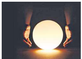
Fotoausstellung „Lichtblick – Menschenwürde schützen“.