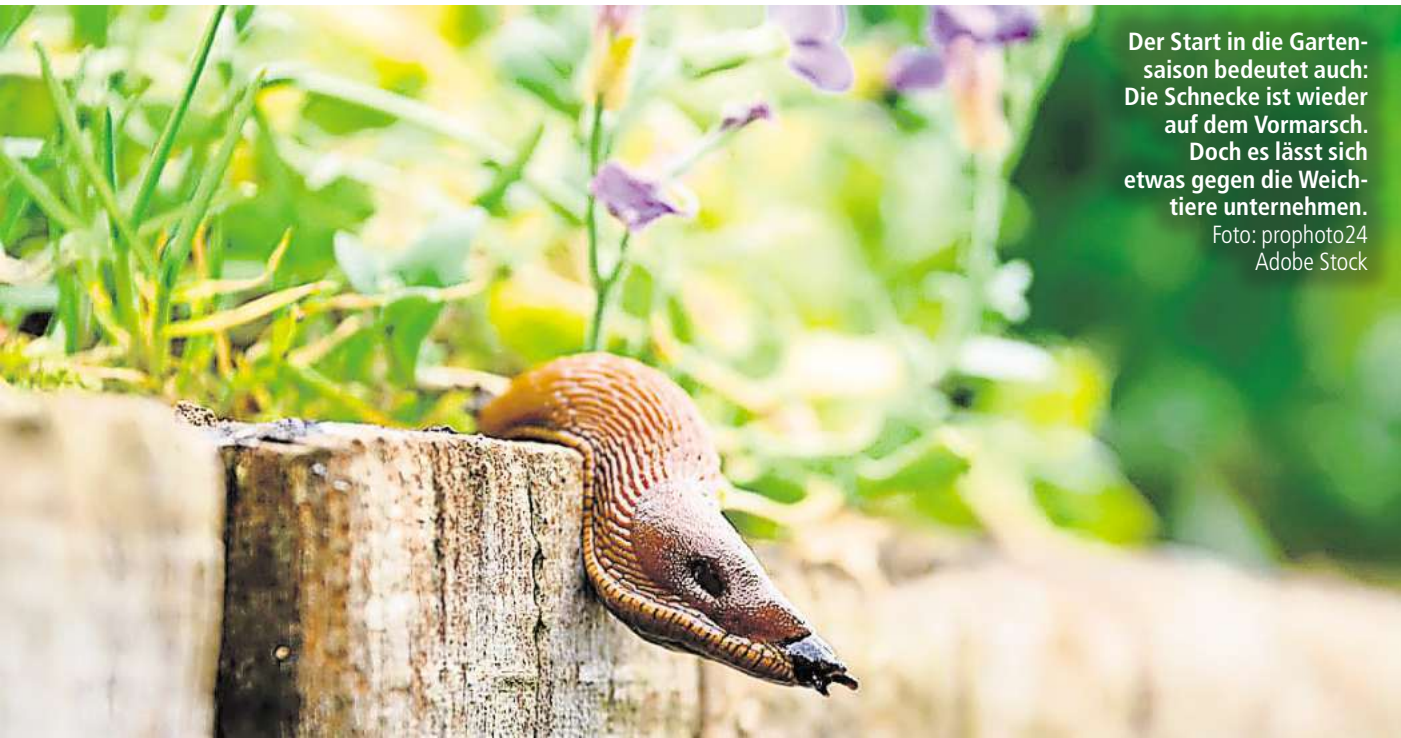
Der Start in die Gartensaison bedeutet auch: Die Schnecke ist wieder auf dem Vormarsch. Doch es lässt sich etwas gegen die Weichtiere unternehmen.