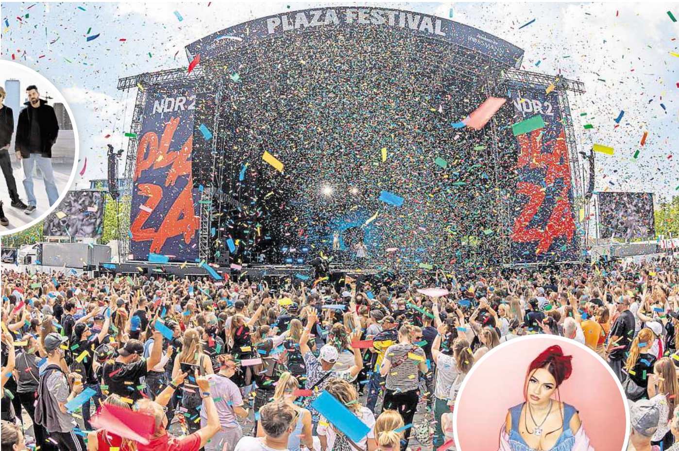
Alle Farben beim NDR2 Plaza Festival 2024 in Hannover