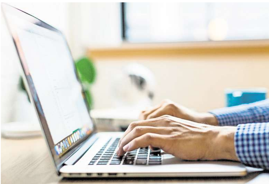
Seit Jahren wächst im Internet ein unregulierter Markt an MPU-Vorbereitungsangeboten.