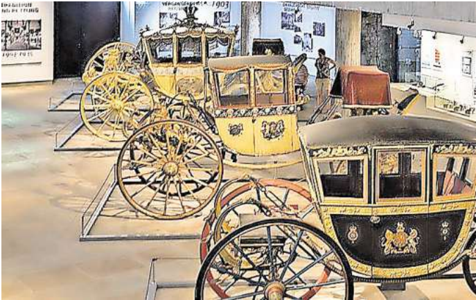
Goldene Gefährte: Die Kuschen aus dem Historischen Museum ziehen vorübergehend ins Schlossmuseum Herrenhausen

Die Kutschenhalle mit ihren goldenen Karossen aus dem 18. Jahrhundert ist seit geraumer Zeit wegen der Sanierung des Museums geschlossen. Die Kutschen sollten in dieser Zeit eigentlich gesichert werden und während der Bauarbeiten in der Halle stehen bleiben. Doch auch den Kutschen-Saal muss die Stadt jetzt umfassend erneuern, sodass alle Exponate ausgeräumt werden müssen. Folglich macht die Stadt aus der Not eine Tugend und verfrachtet die vier Gefährte nach Herrenhausen. Wenn das Historische Museum in der Altstadt 2030 wieder öffnet, sollen die Kutschen zurückgebracht werden.