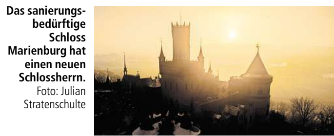
Das sanierungsbedürftige Schloss Marienburg hat einen neuen Schlossherrn.