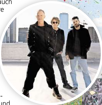
Sting spielt am 6. Juni.

HANNOVER. Als es vor 25 Jahren das erste Festival auf der Expo-Plaza gab, ahnte wohl niemand, dass es diese Konzertreihe auch noch 25 Jahre später geben sollte. Die ersten Jahre gab es sogar am Sonntag noch den Schlagertag – wo unter anderem Hele-Fischer, Roland Kaiser und Andrea Berg auftraten. Schnell kristallisierte sich jedoch heraus, dass es doch eher die Rock- und Popfans waren, die zum Open Air-Wochenende auf die Plaza kamen – konnten sie doch dort Chartstürmer wie unter anderem Wir sind Helden, Silbermond, Seether, Fanta 4, Sportfreunde Stiller, Madcon und Material und Rocklegenden wie die Simple Minds, Status Quo, Meat Loaf, Kim Wilde, OMD und Peter Maffay live erleben.