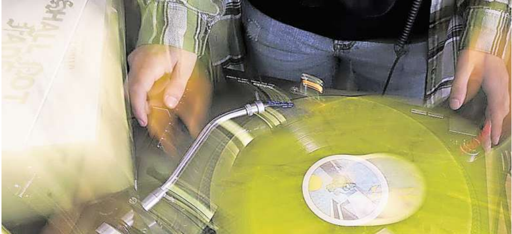
HörFidelity: Unter anderem gibt es einen Workshop rund um Tontechnik.

Alle Informationen zum Programm sind abrufbar unter hörregion-hannover.de