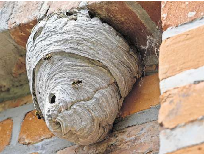
Rechtlich geregelt: Sind sie bewohnt, dürfen Wespennester nur von Fachleuten und aus guten Gründen entfernt werden – im Winter hingegen stehen sie leer, da können Hausbesitzer auch selbst ran.

fernen oder muss ein Experte kommen? Jetzt, wo es unbewohnt ist, darf man das Nest selbst entfernen. Wenn es dann später im Jahr ist und ein neues Nest gebaut wurde, sind da wieder Wespen drin. Das darf man nicht selbst entfernen, das muss man von Fachleuten entfernen lassen per Gesetz.