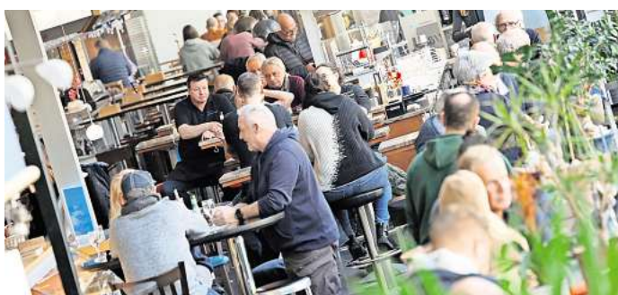
Stimmt der Mix in der Markthalle?