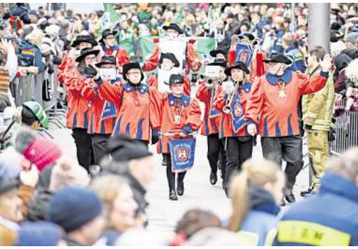
Der Karnevalsumzug überquert auch den Platz der Weltausstellung.

tungsort“ geben. „Unsere Sicherheitsbehörden sind extrem wachsam und tun alles, was möglich ist, um uns vor etwaigen Angriffen zu schützen“, sagte Innenministerin Daniela Behrens. Die Culemannstraße ist bereits ab 9.30 Uhr wegen des Aufbaus der Festwagen gesperrt. BesucherInnen werden gebeten, mit öffentlichen Verkehrsmitteln anzureisen. Wer mit dem Auto anreist sollte die genannten Bereiche weiträumig umfahren. Auf dem Platz der Weltausstellung gibt es auf einer kleinen Bühne schon ab 11.11 Uhr ein Programm zur Einstimmung auf den Umzug.