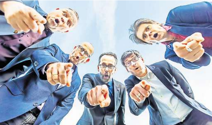
Erklären das Weltgeschehen: Störfall.