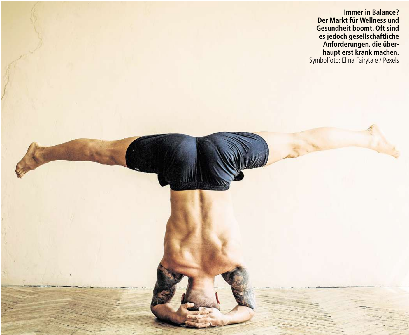
Immer in Balance? Der Markt für Wellness und Gesundheit boomt. Oft sind es jedoch gesellschaftliche Anforderungen, die überhaupt erst krank machen.