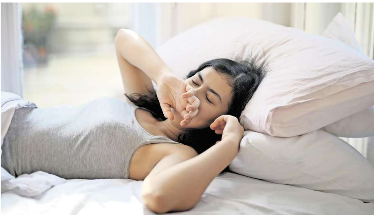
Ausgeschlafen aufwachen: Für viele Menschen ist das schwierig, weil sie falsche Erwartungen an ihren Schlaf haben.

auf acht Stunden kommen, liegt er zwei Stunden wach im Bett. „Das ist ein Teufelskreis“, sagt Lechinger. „Je mehr Sorgen ich mir mache, desto negativer ich selbst meinen Schlaf bewerte, desto schlechter schlafe ich auch.“ ► Nur wer durchschläft, schläft gut: Schon wieder aufgewacht? Keine Panik. Es ist ganz normal, nicht durchzuschlafen. „Wir haben tatsächlich bis zu 20 ganz kurze Wachphasen“, sagt Lechinger. „Die erinnern wir aber nicht mehr, weil wir in der Regel sofort weiterschlafen.“ Auch, wenn man mal länger wach liegt und etwa auf die Toilette muss, sei das nicht schlimm. „Den Schlaf stören die Wachphasen beispielsweise dann, wenn wir dabei negative Gedanken haben.“ ► Wer mittags schläft, kann nachts nicht mehr: Es kommt drauf an. Mittagsschlaf kann sich – egal, in welchem Alter – positiv auf die Lernfähigkeit auswirken. Das zeigt eine Übersichtsarbeit der University of Massachusetts. Doch es ist wichtig, das Schläpfchen nicht auszu dehnen. „Wenn wir nicht länger als 25 Minuten schlafen, stört das den Nachtschlaf meist nicht“, sagt Lechinger. „Bei längeren Schlafzeiten kann es jedoch sein, dass wir in den Tiefschlaf kommen und Schlafdruck abbauen.“ ► Bei Vollmond schläft man schlecht: Viele Menschen klagen bei Vollmond über schlechten Schlaf. Aber ist da was dran? In einer Analyse haben Forscher und Forscherinnen 20.000 Schlafnächte ausgewertet und festgestellt: Es gibt keinen Zu-