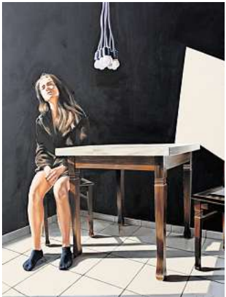
Lillien Grupe: „Die Suche nach sich selbst“, 2019. Öl und Acryl auf Leinwand.