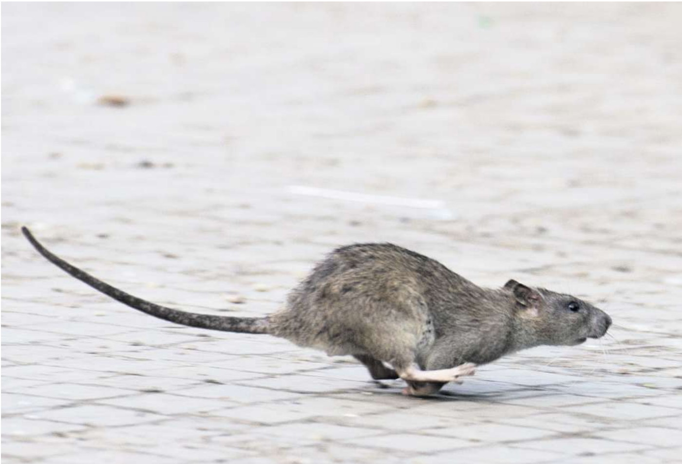
Man kann einiges tun, damit Ratten sich auf dem Grundstück nicht wohlfühlen.

Bauliche Maßnahmen können helfen. So kann man Fensteröffnungen mit Gittern sichern und an Tür- oder Torspalten Bürstenleisten anbringen, so die Deutsche Umwelthilfe. Zudem könne man spezielle Rückstauklappen im Abflusssystem anbringen. Sie sollen verhindern, dass Ratten über die Abwasserrohre in Gebäude eindringen können. Das Landesamt für Verbraucherschutz und Lebensmittelsicherheit in Niedersachsen rät unter anderem dazu: Türen im Haus, der Wohnung