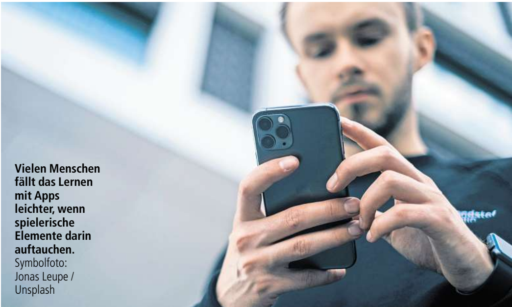
Vielen Menschen fällt das Lernen mit Apps leichter, wenn spielerische Elemente darin auftauchen.