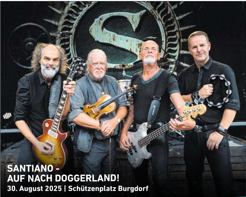
SANTIANO - AUF NACH DOGGERLAND! 30. August 2025 | Schützenplatz Burgdorf

HANNOVER. Fesselnder Essayfilm an der Schnittstelle von Jazzmusik, Geopolitik und kolonialer Macht während des Kalten Krieges: Im Rahmen des Black History Months zeigt das kommunale Kino (KoKi), Sophienstraße 2, „Soundtrack to coup d'etat“ im Original mit Untertiteln. Regisseur Johan Grimmonprez beschäftigt sich mit den afrikanischen Unabhängigkeitsbewegungen in den 1960er Jahren. Die Vorstellung beginnt am Dienstag, 18. Februar, um 18 Uhr. Eintrittskarten (6,50 Euro, ermäßigt 4,50 Euro) können über kokikasse@hannover-stadt.de reserviert werden. RED