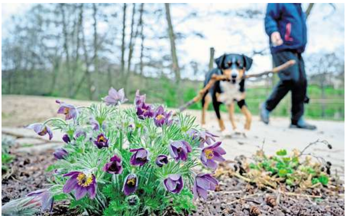
Vorsicht beim Gassigehen: Manche Frühblüher sind für Hunde giftig.

Ist mehr Zeit vergangen, zeigen sich meist schon Symptome, die es dann zu behandeln gilt. Wichtig: Um die Vergiftung gezielt behandeln zu können, bringt man am besten Teile der gegessenen Pflanze oder die Verpackung der Blumenzwiebeln mit in die Tierarztpraxis, empfiehlt Hölscher. So ist bekannt, was gefressen wurde und man kann gezielter behandeln.