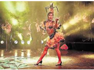
„Pasión de Buena Vista – Live from Cuba“: Live-Band und mitreißende Tänze.