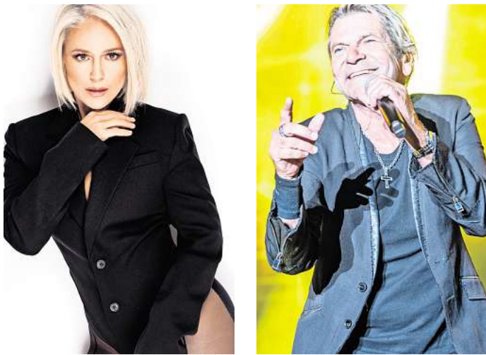
Die Schlagerstars Michelle (links) und Matthias Reim sind in Hannover mit am Start.