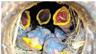
Wenn auf einem alten Nest ein neues Nest gebaut wird, können die Vogelbabys leicht zur Beute werden.

Nistkästen sind vor allem als Bruthilfe für Vögel im Frühjahr gedacht. Dass sie auch im Winter wichtige Aufgaben erfüllen, ist weniger bekannt, so der Nabu. Denn auch im Winter bieten die