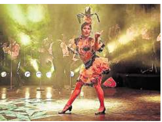
„Pasión de Buena Vista – Live from Cuba“: Live-Band und mitreißende Tänze.