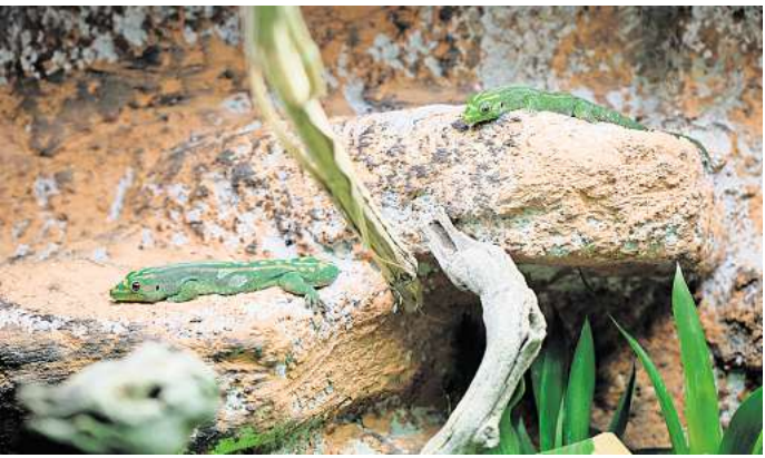
Neuzugänge: Drei Mauritius-Taggeckos haben ihren Weg von einem privaten Halter ins Urwaldhaus des Zoos gefunden.

stolz seine Neuzugänge präsentiert. Zwei neue Geckoarten leben von nun an in benachbarten Terrarien, die der Zoo mithilfe