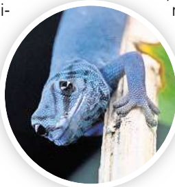
Neu im Zoo: Himmelblauer Zwerggecko

stützt“, erzählt Mitglied Christian Wagner. Um auf die weltweit bedrohliche Situation für die kleinen Reptilien aufmerksam zu machen, wurde der Gecko 2024 zum Zootier des Jahres ernannt. Für den Zoo Hannover war das der Anstoß, Vertreter dieser Art zu beschaffen. Die Tiere stammen von einem privaten Halter. In Zukunft sollen die Geckos Teil eines Zuchtprogramms sein und dabei helfen, Besucher des Zoos für die Bedrohung der Geckopopulation zu sensibilisieren.