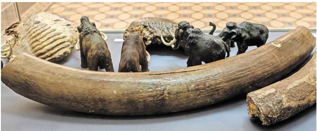
Gewaltig: Die Ausstellung zeigt Stoß- und Backenzähne von Mammuts, gefunden im Leinetal

Die Ausstellung ist bis zum 30. Mai jeweils montags bis freitags von 9 bis 14 Uhr im Niedersächsischen Landesamt für Denkmalpflege, Scharnhorststraße 1, in Hannover zu sehen.