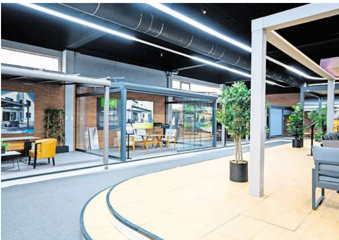
Der Ausstellungsraum bietet auf 750 Quadratmeter eine große Produktvielfalt.

ten und attraktive Garantiebedingungen sorgen zudem für ein stressfreies Erlebnis. Mit über 5.000 zufriedenen Kundinnen und Kunden steht AYLUX für Vertrauen und Qualität. Diese einzigartige Kombination aus Service, technischer Expertise und Leidenschaft macht AYLUX zu einem geschätzten Partner – auch bei anspruchsvollen Projekten. „Unsere Kundinnen und Kunden wissen, dass sie auf uns zählen können“, fasst Zilke zusammen. Besuchen Sie die Ausstellung in Hannover-Döhren und lassen Sie sich inspirieren. Das AYLUX-Team freut sich auf Ihre Ideen! AYlux Hannover GmbH Zeißstraße 66 30519 Hannover Telefon: (0511) 49532238 www.aylux.de