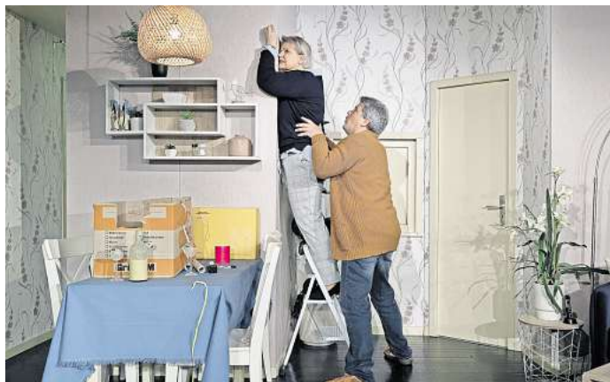
„Das perfekte Geschenk“: Eine Komödie im Neuen Theater.

inszeniert, mit gut gelauntem Ensemble und lustigen Momenten zwischen Flachwitz und noch flacherem Witz vor schönstem Skandinavien-Biedermeier-Bühnenbild. Gleichzeitig aber hat er unaufgeregt versucht, die Geschichte der Familie zu erzählen. Manchmal fehlt ein wenig der dramaturgische Druck, das letzte Stückchen Glanz, der „Das perfekte Geschenk“ so richtig als Kitschkomödie erstrahlen ließe. „Das perfekte Geschenk“ ist noch bis zum 26. April im Neuen Theater zu sehen