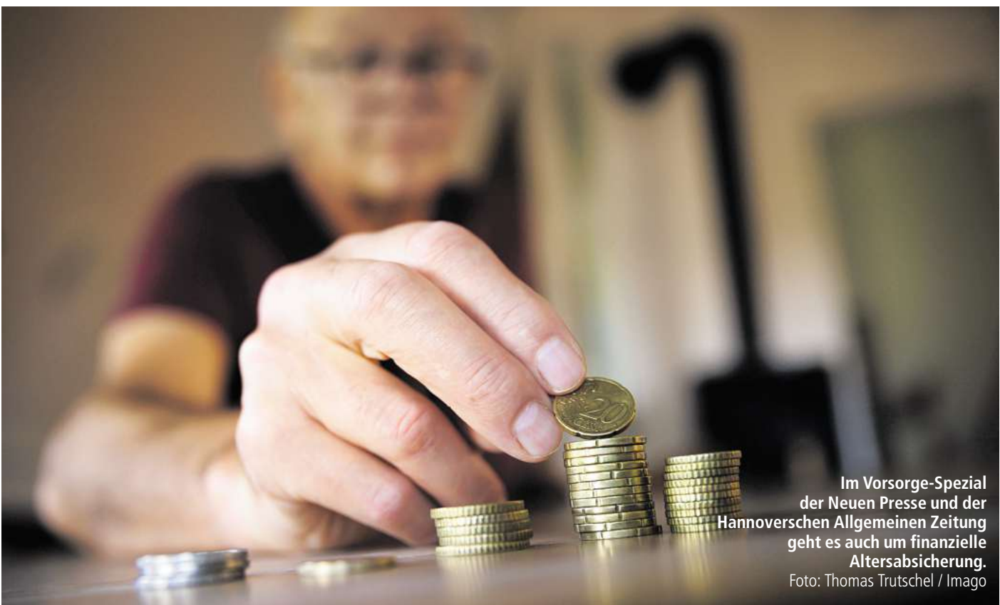
Im Vorsorge-Spezial der Neuen Presse und der Hannoverschen Allgemeinen Zeitung geht es auch um finanzielle Altersabsicherung.

Wer noch keinen Nistkasten hat, sollte nicht zögern, jetzt noch einen aufzuhängen, bevor die Brutzeit beginnt. Der richtige Ort: Nistkästen an möglichst unzugänglichen Orten in zwei bis drei Metern Höhe aufhängen. Einflugloch nach Osten oder Südosten ausrichten, so sind Vögel besser vor Wettereinflüssen geschützt (Wetterseite im Westen wird oft zu feucht, sonnige Südseite zu heiß, Wind kommt meist aus westlicher oder nordwestlicher Richtung). Das Einflugloch sollte leicht nach vorne geneigt sein, damit es nicht hineinregnen kann, auch ein kleiner Überhang wie ein Vordach schützt vor Wassereintritt.