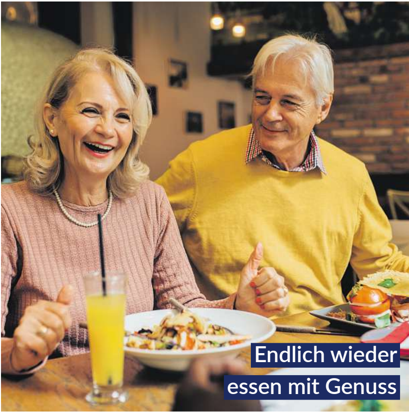
Endlich wieder essen mit Genuss

Bei Blähungen, Völlegefühl und Magenkrämpfen bringen GASTEO Magen-Tropfen mit sechs