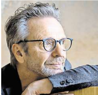
Purple Schulz

Karten gibt es von 33 bis 111 Euro zzgl. Gebühren an allen bekannten Vorverkaufsstellen und online über www.BühneHannover.de/Bühne sowie bei eventim.de.