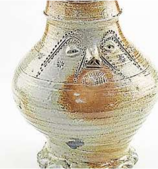
Die Bilder auf holländischen Gefäßen sind Thema einer Familienaktion im MAK.

raum wieder für Sie da sein. Außerdem eröffnen wir eine neue Sonderausstellung“, heißt es seitens des Museums. Für Schulklassen gäbe es Sondereinbarungen. Weitere Informationen erhalten Interessierte per Telefon unter (0511) 16842120 oder per E-Mail unter museumspaedagogik.kestner@hannover-stadt.de .