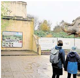
Der Bau des Elefantenhauses verzögert sich.

Die beheizte Laufhalle der Elefanten ist Teil des Masterplans 2025+, in dem der Zoo vor knapp zehn Jahren Ideen zur Weiterentwicklung zusammengefasst und beschlossen hat. Zum Neubau gehört noch ein erweiterter Außenbereich für die Tiere, der den Dickhäutern auch