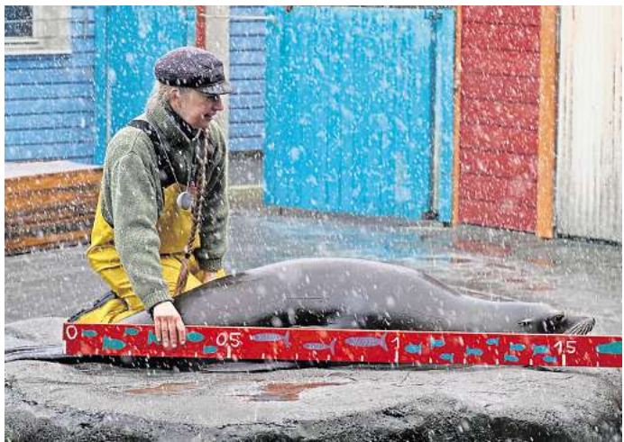
Ganz schön lang: ein kalifornischer Seelöwe.

schungsprojekten auf den Gebieten der Verhaltensbiologie, Tiermedizin, Mikrobiologie, Genetik und KI-basierten Analysen mitgewirkt.