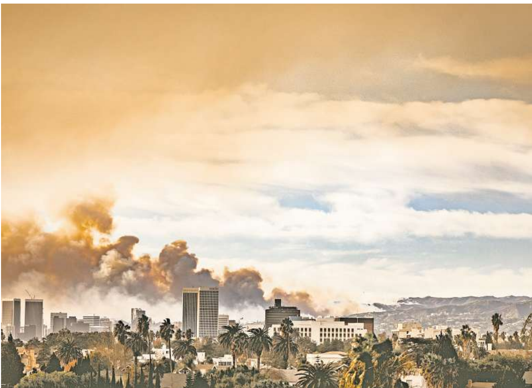
Die Brände in und um Los Angeles sind laut US-Regierung die verheerendsten in der Geschichte Kaliforniens.

eine Welt, die für immer mehr Menschen zur Lebensgefahr wird. „Sie sollten die Spitzenkandidaten und den Wahlkampf wachrütteln, und zu einer echten Debatte über den Schutz vor der Klimakrise und den Ausstieg aus fossilen Energien anregen. Die Zeit ist jetzt.“ Neubauer sagte, lange sei den jungen Menschen versprochen worden, dass richtiger Klimaschutz kommt, sobald die Katastrophen groß genug seien. Das entpuppte sich nun als schlechte Lüge. „Kalifornien steht in Flammen – ein Ereignis, dass nachweislich im Zusammenhang mit der Klimakatastrophe steht. Davor wurde Valencia von Fluten überrollt, davor standen große Teile Deutschlands unter Wasser, vier Mal in 2024.“ Noch nie sei so offensichtlich gewesen, wie gefährlich die Klimakatastrophe ist, und wie dringend Menschen, Lebensgrundlagen und Wirtschaftsräume vor ihr geschützt werden müssten.