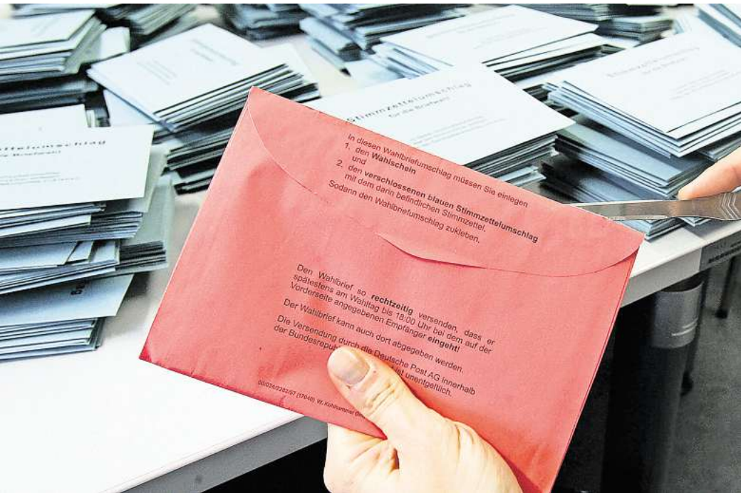
In Vorbereitung: Briefwahlunterlagen können bei Region und Stadt Hannover bereits angefordert werden. Verschickt werden die Unterlagen aber erst Anfang Februar – auch an den Urlaubsort.

Wie genau komme ich an die Briefwahlunterlagen? Wer Briefwahl beantragen will, dem raten Region und Stadt Hannover am besten zeitnah, die Unterlagen zu beantragen. Das können Wähler und Wählerinnen auf unterschiedliche Weise machen. Auf der Internetseite www.wahlhannover.de kann man sich den Antrag herunterladen, das gilt auch für die 20 Umlandkommunen. Der Antrag muss die vollständigen Daten wie Familien- und Vornamen, Geburtsdatum und Wohnanschrift mit Straße, Hausnummer, Postleitzahl und Wohnort enthalten. Wichtig: Eine Antragstellung per Telefon, SMS oder über andere Messengerdienste ist nicht möglich. Der Antrag muss spätestens am Freitag, 21. Februar, um 15 Uhr vorliegen.