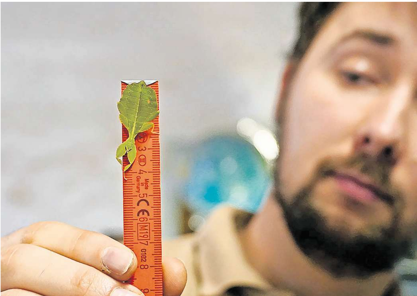
Das wandelnde Blatt wird gemessen.

Über 20.000 Teilnehmende erlebten bei den rund 3.400 Führungen durch den Zoo und hinter die Kulissen besondere Momente. 13.500 SchülerInnen und Schüler aller Altersstufen haben bei über 600 Unterrichtsgängen und Workshops vom Bildungsangebot der Zooschule profitiert. Im Jahr 2024 hat der Erlebnis-Zoo an 35 For-