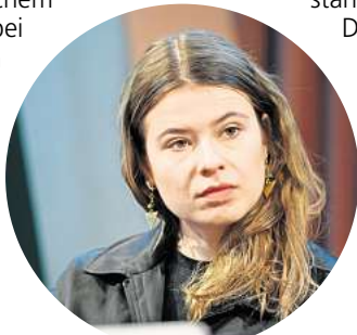
Klimaaktivistin Luisa Neubauer nahm in Berlin an einer Pressekonferenz von Fridays for Future zur aktuellen Klimapolitik teil.

eine Welt, die für immer mehr Menschen zur Lebensgefahr wird. „Sie sollten die Spitzenkandidaten und den Wahlkampf wachrütteln, und zu einer echten Debatte über den Schutz vor der Klimakrise und den Ausstieg aus fossilen Energien anregen. Die Zeit ist jetzt.“ Neubauer sagte, lange sei den jungen Menschen versprochen worden, dass richtiger Klimaschutz kommt, sobald die Katastrophen groß genug seien. Das entpuppte sich nun als schlechte Lüge. „Kalifornien steht in Flammen – ein Ereignis, dass nachweislich im Zusammenhang mit der Klimakatastrophe steht. Davor wurde Valencia von Fluten überrollt, davor standen große Teile Deutschlands unter Wasser, vier Mal in 2024.“ Noch nie sei so offensichtlich gewesen, wie gefährlich die Klimakatastrophe ist, und wie dringend Menschen, Lebensgrundlagen und Wirtschaftsräume vor ihr geschützt werden müssten.