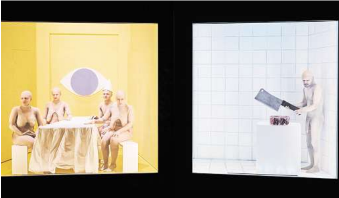
Weitergedacht: „Animal Farm“ nach George Orwell im Ballhof.

Weitere Termine und Tickets: staatstheater-hannover.de