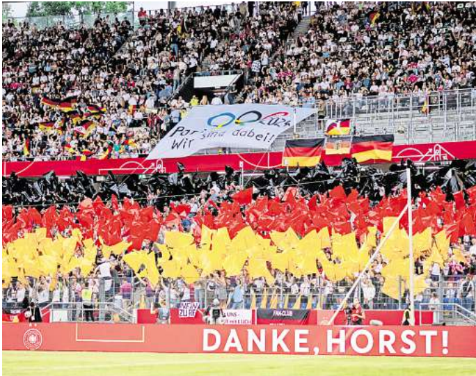
So soll es wieder sein: Ausgelassene Stimmung auf den Rängen beim Spiel der Frauen-DFB-Auswahl gegen Österreich in Hannover im Juli 2024.

Aber Hannover rechnet auch mit Einnahmen. Dabei orientiert sich die Stadt an den Einkünften, die die Austragungsstädte der Männerfußball-EM in 2024 erzielten. „Teilbranchen wie die Tourismusindustrie, insbesondere Hotellerie, Gastronomie und Verkehrswesen, haben merklich von der Veranstaltung profitiert“, schreibt die Stadt in ihren Plänen. Der wirtschaftliche Nutzen übersteige die Ausgaben um ein Vielfaches.