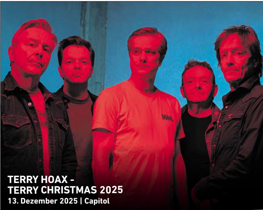
TERRY HOAX - TERRY CHRISTMAS 2025 13. Dezember 2025 | Capitol

HANNOVER. In der Stadtbibliothek Döhren, Peiner Straße 9, können Nähbegeisterte ab 16 Jahren am Montag, 27. Januar, von 17 bis 19 Uhr beim Nähtreff gemeinsam Lesezeichen aus Stoff nähen. Ob Anfänger oder Fortgeschrittene, alle sind willkommen. Das Team der Bibliothek stellt alles zur Verfügung, was gebraucht wird – Stoffe, Nähmaschinen und Fäden. Wer teilnehmen möchte, sollte sich anmelden unter (0511) 168-49140 oder Stadtbibliothek-Doehren@Hannover-Stadt.de .