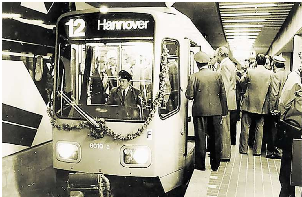
26. September 1975: Die Station unter dem Hauptbahnhof wird feierlich eröffnet.

Die Ursprünge des Großen Gartens reichen ins Jahr 1675 zurück. Herzog Johann Friedrich wollte den Gutshof seines Vaters zu einer Sommerresidenz umwandeln. Entstanden war zunächst ein Lustgarten. Weiterentwickelt wurde er dann während der Amtszeit von Kurfürst Ernst August. Seine Frau, Kurfürstin Sophie, gestaltete den Garten. Orientierung boten dabei holländische Barockgärten. Die Kurfürstin hatte ihre Jugend in Holland verbracht. Bis 1714 entwickelte sich so der Große Garten in seiner heutigen Form und Größe: Ein regelmäßiges Rechteck begrenzt durch einen künstlichen Wassergraben und Baumreihen. Erst 1936 wurde der Garten von der Stadt Hannover erworben und so der Öffentlichkeit zugänglich.