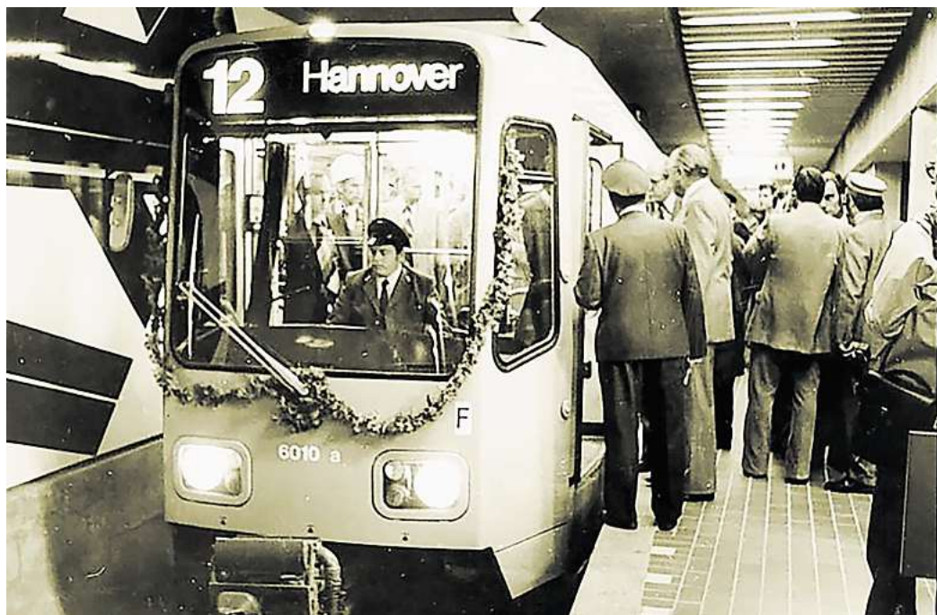
26. September 1975: Die Station unter dem Hauptbahnhof wird feierlich eröffnet.

Die Ursprünge des Großen Gartens reichen ins Jahr 1675 zurück. Herzog Johann Friedrich wollte den Gutshof seines Vaters zu einer Sommerresidenz umwandeln. Entstanden war zunächst ein Lustgarten. Weiterentwickelt wurde er dann während der Amtszeit von Kurfürst Ernst August. Seine Frau, Kurfürstin Sophie, gestaltete den Garten. Orientierung boten dabei holländische Barockgärten. Die Kurfürstin hatte ihre Jugend in Holland verbracht. Bis 1714 entwickelte sich so der Große Garten in seiner heutigen Form und Größe: Ein regelmäßiges Rechteck begrenzt durch einen künstlichen Wassergraben und Baumreihen. Erst 1936 wurde der Garten von der Stadt Hannover erworben und so der Öffentlichkeit zugänglich.