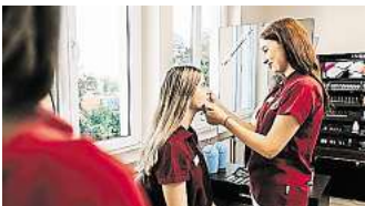
Das Cosmetic College Hannover lädt am 17. Januar zu einem Tag der offenen Tür ein

Das Cosmetic College Hannover lädt zudem jeden Donnerstag ab 15 Uhr zur Ausbildungsberatung ein. Um eine Voranmeldung wird gebeten. Mehr unter meincosmeticcollege.de .