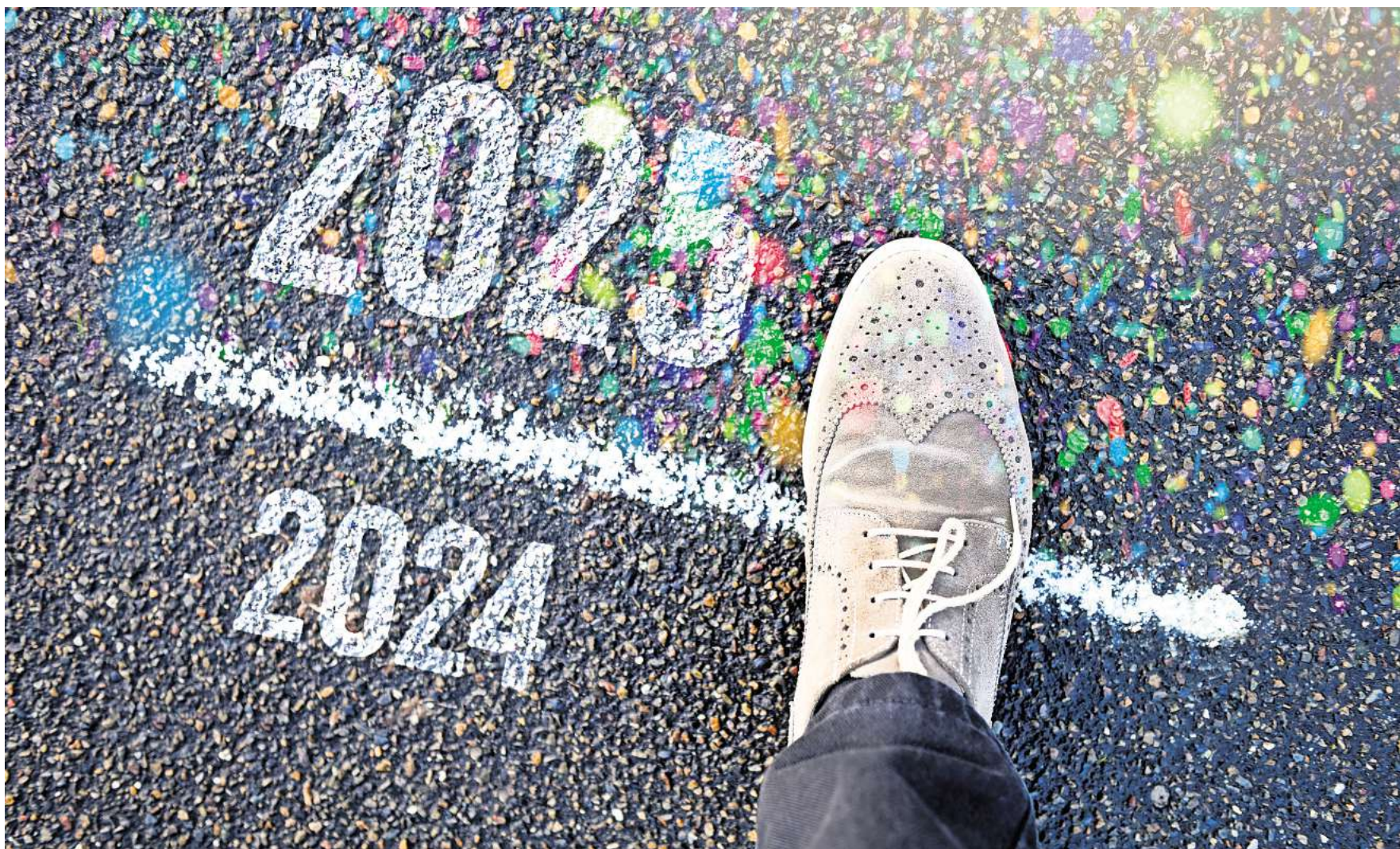
Auf der Schwelle zum neuen Jahr: 2024 liegt hinter uns – 2025 bringt einiges an Veränderungen.

Endgültiges Aus für die Blauen Säcke in der gesamten Region Hannover: Ab Januar 2025 be-liefert der Abfallentsorger Aha den Einzelhandel nicht mehr mit