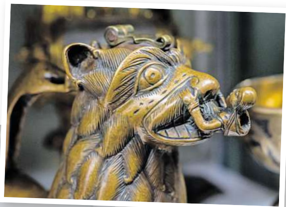
Ein Türzieher aus der Marktkirche.