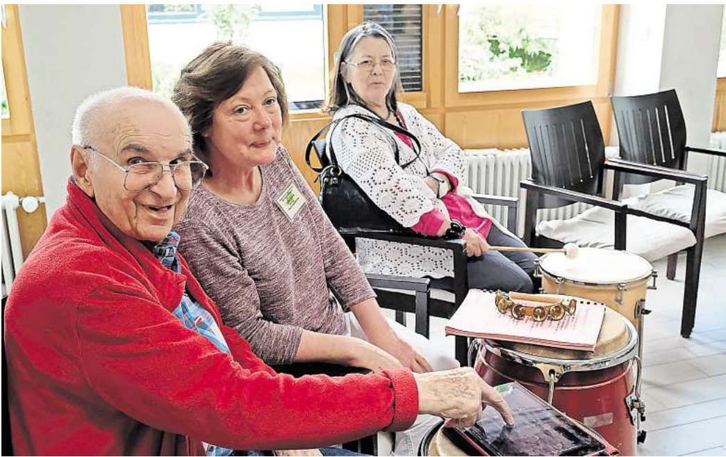
Das neue „Lebenswerk3“-Projekt startet im Frühjahr 2025

Eigene musikalische Talente entdecken, selbst künstlerische Werke schaffen und kulturelle Erlebnisse mit anderen teilen – dazu haben gesundheitlich und mobilitätseingeschränkte ältere Menschen kaum Gelegenheit. Das will die Landesarbeitsgemeinschaft Rock in Niedersachsen e.V. (LAG Rock) mit einem neuen Projekt ändern. „Lebenswerk3“ ermöglicht Bewohnerinnen und Bewohnern von Pflegeheimen die kulturelle Teilhabe durch den Einsatz von digitalen Medien und analogen Musikinstrumenten. Aus Lebenserinnerungen entstehen mithilfe von Musik-Apps zum Beispiel Songs oder Hörspiele, die in Digitalkonzerten den Teilnehmenden der anderen Einrichtungen präsentiert werden. Angeleitet werden die wöchentlichen Kurse über drei Jahre hinweg von Tandem-Teams aus musikpädagogischen Profis und jungen Assistenzkräften. Die Workshops in den Einrichtungen werden im Frühjahr 2025 beginnen. Die Seniorinnen