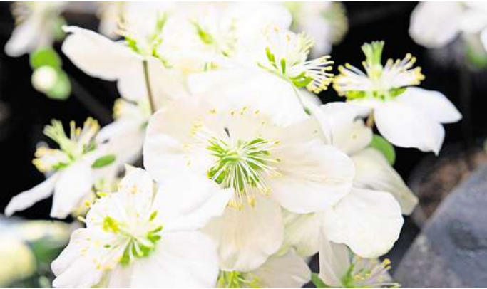
Die Christrose öffnet dank Züchtung ihre Blüten zu Weihnachten.