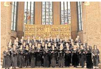
Der Bachchor Hannover singt weihnachtliche Musik in der Marktkirche.

HANNOVER. Vier Typen und vier Mikrofone, das fünfte Weihnachtsalbum im Gepäck, und nach über 20 Band-Jahren noch immer voller frischer Ideen: Maybeop bringen ihr Weihnachtskonzert zum Album „Schöner Schein“ auf die Bühne im Theater am Aegi. Das A-cappella-Quartett entstaubt dabei Klassiker wie „Heidschi Bumbeidschi“ oder „Carol of the Bells“ und kleidet die festlichen Melodien in ein neues Gewand. Und auch Eigenkompositionen fehlen nicht, wie immer mit Augenzwinkern, vom tragikomische Tango „Der Tod des Weihnachtsmanes“ bis zur Deutsch-Rap-Parodie „KNG of LightZ“, in der klargestellt wird, wer die Hütte mit dem höchsten Bling-Bling-Faktor hat. Drei Termine für die Konzerte stehen noch an: Sonnabend, 21. Dezember, ab 19 Uhr, und Sonntag, 22. Dezember, ab 14 Uhr und ab 19 Uhr.