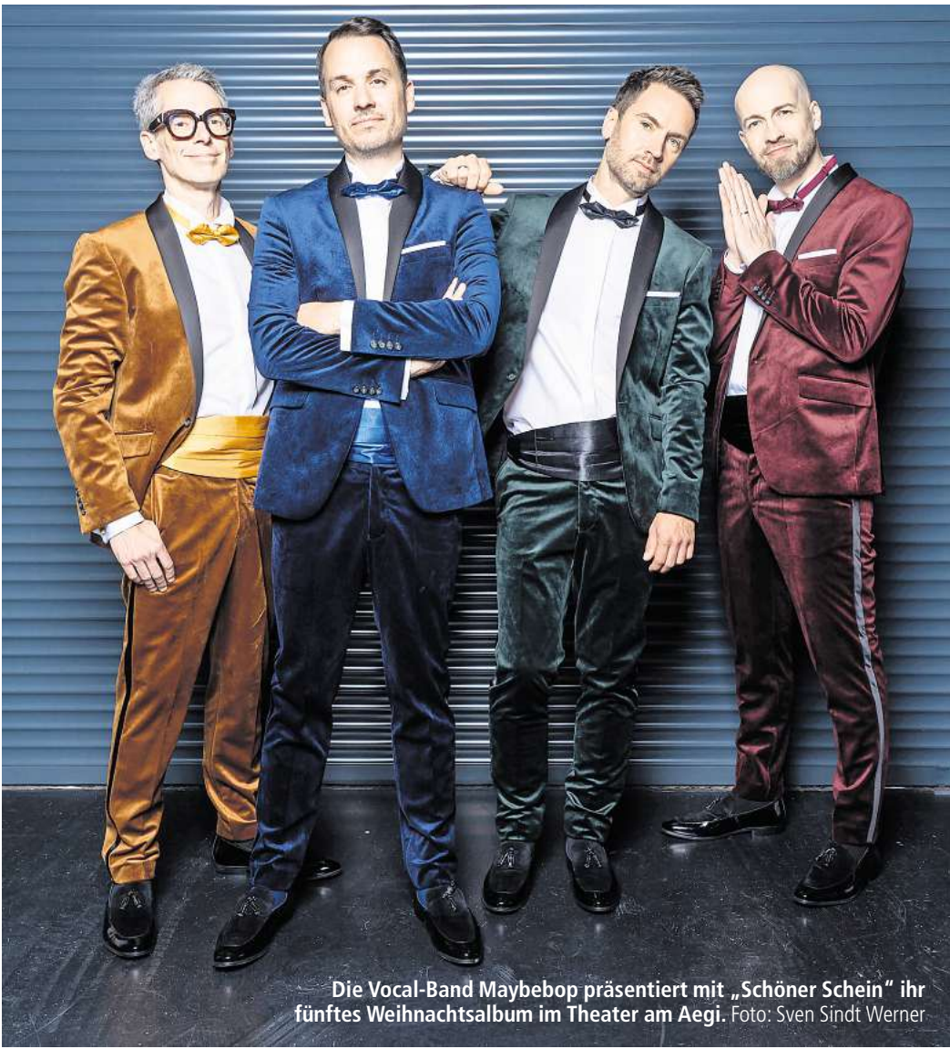
Die Vocal-Band Maybebop präsentiert mit „Schöner Schein“ ihr fünftes Weihnachtsalbum im Theater am Aegi.