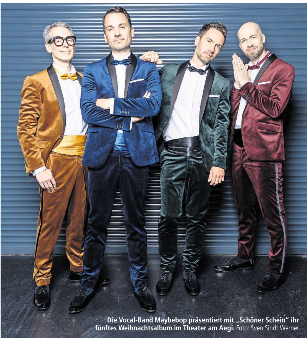
Die Vocal-Band Maybeop präsentiert mit „Schöner Schein“ ihr fünftes Weihnachtsalbum im Theater am Aegi.