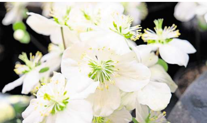
Die Christrose öffnet dank Züchtung ihre Blüten zu Weihnachten.