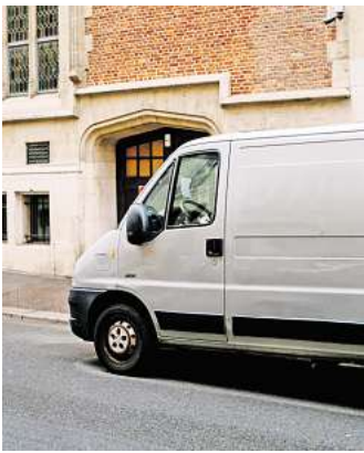
Immer wieder teilen Eltern auf WhatsApp Warnungen über angebliche Kinderfänger in weißen Vans. Die wahren Zahlen zeigen jedoch ein gänzlich anderes Bild.

Tatsächlich, und das macht die Sache eben kompliziert, beruhen manche der Meldungen in der Region Hannover nachweislich auf echten Sichtungen. Ein Beispiel aus Kirchhorst in Isernhagen: Ein Autofahrer hat am 23. August 2024 ein Mädchen im Grundschulalter angesprochen. Das bestätigt die Polizei, die den Halter des Fahrzeugs ermitteln konnte. Doch dieser habe, so die Behörde, das Mäd-