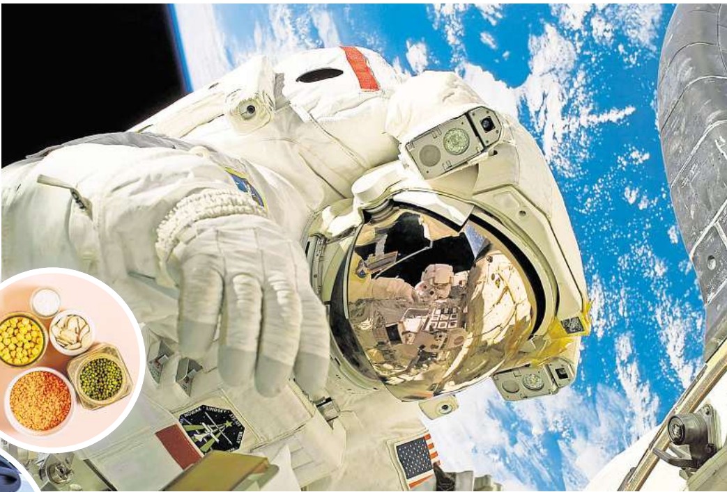
Hannovers Hochschulen beleuchten das Thema Nachhaltigkeit aus unterschiedlichen Perspektiven. So geht es unter anderem um Raumfahrt, klimafreundliche Ernährung sowie Mobilität und Logistik.