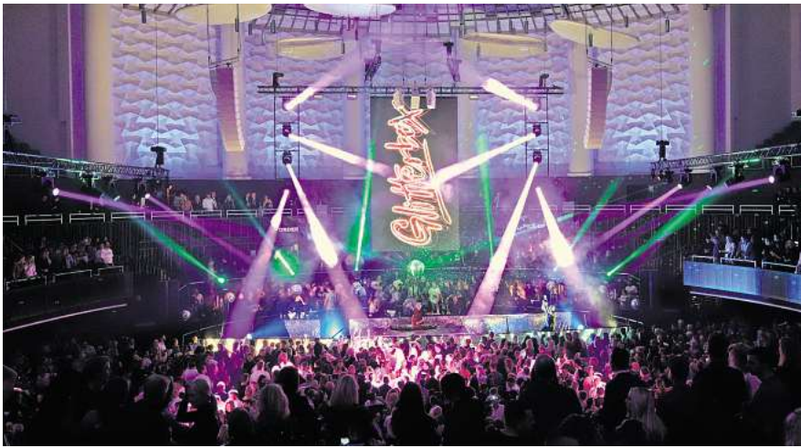
Ausgelassene Stimmung bei der Glit- terbox.