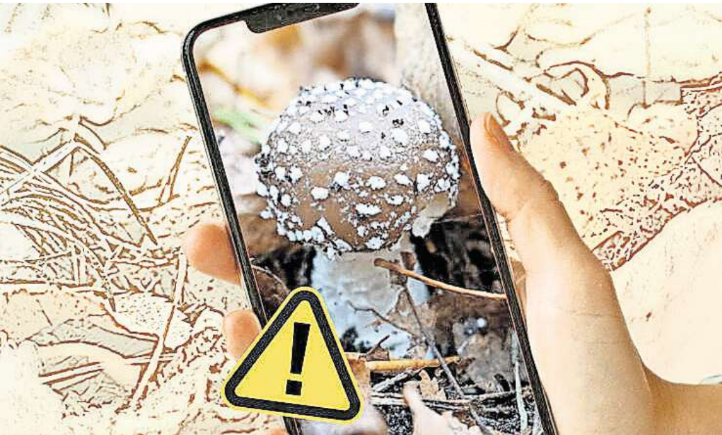
Nicht darauf verlassen: Pilzbestimmungs-Apps liegen nicht immer richtig.

Eine vierte App, die mir von mehreren Seiten empfohlen wurde, ist das virtuelle Lexikon „Meine Pilze“. Statt einer Bilderkennung müssen die Nutzer hier Merkmale selbst eingeben. Nach dem Ausschlussprinzip werden dann mögliche Arten angegeben – gemeinsam mit einem Prozentsatz, zu dem sie mit den angegebenen Merkmalen übereinstimmen. Leider gelingt es mir mit keinem der gefundenen Pilze, ein hundertprozentiges Match zu finden. Zu ge-