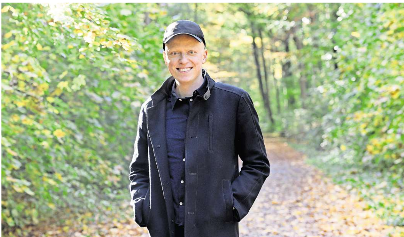
Strahlt mit der Sonne um die Wette: Hannovers SPD-Chef und Bundestagsabgeordneter Adis Ahmetović in der Eilenriede.

Der Hannoveraner verließ abrupt die Sitzung, setzte sich ins Auto. „Ich kam damit nicht klar. Es war wie ein Anschlag auf mein Leben.“ Unzählige Dinge gingen ihm durch den Kopf: Was mache ich jetzt? Wie sage ich es meiner Familie? Wie gehe ich beruflich damit um? „Politik ist ein brutales Geschäft und kann gnadenlos sein. Klar, wusste ich das vorher auch. Jetzt hatte es aber eine andere Bedeutsamkeit. Bis zu dem Zeitpunkt fühlte ich mich unverletzlich.“ Beruflich gesehen naheliegend: Ahmetović hatte es als Sohn bosnischer Flüchtlinge mit seiner politischen Karriere weit gebracht. Als Teenie tritt er in die