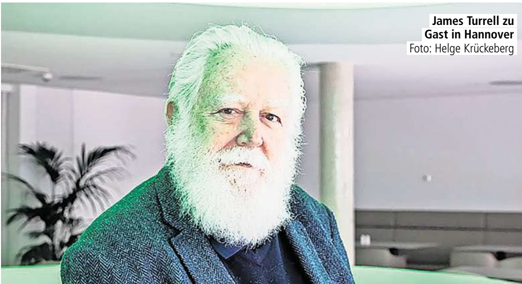
James Turrell zu Gast in Hannover

Turrell wurde gebeten, einen Beitrag zum Skulpturengarten des Sprengel Museums zu schaffen. Dieser „Garten“ ist ein