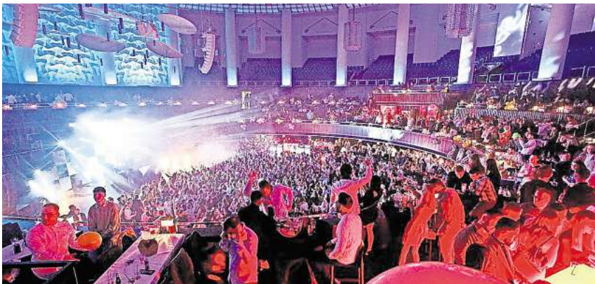
Silvester im HCC: Rund 4500 Menschen werden hier zusammen ins neue Jahr feiern.

Das Album heißt „Schlicht und ergreifend“. Es ist auch oft ergreifend. Sonderlich schlicht kommt es einem nicht vor. Sie haben musikalisch noch einmal ausgetestet, was geht, oder? Das Schöne ist ja, wir können jetzt alles machen, was wir wollen. Es ist nun mal das letzte Album. Wir haben uns einfach noch mal ein bisschen ausgetobt, sodass jetzt auch ein paar harte Rockgeschichten dabei