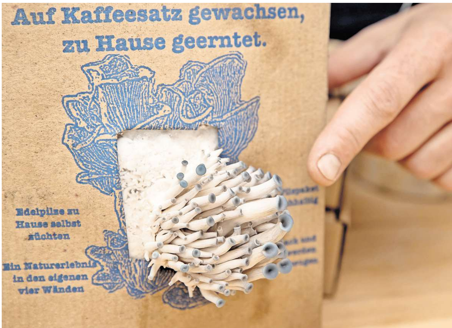
Austernpilze kann man beispielsweise auch auf dem Balkon mithilfe eines Pilzzuchtsatzes aufziehen.

Der Weihnachtsmarkt in der Altstadt beginnt am 25. November, dem Montag nach Totensonntag. Es warten der traditionelle Wunschbrunnenwald, das finnische Weihnachtsdorf und der Mittelaltermarkt auf die Besucher, die an 125 Ständen vorbeischießend durch den Markt gehen können. Der Weihnachtsmarkt rund um die Marktkirche dauert bis zum 22. Dezember, täglich von 11 bis 21 Uhr. Auch an der Lister Meile geht es vom 25. November bis 22. Dezember vorweihnachtlich in der Fußgängerzone zu, ebenfalls täglich geöffnet von 11 bis 21 Uhr.