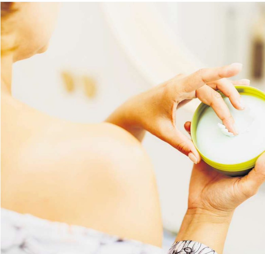
Weichmacher können unter anderem durch Kosmetikprodukte in den Körper gelangen.

Der Einsatz von Weichmachern und anderen Umweltgiften wird durch die Chemikalienverordnung der Europäischen Union (REACH) geregelt. Darin wurden die Phthalat-Weichmacher DEHP, DBP, DIBP und BBP als besonders gefährlich eingestuft. Wegen ihrer hormonartigen Wirkung im Organismus können sie ungeborenen Kindern während einer Schwangerschaft schaden und die Fruchtbarkeit und die Fortpflanzungsfähigkeit beeinträchtigen. Genau wie die Substanz DIPP dürfen sie nur noch nach Genehmigung verwendet werden. In Spielzeug und anderen Artikeln für Babys und Kinder sind mehrere Weichmacher generell verboten. Auch in Lacken, Kleb- oder Duftstoffen, die an die breite