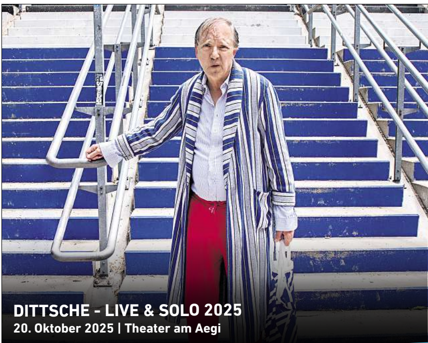
DITTSCHKE - LIVE & SOLO 2025 20. Oktober 2025 | Theater am Aegi

Ihr persönlicher Ticketservice der HAZ & NP