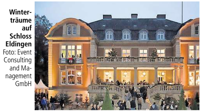
Winterträume auf Schloss Eldingen