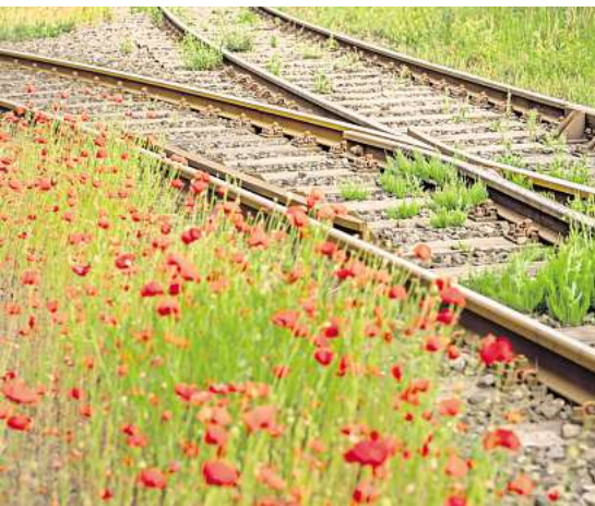
Es grünt: Zwischen Schienen und Schwellen wächst überra-schend viel und Vielfältiges.

Komplexer ist die Überwachung der Pflanzen. Planmäßig werde der Bewuchs so zurückgeschnitten, dass sechs Meter links und rechts der Gleise kein Gewächs zu finden ist. Auch dahinter habe die Bahn – so schreibt sie auf ihrer Internetseite – morsche und sturmfällige Bäume im Blick. Was beschnitten wird, landet danach meistens als Biomasse in der Natur oder werde auf