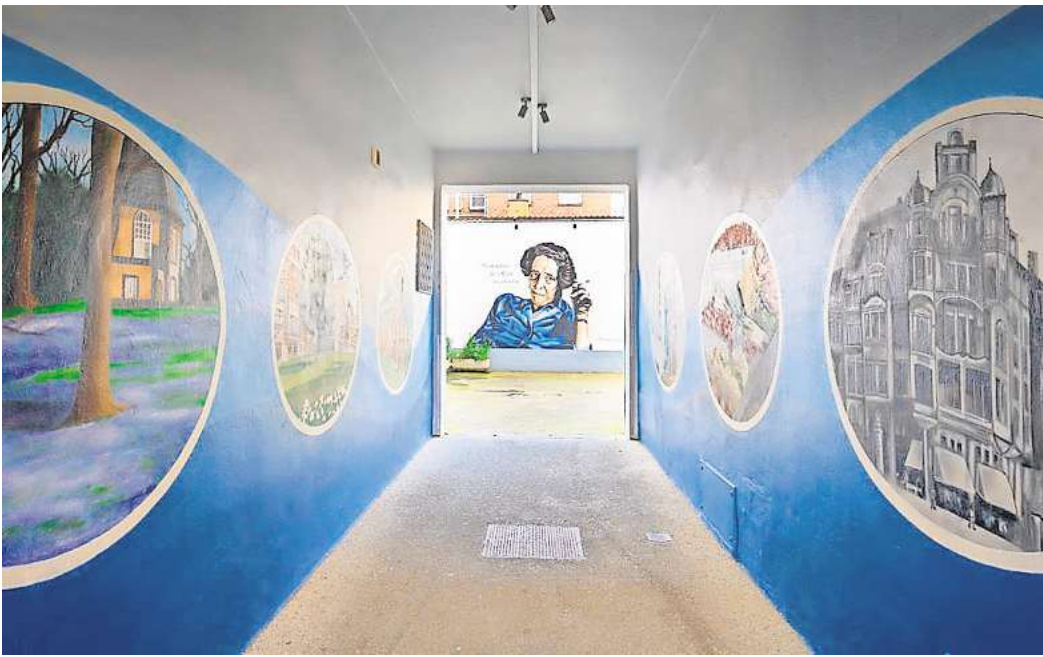
Hannah-Arendt-Bild an ihrem Geburtshaus an der Falkenstraße in Linden.