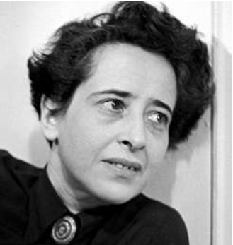
Hannah Arendt, 1906 in Linden geboren, war eine jüdische Philosophin und Publizistin, deren Werk bis heute aktuell ist.