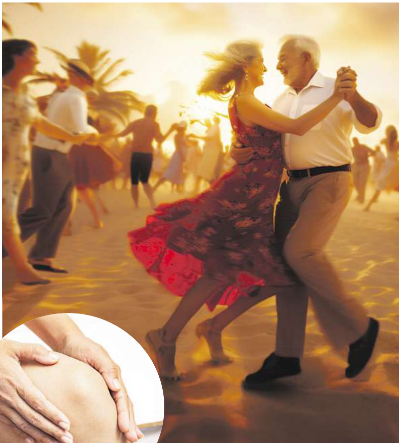
Das CBD Gel enthält Menthol und Minzöl für beanspruchte Muskeln.

Der älteste Hanf-Fund in Europa liegt in Deutschland und wird auf 5500 v. Chr. datiert. Damals war jedoch noch nicht zu erahnen, dass insbesondere der Cannabisstoff CBD einmal einen Siegeszug in der Wissenschaft antreten würde. Heute ist ein regelrechter CBD-Boom ausgebrochen. Kein Wunder, denn anders als der ebenfalls bekannte Cannabisstoff THC (Tetrahydrocannabinol), der für die berauschende Wirkung der Cannabisdroge verantwortlich ist, macht CBD weder „high“ noch abhängig. Sogar die WHO (Weltgesundheitsorganisation) stuft CBD als sichere Substanz mit einem geringen Risiko ein. 1 Zahlreiche Studiendaten deuten bereits darauf hin, dass CBD einen äußerst vielfältigen therapeutischen Nutzen haben könnte.