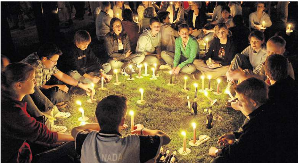
Stimmungsvoll: Ein „Lichtermeer“ – wie hier bei der Kirchentageröffnung am 25. Mai 2005 am Hohen Ufer in Hannover – soll es auch im kommenden Jahr wieder geben.

„Es wird der erste multireligiöse Kirchentag“, verspricht Landesbischof Ralf Meister im Blick auf die zahlreichen Brückenschläge zu anderen