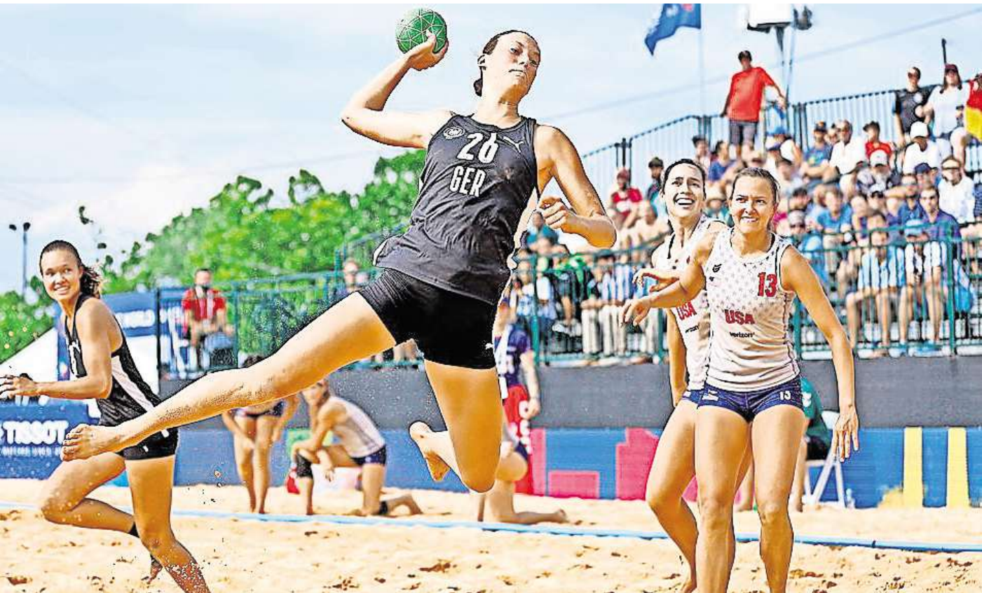
Unter freiem Himmel: Auch Beachhandball gehört zum Programm der World Games