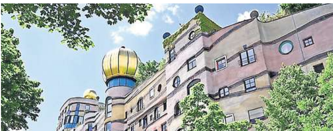
Architektur von Friedensreich Hundertwasser.

Architektur. Der Künstler und Aktivist gestaltete Plakate zu Ökologie-Themen, die in hohen Auflagen gedruckt und deren Verkaufserlöse an Umweltorganisationen gespendet wurden. Er pflanzte über 100.000 Bäume, legte Teiche und Wasser-Kläranlagen an, nutzte Sonnen- und Wasser-Energie und verwendete die Humus-Toilette an allen seinen Wohnorten. Die Ausstellung zeigt auf rund 20 großformatige Texttafeln gut ein Dutzend Bauvorhaben Hundertwassers, von denen sich einige zu wahren Publikumsmagneten entwickelt haben. Darüber hinaus werden seit