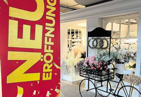
Die neue Boutique-Abteilung im Erdgeschoss glänzt mit viel Detailliebe.

Sonntag, 6. Oktober 2024, 13-18 Uhr. Das Möbelhaus und das XXXL-Restaurant haben bereits ab 12 Uhr geöffnet (Möbelverkauf ab 13 Uhr).