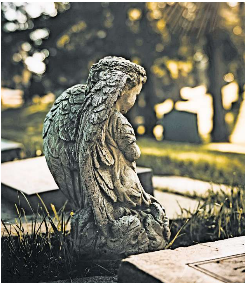
Der Friedhof ist ein Ort des Gedenkens, aber auch der lokalen Geschichte und der Ruhe und Erholung im Grünen.

Für die Jahre 2024 und 2025 liegt der Fokus der Aktionstage auf dem Thema „Endlich und lebendig“. Mit vielfältigen Programmen wie Führungen, Lesungen, musikalischen Darbietungen und Informationsständen sollen Interessierte am Tag des Friedhofs die Gelegenheit erhalten, Friedhöfe aus einer neuen Perspektive zu betrachten. Nicht nur soll der Umgang mit Tod und Trauer enttabuisiert werden, es geht auch darum, den Friedhof als Ort des Lebens zu begreifen, der Erholung und der Erinnerung.