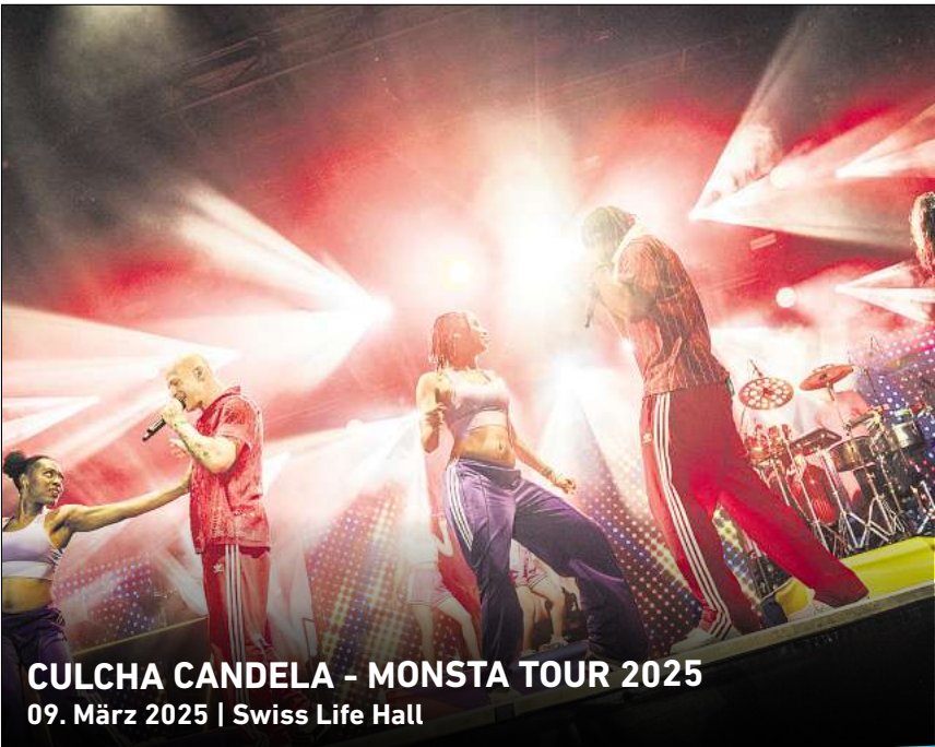
CULCHA CANDELA - MONSTA TOUR 2025 09. März 2025 | Swiss Life Hall