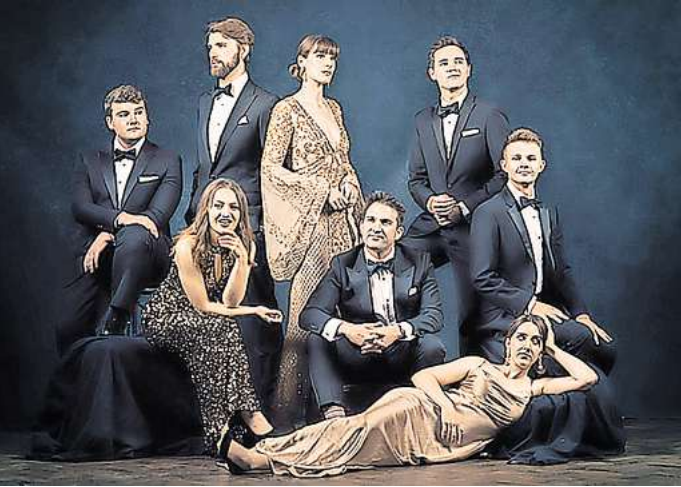
Das für den Grammy nominierte Ensemble Voces8 aus Großbritannien – am 27. September, Christuskirche

und ausdruckstarkem Gesang gemischt werden. Am 27. September kann man in der Christuskirche das britische Vokalensemble Voces8 mit seinem Programm „London by Night“ erleben. Die acht Sängerinnen und Sänger von Voces8 wurden 2023 nominiert für einen Grammy und gehören zu den führenden Gruppen weltweit. Die Popularität, vor allem beim jungen Publikum, ist bemerkenswert. Ihre Musikvideos haben hunderttausende Aufrufe und die Alben wurden millionenfach gehört. Außergewöhnlich wird es am 28. September in der Galerie Herrenhausen. Der Bundesjugendchor