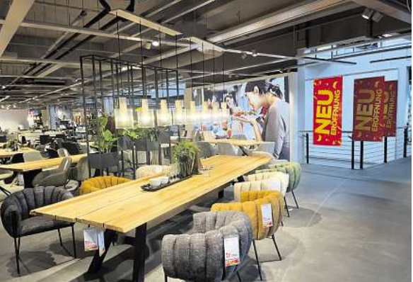
Es ist angerichtet: Nur noch ein paar Tage bis zur großen Neueröffnung - und auch danach warten Highlights.