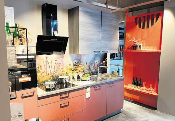
XXXL-Auswahl mit Riesenqualität: Eine von 130 Ausstellungsküchen in der frisch renovierten Küchenabteilung.