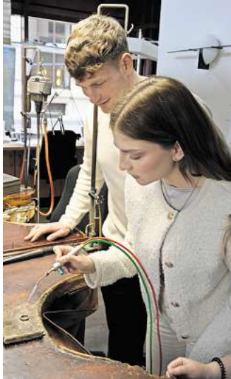
Erinnerungen für das Leben: In der Goldschmiede Ephesus können Brautleute individuelle Ringe fertigen.

Gold- und Silberschmiede Ephesus Georgsplatz 3A 30159 Hannover info@ephebus.de