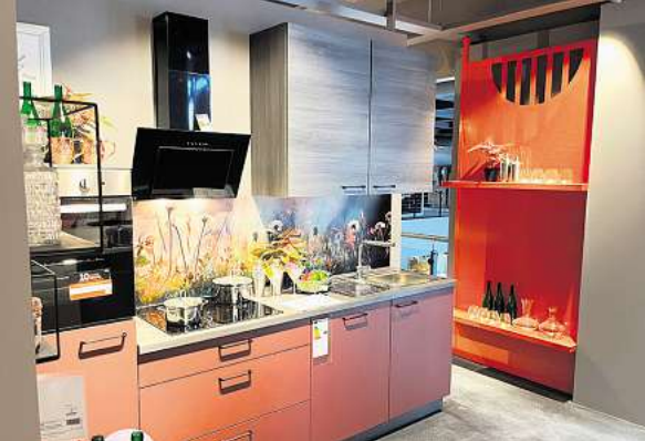
XXXL-Auswahl mit Riesenqualität: Eine von 130 Ausstellungsküchen in der frisch renovierten Küchenabteilung.