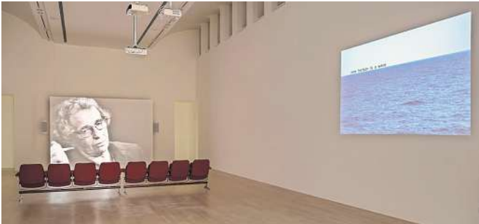
Die Kestner Gesellschaft widmet sich in einer Ausstellung dem Wirken von Hannah Arendt.