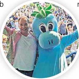
Party für kleine und große Entdecker mit „Max der kleine Dino“.

☐ Fahrgäste können Busse, Bahnen und Nahverkehrszüge im gesamten GVH (Zonen A/B/C) am 8. September den ganzen Tag kostenfrei nutzen. Das vollständige Bühnenprogramm des Entdeckerfestes sowie Tourenziele in der Stadt und Region zum Entdeckerstag stehen auf entdeckertag.de.