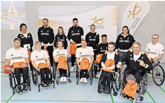
Greifen in Paris nach Medaillen: Niedersachsens Teilnehmer der Paralympischen Spiele wurden in Hannover verabschiedet.