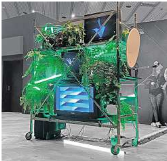
Tajny Projekt: „Transmission“.