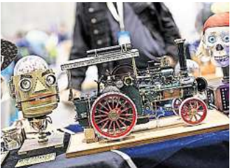
Von witzigen Gadgets bis hin zu nützlichen Erfindungen gibt es viel zu entdecken.