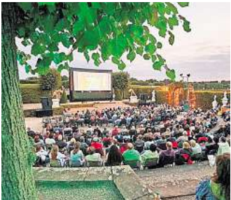
Kino unter freiem Himmel.

Am Sonnabend, 17. August, feiert „Bob Marley: One Love“ das Leben und die revolutionäre Musik der Reggae-Legende. Ab 20 Uhr gibt es Live-Musik, der Film läuft ab 21.30 Uhr. Von den Clubs in Camden zum Weltruhm, vom kometenhaften Aufstieg bis zum tiefen Absturz berührt die Biographie der Ausnahme-Sängerin und Musikerin Amy Winehouse in „Amy Winehouse: Back to Black“ am Sonntag, 18. August,