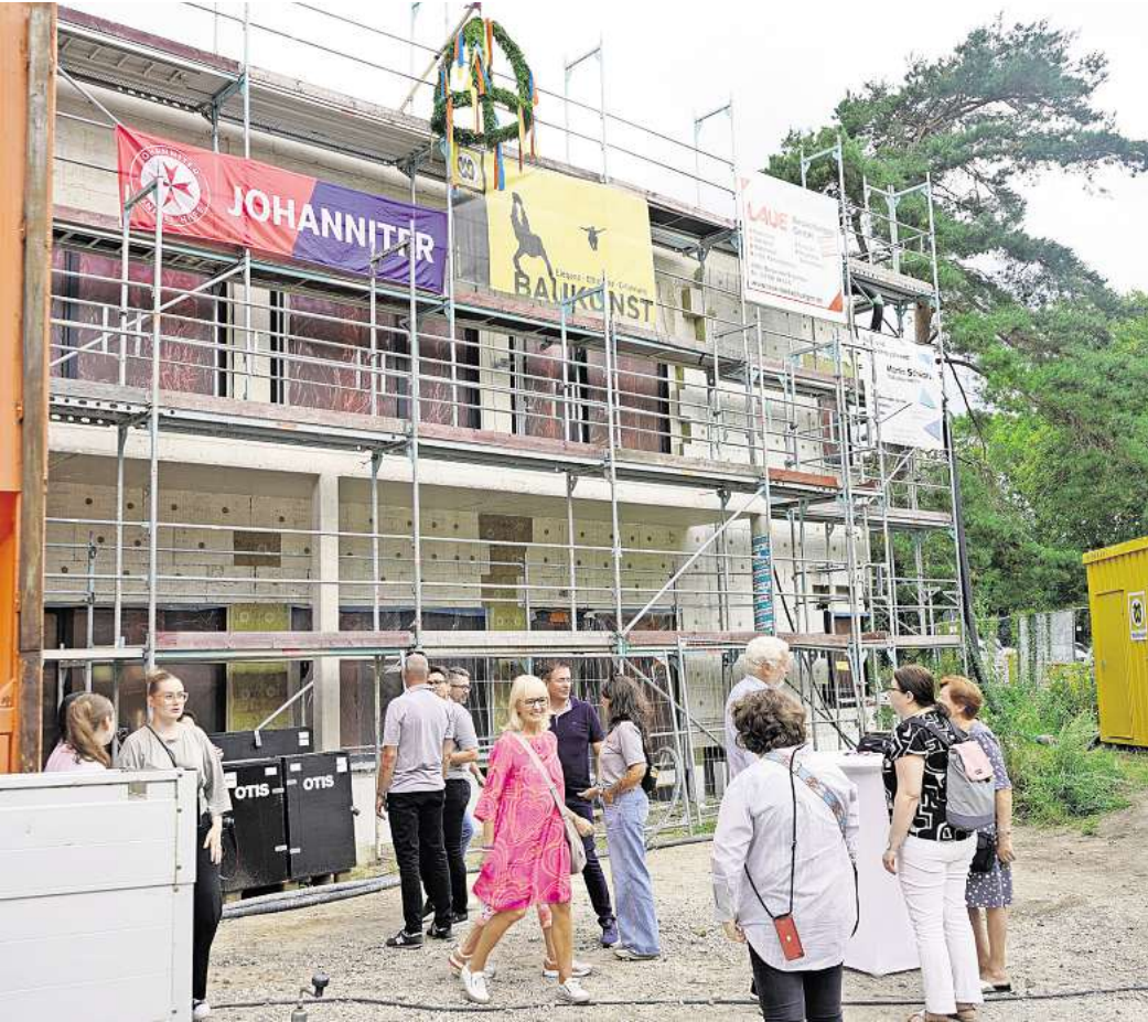
Die neue Kita Uferzeile in Hannover-Misburg: 80 Kinder sollen hier ab August kommenden Jahres einen kreativen Ort zum Spielen und Wachsen finden.