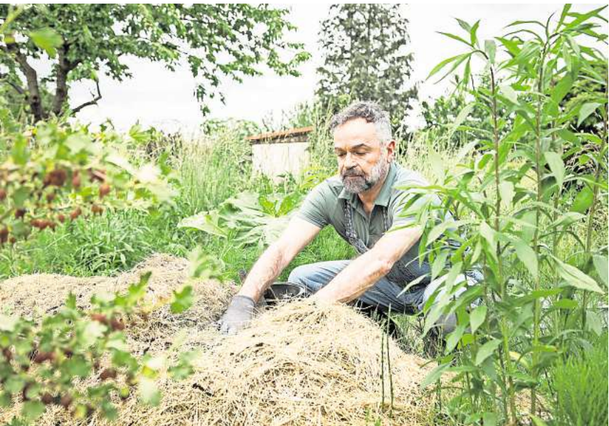
Exotische Pflanzen bereichern den Garten. Doch die Schädlinge, die sie vielleicht einschleppen, werden dem Ökosystem schnell gefährlich.

Auch innerhalb der EU sollte auf die Mitnahme von „Pflanzen oder Bodenmaterial“ verzichtet werden. Wer unbedingt Pflanzen mitnehmen möchte, sollte sich vorab bei dem Pflanzenschutzdienst seines Bundeslandes informieren. Mit einem Pflanzengesundheitszeugnis können Pflanzen und Pflanzenerzeugnisse aus Nicht-EU-Ländern in der Regel legal und ohne Gefahr eingeführt werden. Seriöse Pflanzenhändler können ein solches Gesundheitszeugnis häufig mitliefern.