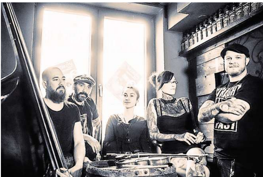
Feinster Pub Rock mit The Hoochigans am 23. Au- gust.