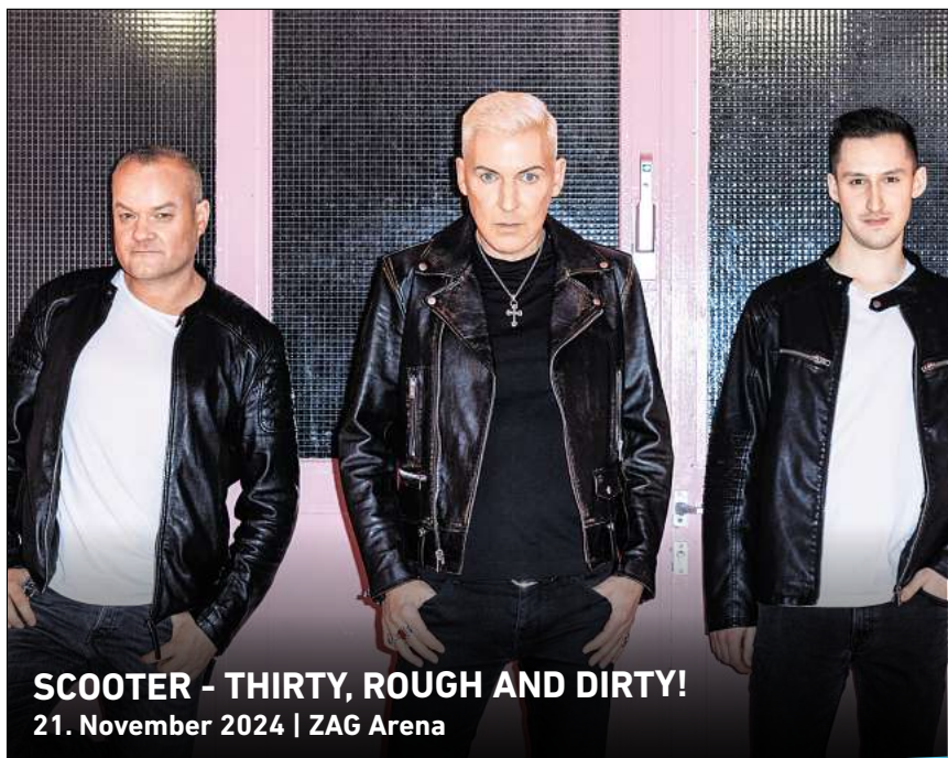
SCOOTER - THIRTY, ROUGH AND DIRTY! 21. November 2024 | ZAG Arena