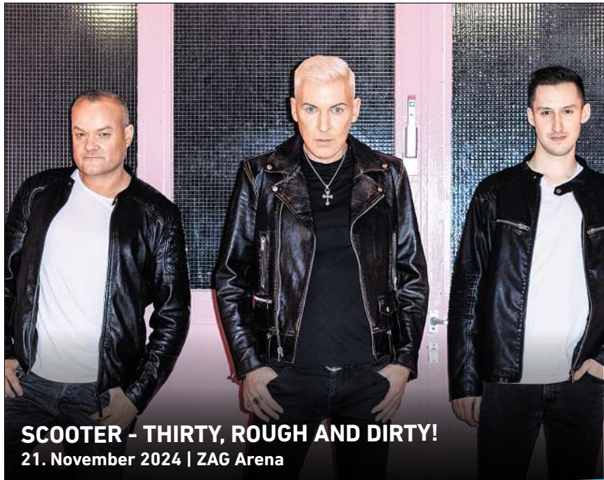
SCOOTER - THIRTY, ROUGH AND DIRTY! 21. November 2024 | ZAG Arena

HANNOVER. Das solare Wanderkino Cinema del Sol zeigt am Mittwoch, 7. August, auf dem Platz an der Lutherkirche in Hannovers Nordstadt den Film „Sultanas Traum“ (FSK 16 / 86 Minuten) im Original mit deutschen Untertiteln. Die junge Künstlerin Inés stößt in einer indischen Buchhandlung auf „Sultana’s Dream“, einen Science-Fiction-Band, der vor mehr als hundert Jahren von einer Frau namens Rokeya Hos-sain geschrieben wurde. Fasziniert von den kühnen Visionen einer Unbekannten begibt sich Inés auf eine hypnotische Reise quer durchs Land – auf der Suche nach dem sagenumwobenen „Ladyland“ und ihren verloren geglaubten Träumen. Filmbeginn ist gegen 21 Uhr mit einbrechender Dunkelheit, bei sehr schlechtem Wetter findet die Veranstaltung nicht unter dreiem Himmel, sondern in der Kirche statt. Sitzgelegenheiten sind vor Ort vorhanden. Der Eintritt ist frei, Spenden sind willkommen. Kontakt und Anmeldung: Nicole Bock, n.bock@elm-mission.net , Telefon (0511) 1215293. RED