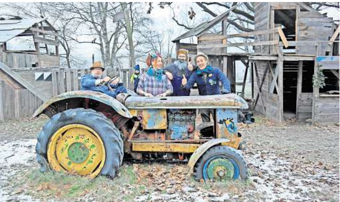
Egon und die Treckerfahrer kommen zum Open-Air in Vahrenwald.

Power Plush verbinden ab 20.30 Uhr Einschläge aus verschiedenen Jahrzehnten Popgeschichte, bewegen sich irgendwo zwischen Woodstock und College Rock, blumigem Indie, Post-Punk und Alternative aus der Zukunft – getrieben von federleichter Unmittelbarkeit, trotzdem voller Strom und immer mit dem Herzen voraus. RED