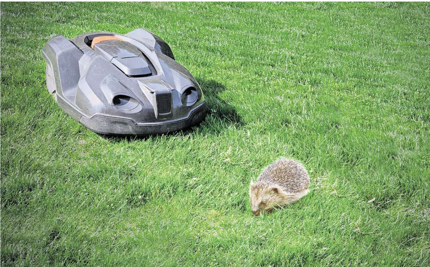
Tödliche Gefahr: Immer mehr Igel werden durch Mähroboter schwer verletzt oder getötet.

und verletzt ihn mit seinen messerscharfen Klängen“, sagt Berger. Der Igel könnte vor dem Rasenschneidegerät weglaufen, schnell genug wäre er, in den meisten Fällen tut er das aber nicht. „Auch bei Igel gibt es die Forschenden und die Schützenden, aber beide Persönlichkeitstypen reagieren ähnlich bei Mährobotern: Sie bleiben starr sitzen und warten ab, sie igeln sich ein“, sagt Berger. Lediglich beim Alter habe man Unterschiede festgestellt können, wenn auch marginal. „Die jungen Igel waren etwas neugieriger, die älteren eher scheu.“ Sitzen bleiben sie in den meisten Fällen trotzdem – egal ob jung oder alt.