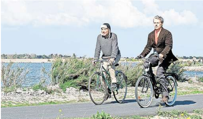
Das Cinema del Sol zeigt den Film „Molière auf dem Fahrrad“.

Schauspielkollege ist auf dem Höhepunkt seiner eigenen Karriere und möchte Serge für sein nächstes Projekt gewinnen. Der Eintritt ist frei, Spenden willkommen. Getränke und Snacks werden vor Ort verkauft. Eigene Sitzgelegenheiten wie Picknickdecke oder Stühle können mitgebracht werden. RHR