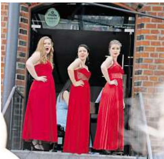
Klassik in der Altstadt am Alten Rathaus.