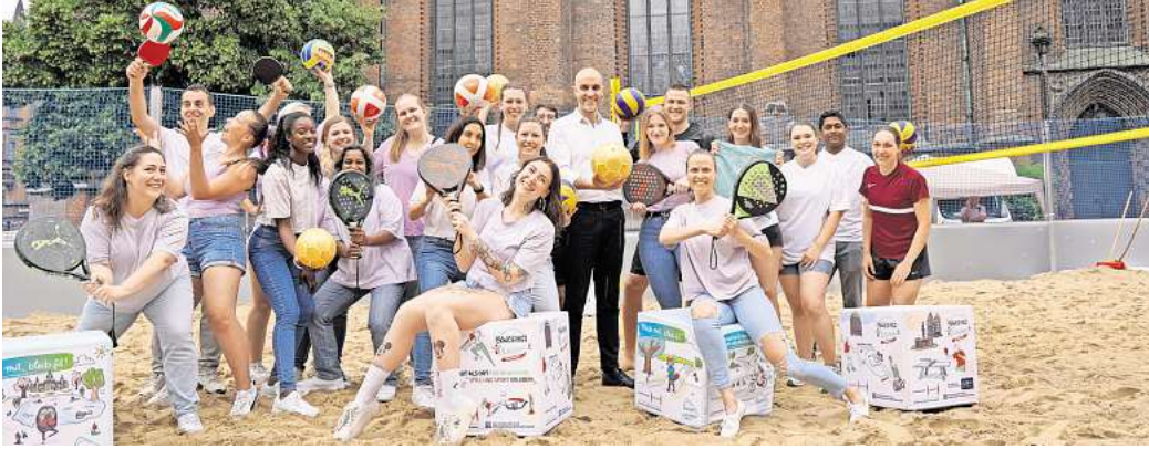
Eröffnung an der Marktkirche: Oberbürgermeister Belit Onay (Mitte) sieht in dem kostenlosen Sportangebot eine Möglichkeit, die Innenstadt neu zu beleben.