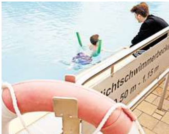
Einzeltraining: Für Kinder ohne Wassererfahrung nehmen sich die Trainer besonders viel Zeit.

Kinder lernen schnell in einem solchen Schwimmkursus, wenn Eltern ihren Nachwuchs früh an Wasser gewöhnen, mit ihnen