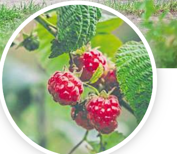
Nach der Himbeer-Ernte sollte man sich ans Zurückschneiden machen.

Sie werden im nächsten Jahr Früchte liefern. Wenn auch nach diesem Rückschnitt noch mehr als sieben bis acht Pflanzen pro Meter übrig bleiben, lichten Sie die Himbeeren etwas aus und entfernen sie überzählige Pflanzen. Die einzelnen Triebe, die