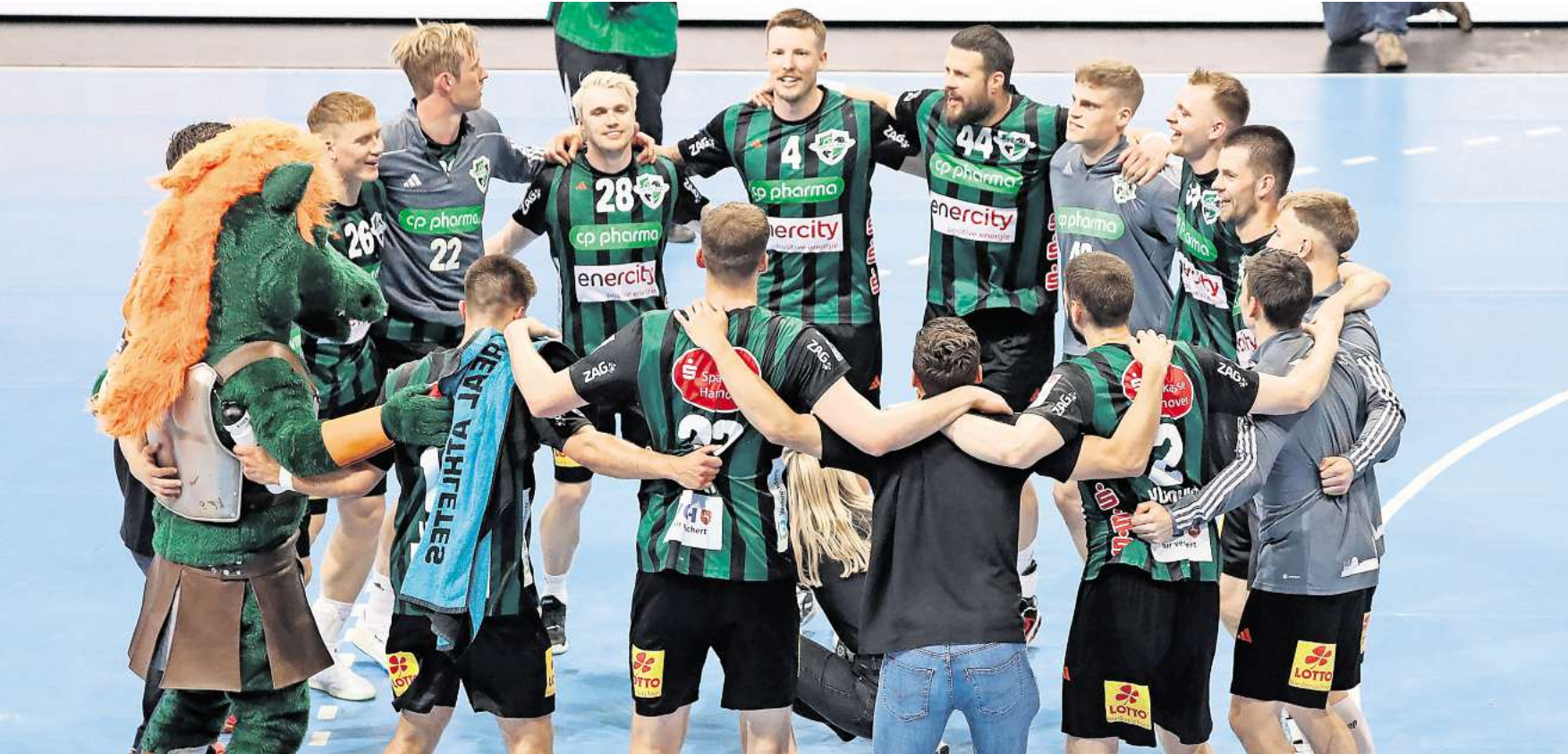
Tanzen noch einmal im Kreis: Die Recken nach dem Sieg am finalen Bundesliga-Spieltag gegen den HC Erlangen.

Saisonfazit der Handball-RECKEN: Fans und Nationalspieler in den Hauptrollen / Sie wollen zurück nach Europa