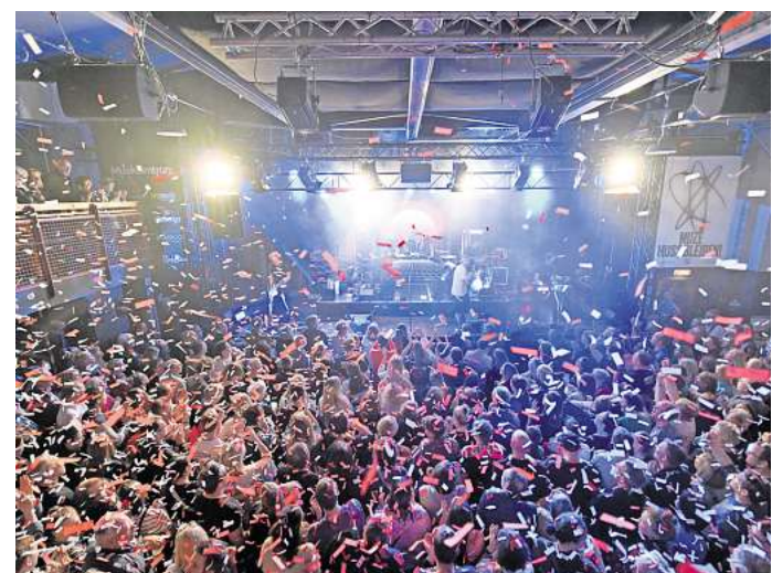
Das Musikzentrum bleibt für Konzerte bestehen.