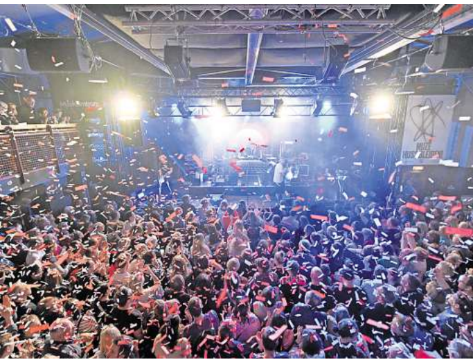
Das Musikzentrum bleibt für Konzerte bestehen.