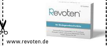
Abbildung Betroffenen nachempfunden REVOTEN. Wirkstoffe: Acidum silicicum Trit. D4, Calcium carbonicum Hahnemannii Trit. D4. Die Anwendungsgebiete entsprechen den homöopathischen Arzneimittelbildern. Dazu gehört: Bindegewebsschwäche. www.revoten.de • Zu Risiken und Nebenwirkungen lesen Sie die Packungsbeilage und fragen Sie Ihre Ärztin, Ihren Arzt oder in Ihrer Apotheke. • Remitan GmbH, 82166 Gräfelfing

Für Ihre Apotheke: Revoten Tabletten (PZN 18405588)