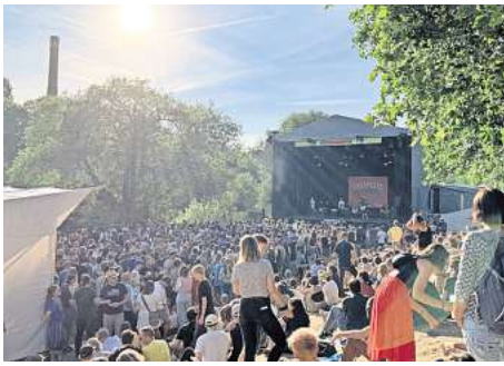
Feiern unter Sonnensonne: Die Fährmannsfestmacher hoffen in diesem Jahr auf besseres Wetter als im vergangenen Jahr, als das Programm für den Sonntag wegen Starkregens abgesagt werden musste.

Und die Gesamtkirchengemeinde Linden-Limmer beteiligt sich: mit Kirchenzelten, Silent Disco und einem Gottesdienst am Sonntag um 11 Uhr. An Stellwänden können sich Besucherinnen und Besucher vor Flügeln fotografieren lassen. Anders ausgedrückt: Das Fährmannsfest verleiht Flügel.