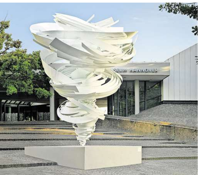
Alice Aycocks Skulptur „Another Twister“ ist der Startpunkt einer Themenführung über von Frauen geschaffene Kunst im öffentlichen Raum.

eine Anmeldung ist nicht erforderlich. Neu in diesem Jahr ist die Möglichkeit, Sonderführungen für maximal 20 Personen für Betriebsausflüge, Geburtstage oder andere Anlässe zu buchen. Die Kosten betragen 250 Euro. Anfragen zu besonderen Route oder einer besonderen Thematik können per E-Mail an info@kunst-umgehen.de angefragt werden. DIE NÄCHSTEN TERMINE ► Sonnabend, 1. Juni, 15 Uhr: „Spricht das gestern für die Zukunft? Geschichtspolitische Projekte zwischen Dialog und Provokation“, Treffpunkt: Denkmal der Göttinger Sieben, Platz der Göttinger Sieben Im Gespräch mit Martin Krenn, Künstler und Professor für Kunstvermittlung am Institut Freie Kunst der HBK Braunschweig, beleuchten Grunemann und Oppermann anlässlich des 75. Jubiläums der Inkraftsetzung des Grundgesetzes und vor dem Hintergrund sich zuspitzender politischer und gesellschaftlicher Krisen die Potentiale der Kunst und fragen, welche Rolle, Bedeutung und Wirkkraft Kunst im öffentlichen Raum im Kontext von Erinnerungskultur und Demokratiebildung hat. Dabei werfen sie einen Blick zurück auf das partizipative Kunstprojekt „enlightening the parliament“, welches Krenn mit Studierenden der HBK Braunschweig zum Jubiläum des Niedersächsischen Landtags 2022 realisierte. Nach einem Ortswechsel in die Städtische Galerie Kubus gibt der Künstler im vertiefenden Gespräch Einblicke in die eigene Kunstpraxis, in der er zu Themen wie Kapitalis-