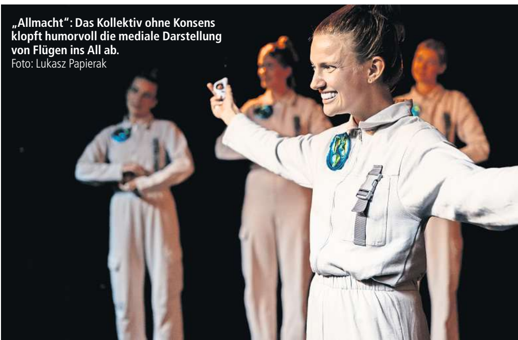
„Allmacht“: Das Kollektiv ohne Konsens klopft humorvoll die mediale Darstellung von Flügen ins All ab.

Blick auf die eigenen Körper anzu-zeigen und Körper als wertneut-ral zu inszenieren: „Fragmentez“ von rio&dio productions verbинdet Körper und Live-Videobilder zu einer mystisch-utopischen Welt ab 14 Uhr auf Bühne 1.