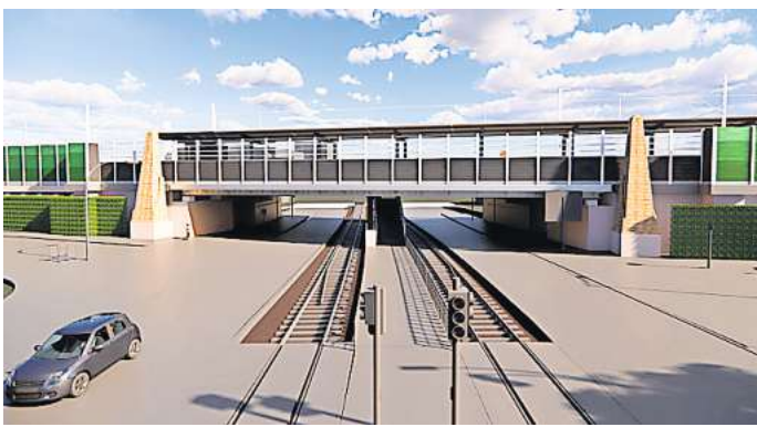
Gleiswechsel: Der Bau der S-Bahn Station Waldhausen soll im Jahr 2026 beginnen.

Pläne für einen S-Bahn-Halt am Braunschweiger Platz hat die Region schon länger, sie sind aber nach wie vor in einem frühen Stadium. Kernthema ist, ob Fahrgäste aus der S-Bahn mit einem Fahrstuhl direkt in die U-