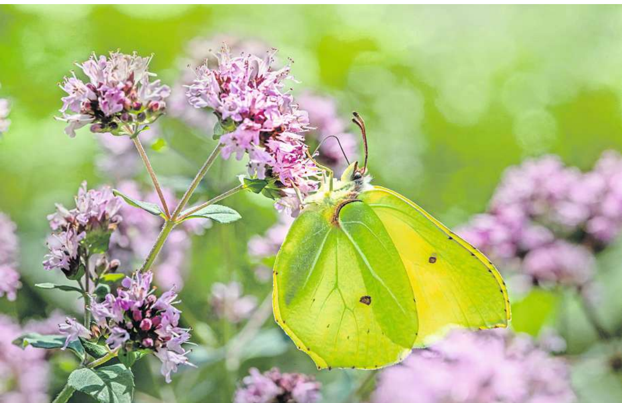
Der Zitronenfalter gehört zu den ersten Schmetterlingen im Jahr, die sich zeigen.