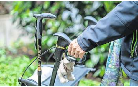
Der Anteil der Senioren über 65 Jahren nimmt in den kommenden Jahren auch in der Stadt Hannover deutlich zu. (Symbolbild)

Den stärksten Zuwachs hatten die List (plus 779), Misburg-Nord (plus 496), Bemerode (plus 490) und die Südstadt (plus 405). Stadtteile mit den höchsten Hochaltrigkeitsdichten (50 und mehr 85-Jährige je 1000 Einwohner) sind das Heideviertel (85,8), Kirchrode (57,6), Bult (56,1) und Isernhagen-Süd (50,2), jeweils bezogen auf 1000 Einwohner im Mittel der Jahre 2020 bis 2022, heißt es in dem Bericht weiter.