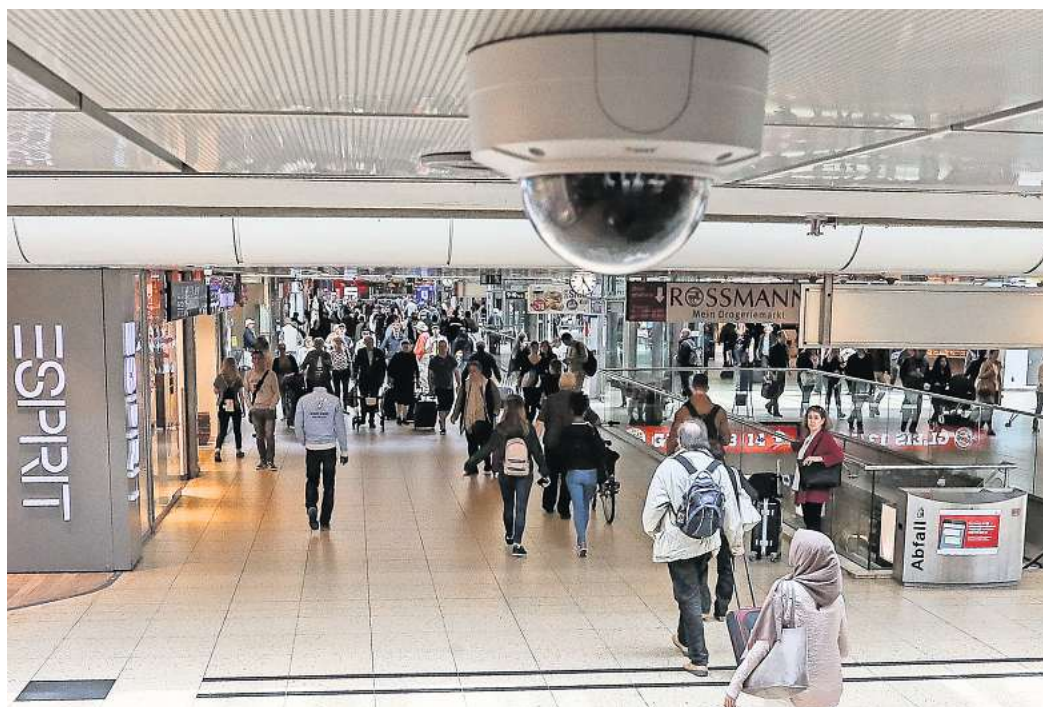
Den Bahnhof im Blick: Die Deutsche Bahn und die Bundespolizei erfassen das Geschehen im und rund um den Hauptbahnhof Hannover mit Videotechnik.

In jedem Stadtbahnwagen finden Fahrgäste neben den Türen eine Sprechstelle – erkennbar als orangefarbener Kasten –, über die sie direkt den Kontakt zum Fahrpersonal aufnehmen können, erläutert Rehberg. Während die beiden neueren Stadtbahngenerationen bereits als Serienausstattung über diese