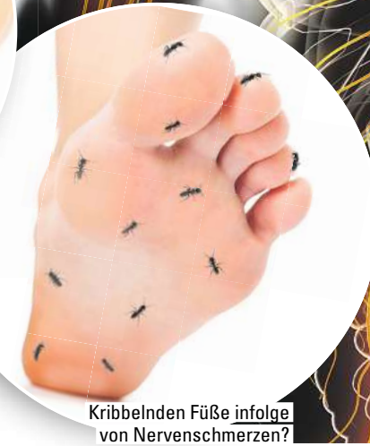
Kribbelnden Füße infolge von Nervenschmerzen?

der einzelne darin enthaltene Wirkstoff kann bei nervenbedingten Schmerzen wertvolle Hilfe leisten. So setzt beispielsweise Gelsemium sempervirens laut Arzneimittelbild im zentralen Nervensystem an, also unter anderem im Rückenmark. Der Arzneistoff Iris versicolor kommt hingegen bei ausstrahlenden Schmerzen wie einer Ischialgie und ziehenden, brennenden Schmerzen im Hüftnerv zum Einsatz.