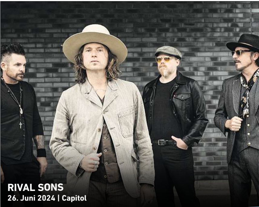
RIVAL SONS 26. Juni 2024 | Capitol

HANNOVER. Der Kinderchor der Staatsoper Hannover und das Niedersächsische Staatssorchester Hannover setzen sich bei ihrem Kinderkonzert am Sonntag, 7. April, mit musikalischen Heldenfiguren auseinander. Ein bekannter Leinwandheld eröffnet, und dann geht die heldenhafte Reise weiter von der Komponistin Ethel Smyth, die vor etwa 100 Jahren lebte, bis zu den Kindern des Monsieur Matthieu. Das Konzert beginnt um 11 Uhr im Opernhaus Hannover, Opernplatz 1. Der Eintritt kostet 19,50 Euro, ermäßigt ab 5 Euro. Ein weiteres Konzert gibt es am Montag, 8. April, ab 11 Uhr. R/HR