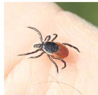
Vorsicht ist geboten: Eine Zecke läuft über eine Hand – der winzige Blutsauger kann gefährliche Krankheiten übertragen.