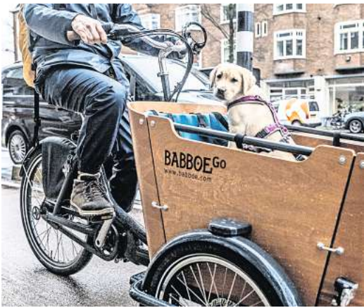
Mangelhaft: Behördliche Prüfungen haben ergeben, dass viele Modelle der niederländischen Firma Babboe nicht sicher sind, weil die Rahmen brechen könnten.