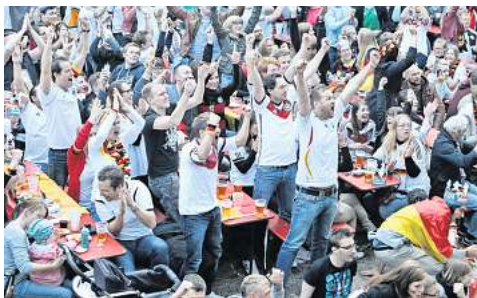
Hannover: Fußball-WM. Public Viewing beim Spiel Deutschland - USA im Biergarten Nordkurve.

Die Landeshauptstadt Hannover überlegt zurzeit noch, „in begrenztem Umfang“ auf dem Raschplatz etwas anzubieten, so Sprecher Udo Möller. Eine Fan-Arena mit vielen Tausend Besuchern wie einst auf dem Waterloo-Platz ist dort allerdings räumlich und aus Sicherheitsgründen nicht möglich.