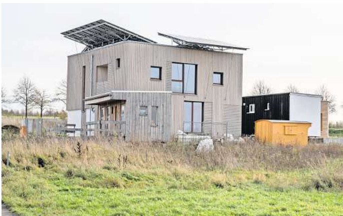
Insolvent: Das hannoversche Öko-Wohnprojekt Ecovillage auf dem Kronsberg im Stadtteil Bemerode ist am Ende.