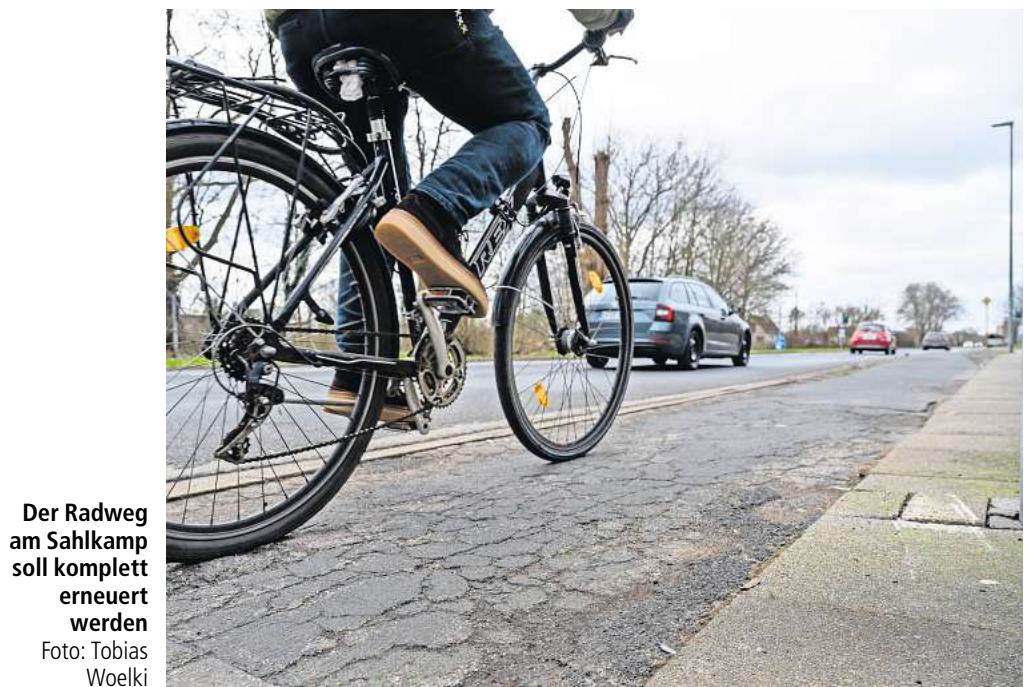
Der Radweg am Sahlkamp soll komplett erneuert werden