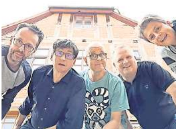
Kabarett Störfall

HANNOVER. Das Kabarett Störfall ist am 24. und 25. Februar mit dem Programm „Durch uns die Sintflut!“ im Lindener Kultladen Feinkost Lampe, Eleonorenstraße 18, zu Gast. Beginn ist jeweils um 20 Uhr. Das „Balkonkraftwerk unter den Boomer-Kabaretts“ liefert laborierte Pointen zur Erotik