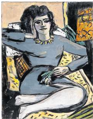
Max Beckmann, Ruhende Frau mit Nelken; Quappi auf dem Sofa bei Licht, Amsterdam, 1942, Öl auf Leinwand. Sprengel Museum Hannover, Kunstbesitz der LHH

dem künstlerischen Aufbruch am Anfang des 20. Jahrhunderts, führt dann zu einer Beruhigung und Annäherung in ihren Bildsprachen zu Beginn der 1920er Jahre und mündet in die mythologischen Bildwelten in