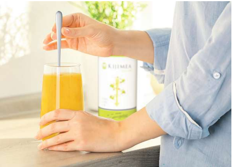
Kijimea Regularis: Einfach einrühren und genießen.

Eine träge Verdauung ist eine wahre Last. Die Beschwerden reichen von unregelmäßigem Stuhlgang bis hin zu Verstopfung. Das Problem: Bei Stress, wenig Bewegung oder auch Flüssigkeitsmangel nimmt die Darmaktivität ab und der Transport der Nahrung durch den Darm gerät ins Stocken. In der Folge stauen sich häufig Gase im Darm an und verursachen einen Blähbauch. Doch Hilfe kommt nun aus der Forschung (Kijimea Regularis, Apotheke).