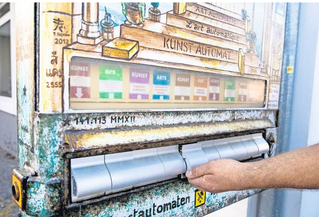
Kunstautomat in der Augustenstraße: Statt Zigaretten spuckt der umgebaute Automat Schachteln mit kleinen Kunstwerken und Hintergrundinformationen aus.

Nuggets, Bitter Ballen, Pizza-Sticks – bei „Hotboxxx“ in der Niki-de-Saint-Phalle-Promenade gibt es in Hannovers Innenstadt bereits seit zweieinhalb