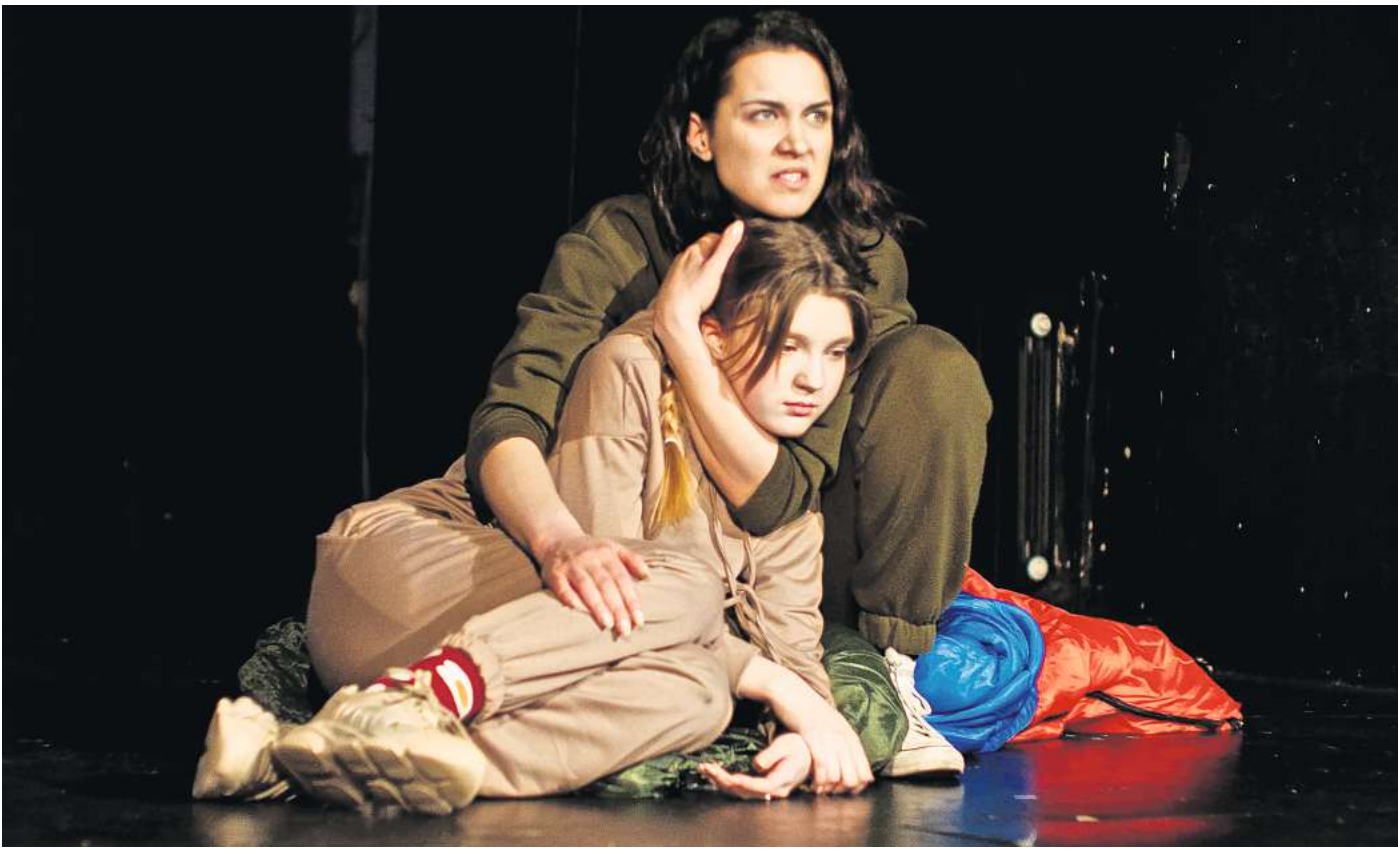
Gastspiel: Das ProEnglish Theatre mit „Once upon a Time in Ukraine“.

Zum anderen handelt es sich um ein englischsprachiges Stück, das von vier Personen aufgeführt wird, ohne Puppen und Figuren, wie