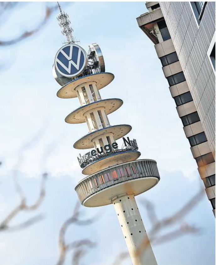
Der alte Fernsehturm Telemoritz.