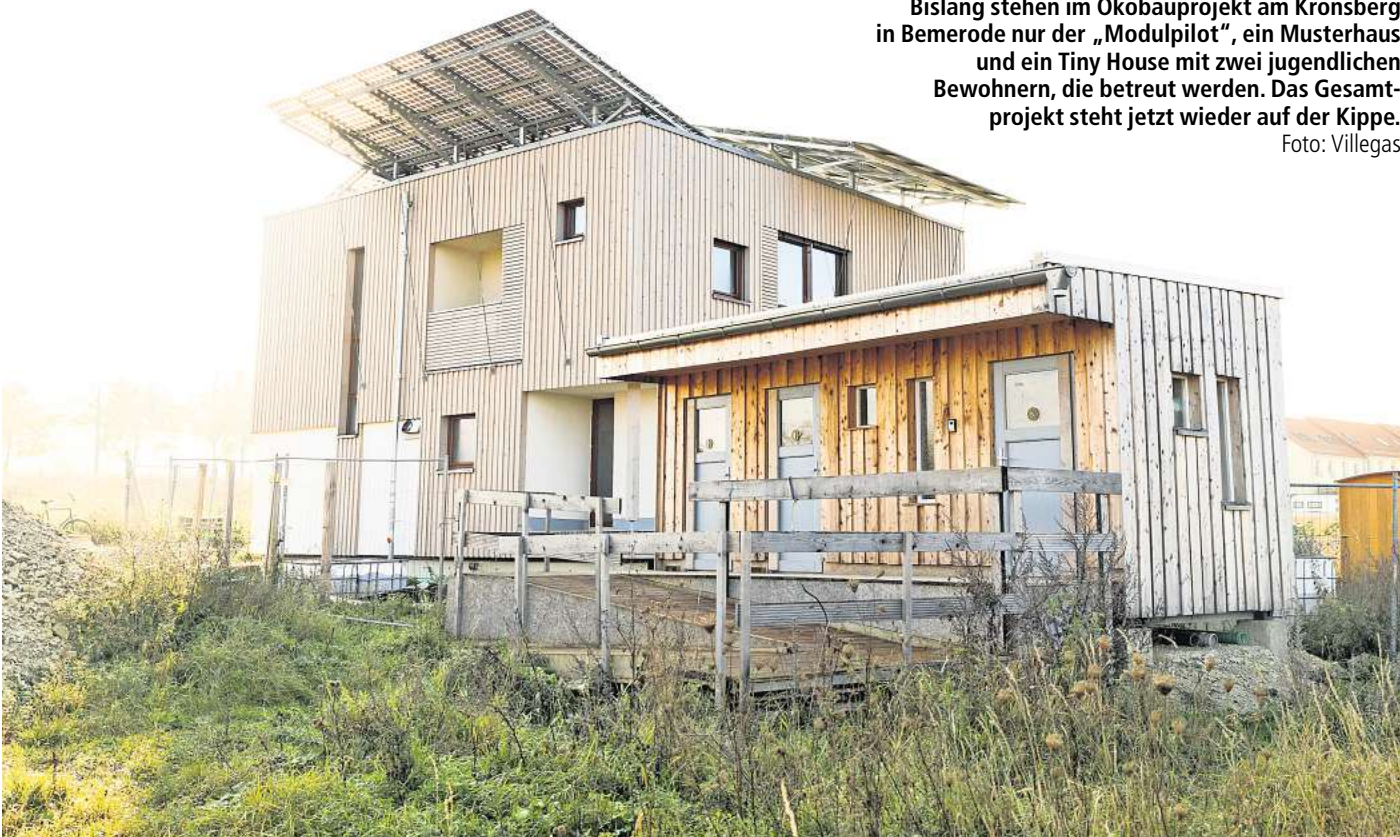
Bislang stehen im Ökobauprojekt am Kronsberg in Bemerode nur der „Modulpilot“, ein Musterhaus und ein Tiny House mit zwei jugendlichen Bewohnern, die betreut werden. Das Gesamtprojekt steht jetzt wieder auf der Kippe.