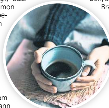
Das Glück in den kleinen Momenten des Tages finden.