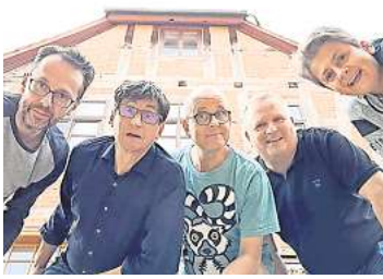
Kabarett Störfall

HANNOVER. Das Kabarett Störfall ist am 24. und 25. Februar mit dem Programm „Durch uns die Sintflut!“ im Lindener Kultladen Feinkost Lampe, Eleonorenstraße 18, zu Gast. Beginn ist jeweils um 20 Uhr. Das „Balkonkraftwerk unter den Boomer-Kabaretts“ liefert laborierte Pointen zur Erotik