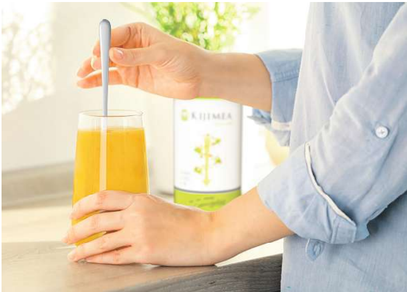
Kijimea Regularis: Einfach einrühren und genießen.

Eine träge Verdauung ist eine wahre Last. Die Beschwerden reichen von unregelmäßigem Stuhlgang bis hin zu Verstopfung. Das Problem: Bei Stress, wenig Bewegung oder auch Flüssigkeitsmangel nimmt die Darmaktivität ab und der Transport der Nahrung durch den Darm gerät ins Stocken. In der Folge stauen sich häufig Gase im Darm an und verursachen einen Blähbauch. Doch Hilfe kommt nun aus der Forschung (Kijimea Regularis, Apotheke).