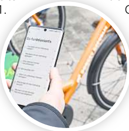
Die Leihfahrräder von Donkey Republic können in der App des Anbieters gemietet werden.

Mit einem GVH-Abonnement sind die ersten 30 Minuten einer Fahrt kostenfrei. Das gilt auch für Studierende mit einem GVH-Semesterticket. Neu ist, dass alle, die ein Deutschlandticket bei der GVH gekauft haben, ebenfalls diesen Vorteil nutzen können. Per E-Mail schickt die GVH den betroffenen Personen einen Code, mit dem man in der Donkey Republic