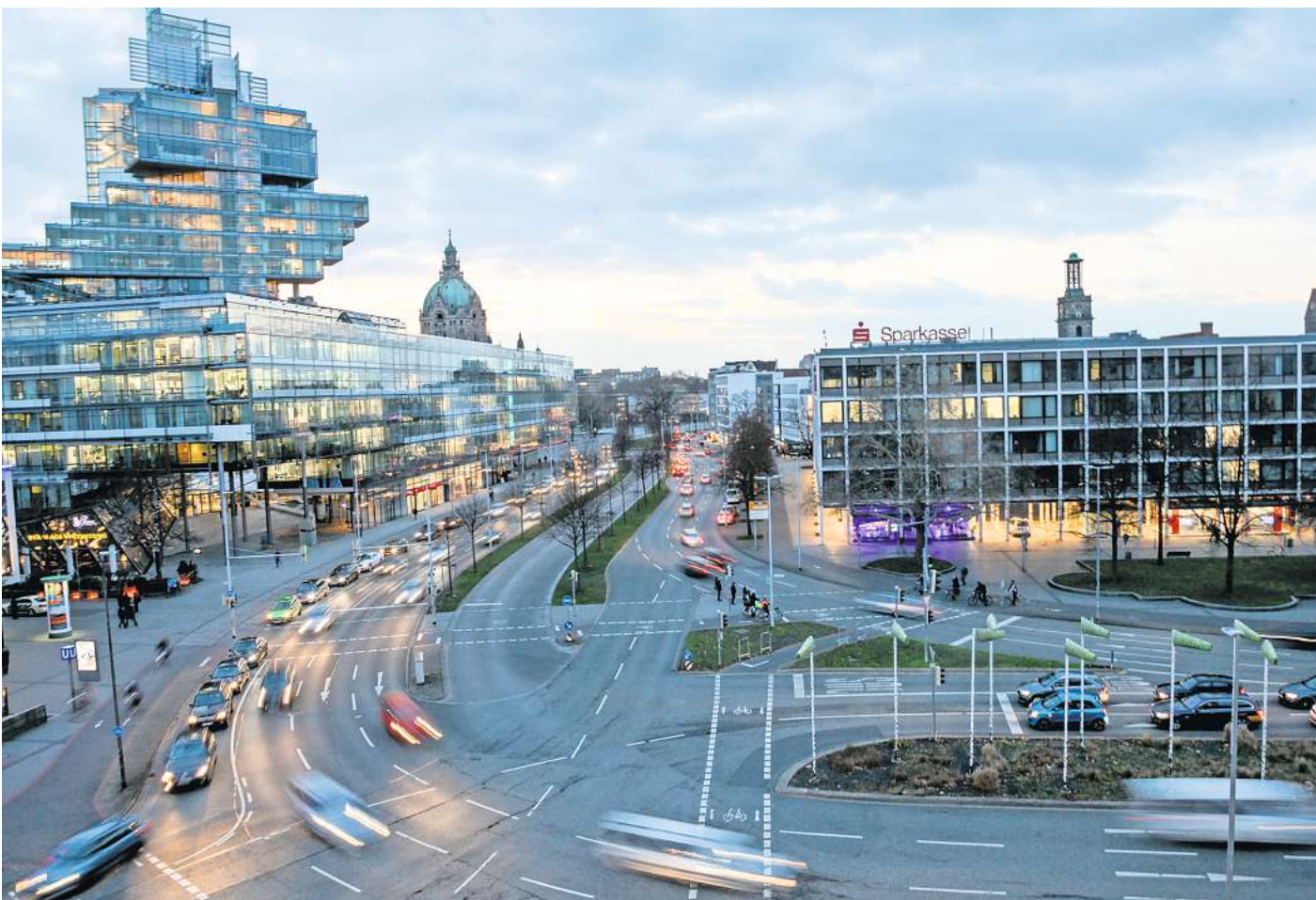
Ziel Verkehrswende: Stadt und Region wollen, dass weniger Autos unterwegs sind.

Ist das also schon die Trendwende beim Verkehr, die sich so-