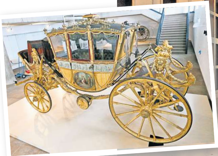
Kutsche Georg des 4.: Dieses und andere königliche Gefährte sollen künftig im Schlossmuseum Herrenhausen zu sehen sein.

die Kutschen zu den beliebtesten Ausstellungsstücken zählen, sei die Idee entstanden, die Gefährte in Herrenhausen zu zeigen.