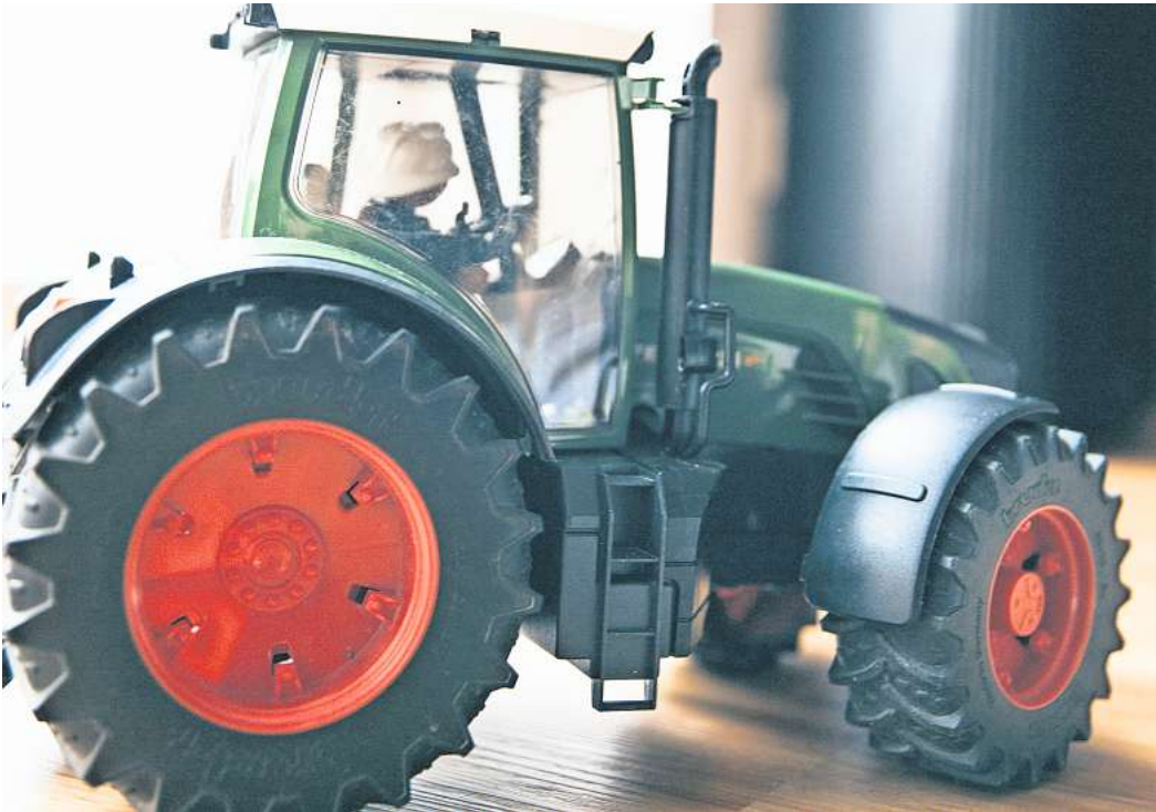
Traktor als Kinderspielzeug.

Idyll schon immer eine Illusion war, ist vielleicht sogar ein Teil unserer aktuellen Probleme: Beim Blick auf die Landwirtschaft sind wir es gewohnt, die Realität zumindest teilweise auszublenden. Das Wissen um die Notwendigkeit einer Transformation in diesem Bereich ist zwar seit Langem da, aber noch immer kaum allgemein verbreitet. Das ist grotesk angesichts der kaum zu überschätzenden Bedeutung des Themas für Klima, biologische Diversität und gesellschaftlichen Zusammenhalt. Es ist offensichtlich, dass die Art und Weise, wie wir das Land bestellen und Tiere halten, nicht einfach immer weiter fortgeschrieben werden kann. Und doch wollen viele es nicht sehen. Anders lässt sich jedenfalls kaum erklären, warum ausgerechnet die Vertreterinnen und Vertreter jener Partei den Volkszorn auf sich ziehen, die sich noch am ehesten anschickt, den Wandel in der Landwirtschaft politisch zu befördern. Die Bauernhofbücher erzählen nichts von diesen Dingen. Doch sie schaffen früh eine Verbindung zu einem wichtigen Bereich unseres Lebens, die bei den meisten im Lauf der Zeit immer schwächer wird. Mag sein, dass dieser Prozess beschleunigt wird, wenn die Trecker jetzt im wütenden Protest ihre Unschuld verlieren. Doch es ist eine schöne Vorstellung, dass die Verbindung zur Landwirtschaft trotzdem nie ganz abreißt. Ihr Umbau geht uns schließlich alle an.