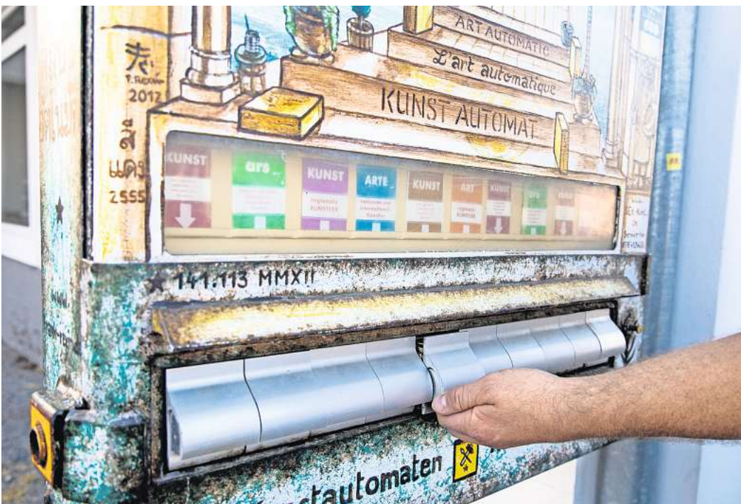
Kunstautomat in der Augustenstraße: Statt Zigaretten spuckt der umgebaute Automat Schachteln mit kleinen Kunstwerken und Hintergrundinformationen aus.

Jahren Fast Food aus dem Automaten. In den Niederlanden sind solche automatischen Imbisse schon länger bekannt, in Hannover gab es so etwas bisher noch nicht. Die Macher planen einen zweiten Standort auf der Limmerstraße in Hannover-Linden. Was „Hotboxxx“ neben den Automaten besonders macht, sind die Menschen, die diese befüllen. Die Angestellten leben mehrheitlich mit Beeinträchtigungen – sind blind, hörgeschädigt oder gehbehindert.