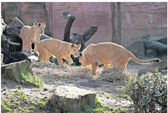
Aktiv in der Anlage: Die Löwenjungtiere entdecken die Tierbeschäftigung aus Antilopenstroh.

Boden gedrückt vorwärts robbten und zunächst jedes Grasbüschel und gerne auch die Mutter ansprangen. Am mutigsten und kletterfreudigsten zeigte sich dabei das kleinste Jungtier: „Die Zierliche, Zuri, war immer schon die lebhafteste“, so der Tierpfleger.