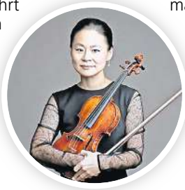
Violinvirtuosin Midori tritt bei Konzerten im NDR-Funkhaus auf.