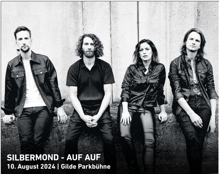
SILBERMOND - AUF AUF 10. August 2024 | Gilde Parkbühne

HANNOVER. Drei Punk-Bands spielen beim „Rebell Fest“ am Sonnabend, 6. Januar im Béi Chéz Heinz, Liepmannstraße 7b. Die Konzerte beginnen ab 19 Uhr, Einlass ist ab 18.30 Uhr. Der Band Drei Meter Feldweg gelingt es, in ihren Songs sowohl feucht-fröhliche Partystimmung zu verbreiten, als auch einen ernsteren Ton anzuschlagen und sich Themen wie dem immer stärker werdenden Rechtsruck in Deutschland, einer aufkommenden Zwei-Klassen-Gesellschaft und gewöhnlichen Alltagsorgen zu widmen. Graupause bringen melodischen und abwechslungsreichen Punkrock mit ordentlichem Druck und Tempo mit, die Texte sind politisch und gesellschaftskritisch. Die Band Abfluss spielt deutsche Punkrock, der mit eingehenden Refrains gepaart ist, die zum Mitgröhlen einladen. Tickets gibt es online ab 17 Euro plus Gebühren, alle Ticketeinnahmen gehen an das Bündnis „Kein Bock auf Nazis“