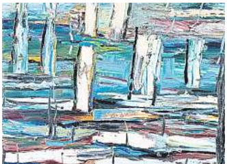
Giso Westing, o.T., 2021, Öl auf Leinwand

Die Galerie Kubus, Theodor-Lessing-Platz 2, ist geöffnet von Dienstag bis Sonntag bei freiem Eintritt. Immer sonntags bietet der „SonnTALK“ von 14 bis 15 Uhr einen Raum zum Sprechen und Nachdenken über Kunst.