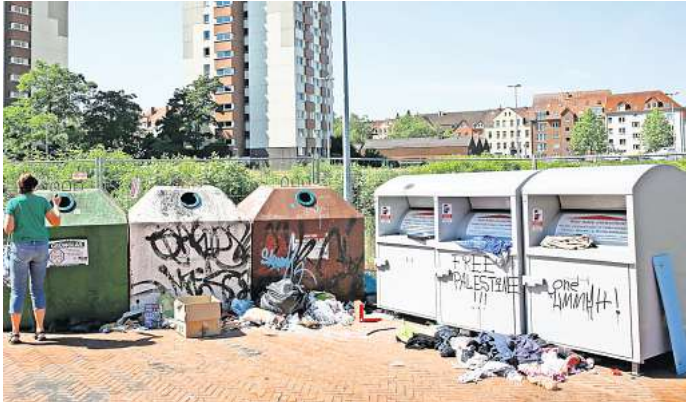
Die Wertstoffinsel Voltmerstraße/Hainholzer Markt wird als Problemfall eingestuft.