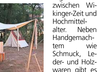
Lagerleben: Es geht auf eine bunte Zeitreise.

Force“ mit Tanzdarbietungen und Märchenereignissen. Geschichte zum Anfassen bietet das Lagerleben zwischen Wikinger-Zeit und Hochmittelalter. Neben Handgemachtem wie Schmuck, Leder- und Holzwaren gibt es ein Badehaus und Aktionen zum Mitmachen, unter anderem Bogen- und Armbrustschießen, Henna-Malerei und Schwertbasteln. Ein Höhepunkt ist die Waffen- und Feuershow. Zwischen Met-Taverne und Mandelei ist für eine passende Stärkung zwischendurch gesorgt.