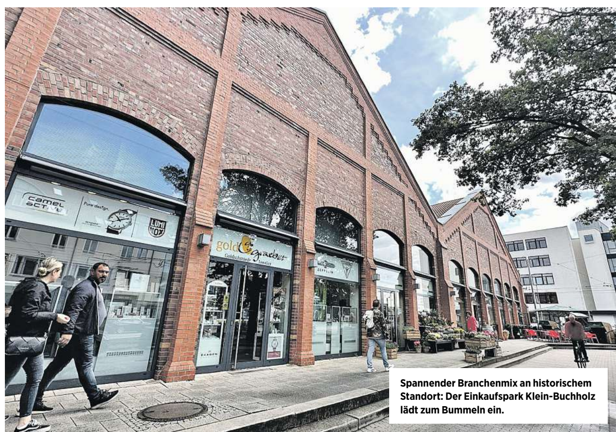
Spannender Branchenmix an historischem Standort: Der Einkaufspark Klein-Buchholz lädt zum Bummeln ein.

■ Highlight des Festtages ist jedoch das Gewinnspiel. Wer seine Teilnahmekarte mit Namen und Adresse in die Trommel wirft, kann sich mit ein bisschen Glück über einen Reisegutschein im Wert von 5000 Euro vom ITA Reisecenter freuen.