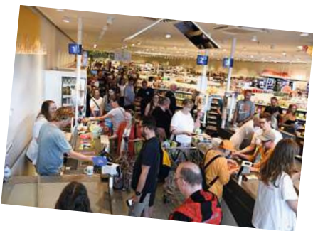
Ganz schön viel los bei dm – rund 500 Fans kamen zur Kassieraktion.

Bevor der Scheck im Wert von 8.000 Euro überreicht wurde, spielte die Band unplugged einen ihrer bekanntesten Songs als Dankeschön für das tolle Event und die Unterstützung des guten Zwecks. Nach diesem furiosen Auftritt bei dm rockte die Band am Abend die ausverkaufte Parkbühne in Hannover.