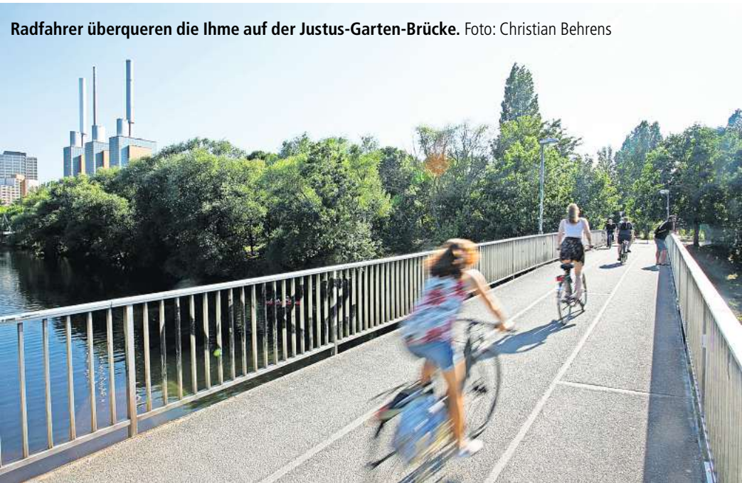
Radfahrer überqueren die Ihme auf der Justus-Garten-Brücke.

Auf dem Weg zur Arbeit gewinnt das Fahrrad mehr an Bedeutung