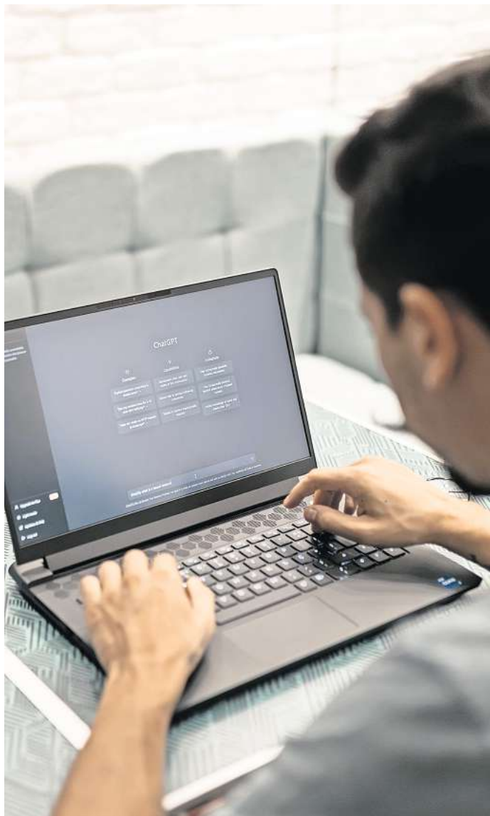
ChatGPT gehört zu den am schnellsten wachsenden Internetanwendungen aller Zeiten.

Dort werde erheblich mehr privates und staatliches Geld investiert. Hiesige Unternehmen bräuchten deshalb mehr Kapital, 3 Milliarden Euro habe die Bundesregierung bereits investiert. „Wir müssen aber auch die privaten Investitionen deutlich steigern, um vertrauenswürdige