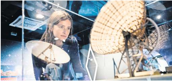
Weltraumforschung erleben: In der Ausstellung gibt es zahlreiche interaktive Exponate.

HANNOVER. Das Musiktheater Konrad präsentiert in Kooperation mit der IGS Linden das Musical „Kommissar Shakespeare“, am Sonnabend, 1. Juli, ab 15 Uhr im Kleckstheater, Kestnerstraße 18. Erzählt wird die skurrile und tragisch-komische Geschichte der 14-jährigen Su, die auf ärztlichen Rat hin ihrer Leidenschaft für die Schauspielerei folgen soll. Also bildet ihr Vater, ein strenger Kommissar, spontan eine Theatertruppe aus der Besetzung seiner Polizeiwache. Doch diese versagt dramatisch, so dass die Gefangenen ramrüssen. Kartenreservierung unter mail@musiktheaterkonrad.de., R/HRD