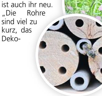
Ökologisch wertvoll: einheimische Pflanzen und ein Insektenhotel für Wildbienen.

ten langen Bambusrohren, in denen die Wildbienen ihre Eier legen können. „Alle, die vorn verschlossen sind, sind belegt“, erklärt sie. Außerdem ist ein Gitter davor, „sonst wäre das ein reines Vogelbüfett hier“, sagt Olze. Dass in diesem Moment eine Wildbiene ins schlechte Hotel aus dem Baumarkt fliegt, um möglicherweise den Nachwuchs hier abzulegen – Platz ist immerhin in der kleinsten Hütte, ist auch ihr neu. „Die Rohre sind viel zu kurz, das Deko-