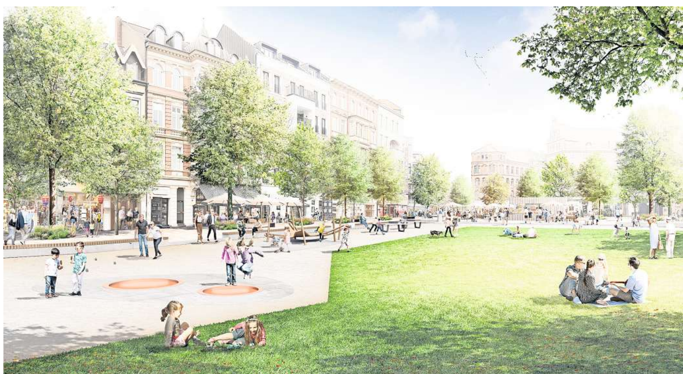
Platz für alle: Der Weißkreuzplatz soll in mehrere Zonen aufgeteilt werden - mit Spielangeboten für Kinder und Erwachsene.

Dass die Stadt auf dem Platz entlang der Lister Meile endlich tätig wird, hat vor allem mit ihrem Programm zu tun, die sogenannten bahnhofsnahe Plätze aufzuwerten. Auf dem Raschplatz, zuvor ein Versammlungsort für Süchtige und Dealer, finden seit Mitte Mai diverse Sport- und Musikveranstaltungen statt. Ein Basketballfeld und ein Fußballplatz stehen allen Freizeitsportlern zur Verfügung – und werden sehr gut angenommen. Auch den Andreas-Hermes-Platz will die Stadt mit diversen Kulturveranstaltungen beleben, doch die Resonanz hält