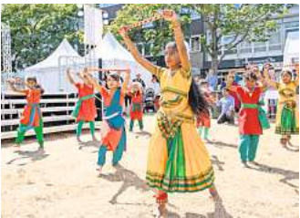
Auf und an der Tanzbühne begegnen sich Kulturen.

Am Sonntag trifft Boko Boko auf J. Lamotta. Die aus Tel Aviv stammende Künstlerin ist ein echtes Multitalent und mixt Hip-Hop, Jazz, Soul und selbst produzierte Beats zu einem einzigartigen Klangerebnis, das sie mit ausdrucksstarker Stimme und sehr direkten Texten von den Ohren direkt ins Herz transportiert. Die Tanzdem Weltmarkt zu sehen: So konnte Musikbooker Sören Nyhuis nochmals den jamaikanischen Reggae-Musiker Colah Colah gewinnen. Wie bereits 2019