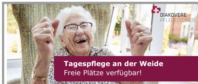
Tagespflege an der Weide Freie Plätze verfügbar!

Neue Bänke, neue Bäume: Im Süden des Platzes will die Stadt zusätzliche Bänke und drei Schachtische mit Sitzhockern aufstellen. Für die Mauer gleich daneben plant die Stadt „Sitzauflagen“. Neue Bäume will die Stadt ebenfalls pflanzen und auch die Rasenfläche erneuern.