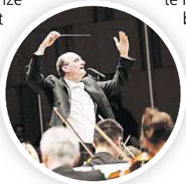
Chefdirigent Andrew Manze verabschiedet sich.

Nähere Informationen und Tickets: ndr.de/radiophilharmonie