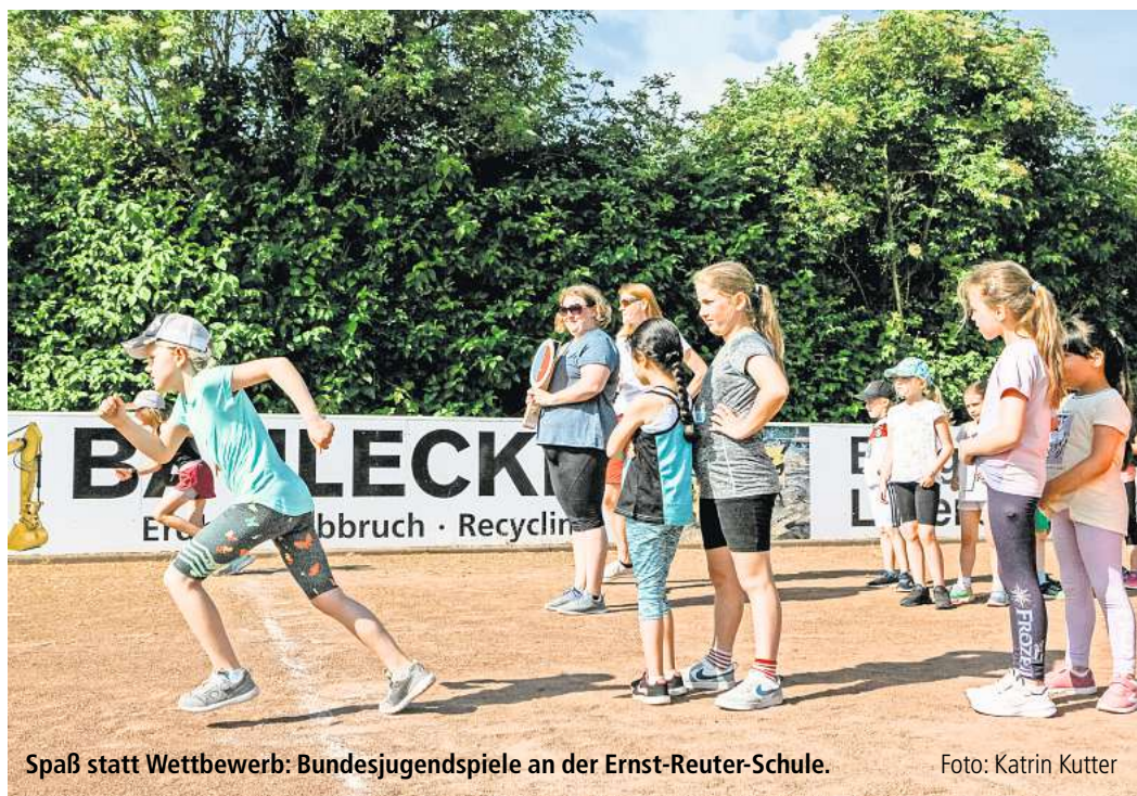
Spaß statt Wettbewerb: Bundesjugendspiele an der Ernst-Reuter-Schule.

Ist der WETTKAMPF AN SCHULEN motivierend oder frustrierend? Manche behelfen sich mit einem Sportfest, bei dem der Spaß zählt