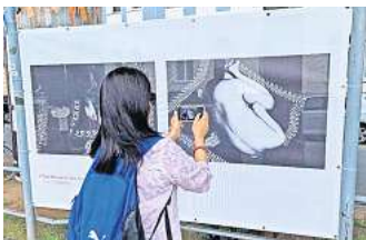
Multimediale Freiluft-Ausstellung über Lebenswege, die sich in Hannover kreuzen.