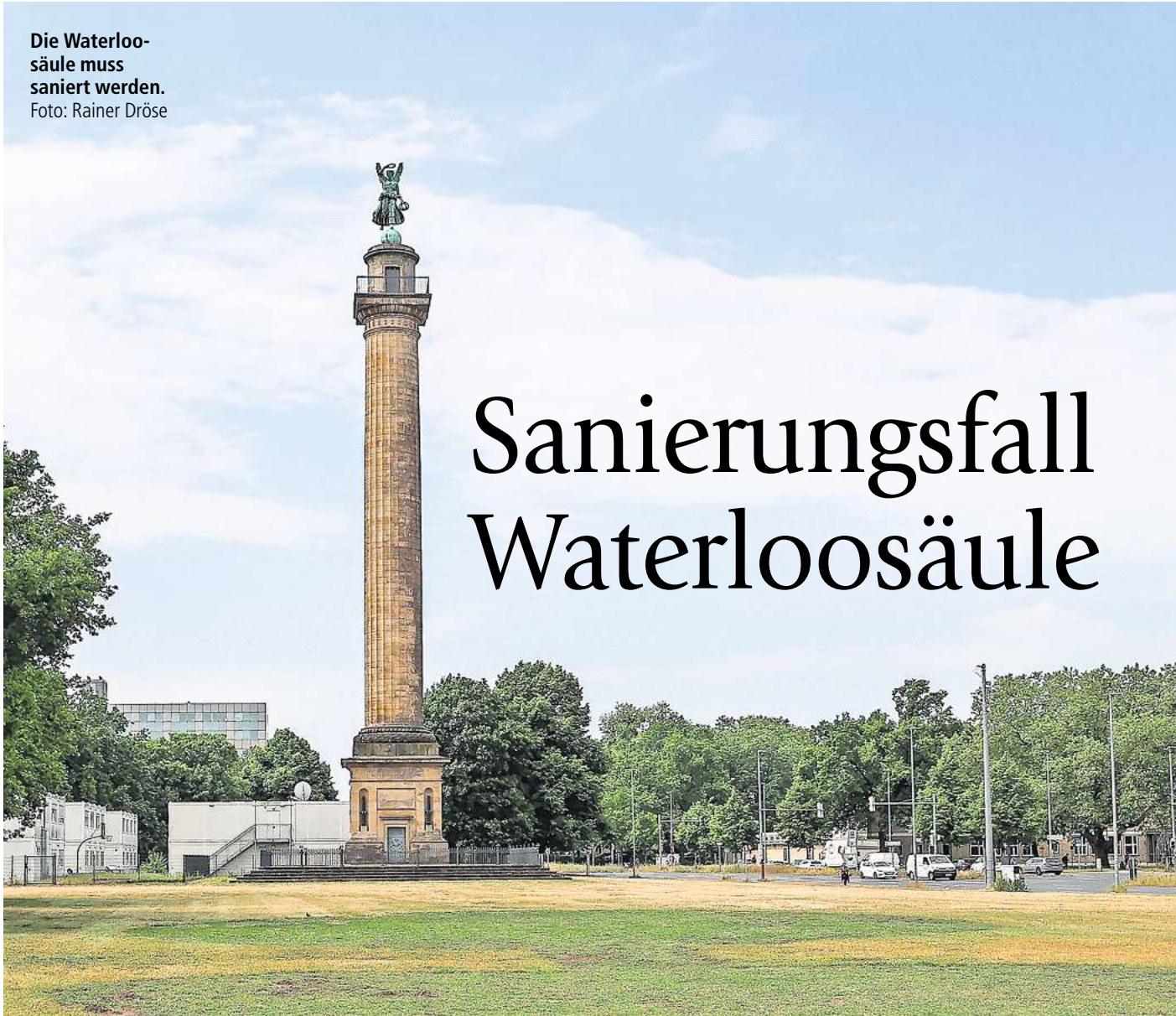
Die Waterloo-säule muss saniert werden.

Chemische Behandlung von 1985 setzt Sandsteinen zu / Stadt schätzt die anfallenden Kosten auf 1,25 MILLIONEN EURO