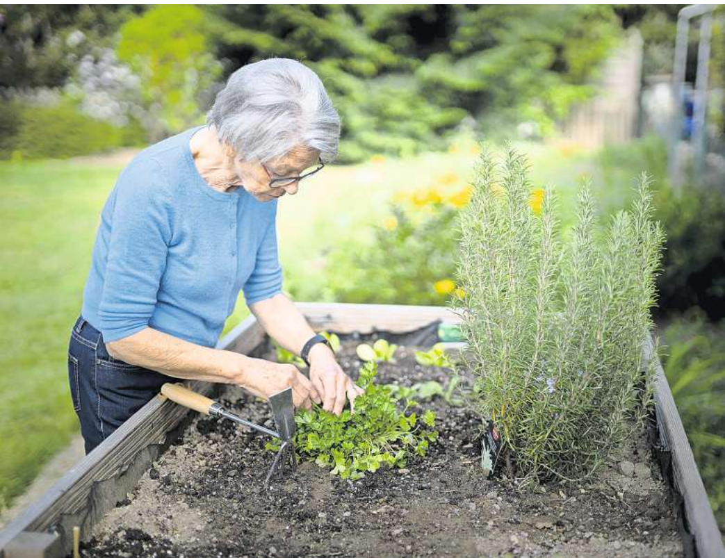
An Hochbeeten lässt es sich rückschonend gärtnern. Zudem hat man die Pflanzen und Kräuter besser im Blick.