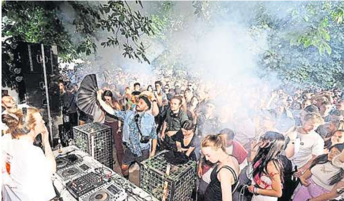
Tanzen unterm Sommerhimmel mit Live-DJs.

Das komplette Programm auf den hannoverschen Bühnen der diesjährigen Fête des la Musique ist online unter fete-hannover.de zu finden.