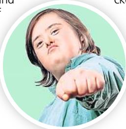
Inklusiv: Theaterfestival Klatschmohn.

ermäßigt 4 Euro. Kartenvorverkauf unter Telefon (0511) 2355550 oder E-Mail an tickets@pavillon-hannover.de .