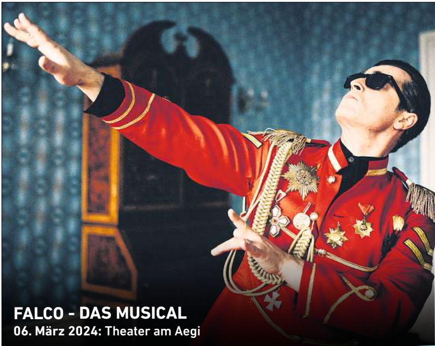
FALCO - DAS MUSICAL 06. März 2024: Theater am Aegi