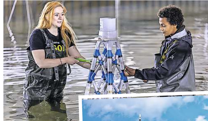
Auf der Suche nach der optimalen Verpackung: Studentinnen der Hochschule Hannover im Labor.

Angehende Bauingenieurinnen bei der Arbeit: Zwei Studentinnen bauen das Modell einer Gründungsstruktur für eine Offshore-Windenergieanlage im 3D-Wellenbecken auf.