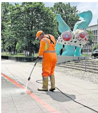
Frische Farbe für den Roten Faden.

bin froh, dass der Rote Faden wieder sichtbar und pünktlich zur Sommersaison fertig geworden ist.“ Begleitend zur Auffrischung hat die HMTG eine neue Broschüre zum Roten Faden mit allen Informationen zu den Sehenswürdigkeiten aufgelegt, sie liegt in der Tourist-Info am Ernst-August-Platz aus.