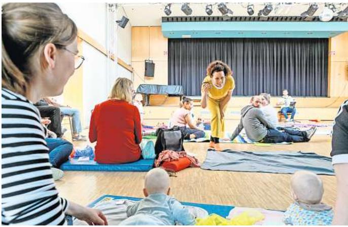
„Singen von Anfang an“: Die Veranstaltungsreihe will schon den Jüngsten Zugänge zur Musik vermitteln.