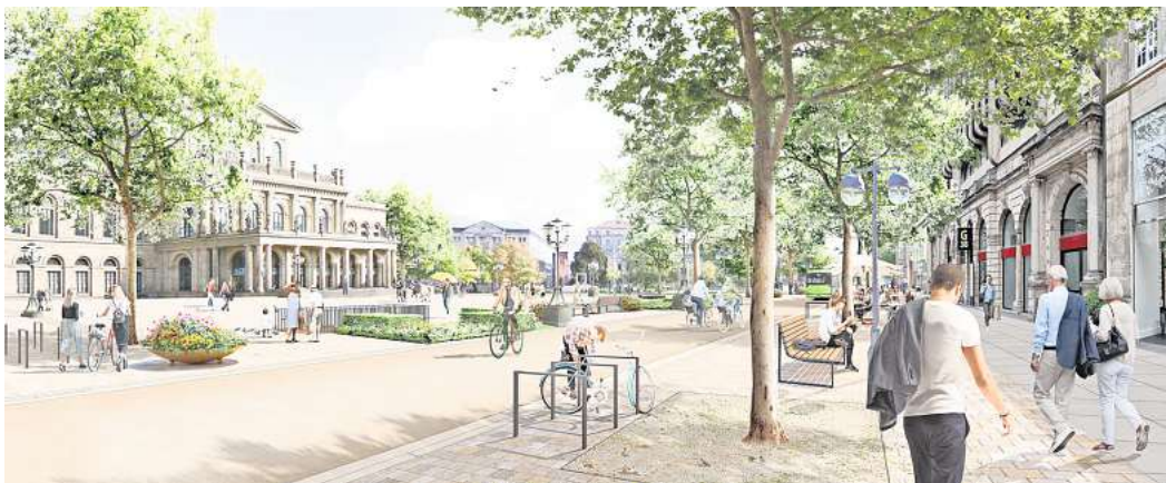
Alles auf einer Ebene: Gehweg, Fahrbahn und Opernplatz sollen auf einem Niveau liegen. Visualisierung: Stadt Hannover

Das im Herbst 2022 beschlossene Innenstadtkonzept gebe ohnehin schon „eine sehr klare Orientierung“ bei den Planungen des Verkehrskonzeptes für Hannovers City.