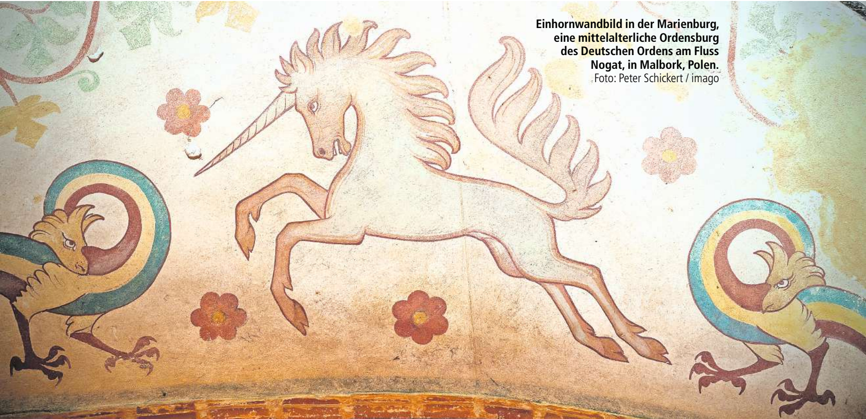
Einhornwandbild in der Marienburg, eine mittelalterliche Ordensburg des Deutschen Ordens am Fluss Nogat, in Malbork, Polen.