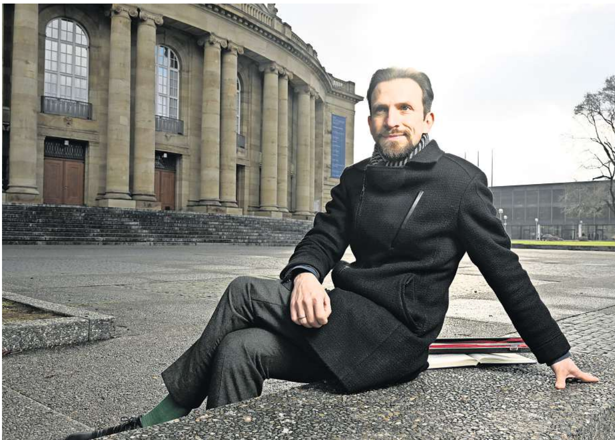
Am Pult der NDR Radiophilharmonie wird mit Cornelius Meister ein erfahrener Opernspezialist stehen.

Beide Vorstellungen am Freitag, 14., und Sonnabend, 15. Ju-