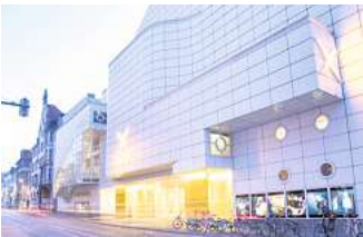
„Open Haus“: Das Schauspiel Hannover lädt ins Foyer ein.

Mehr Infos: schauspielhannover.de/openhaus sowie hannover.de , Suchbegriff „Kulturdreieck“