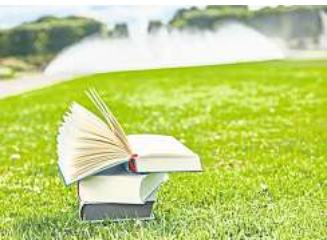
Lesepicknick in den Herrenhäu- ser Gärten.