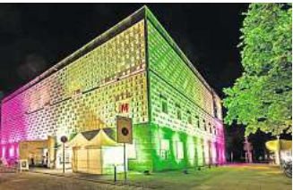
Im stimmungsvoll illuminierten Museum August Kestner gibt es Führungen, Konzerten und eine Schatzsuche für Kinder.