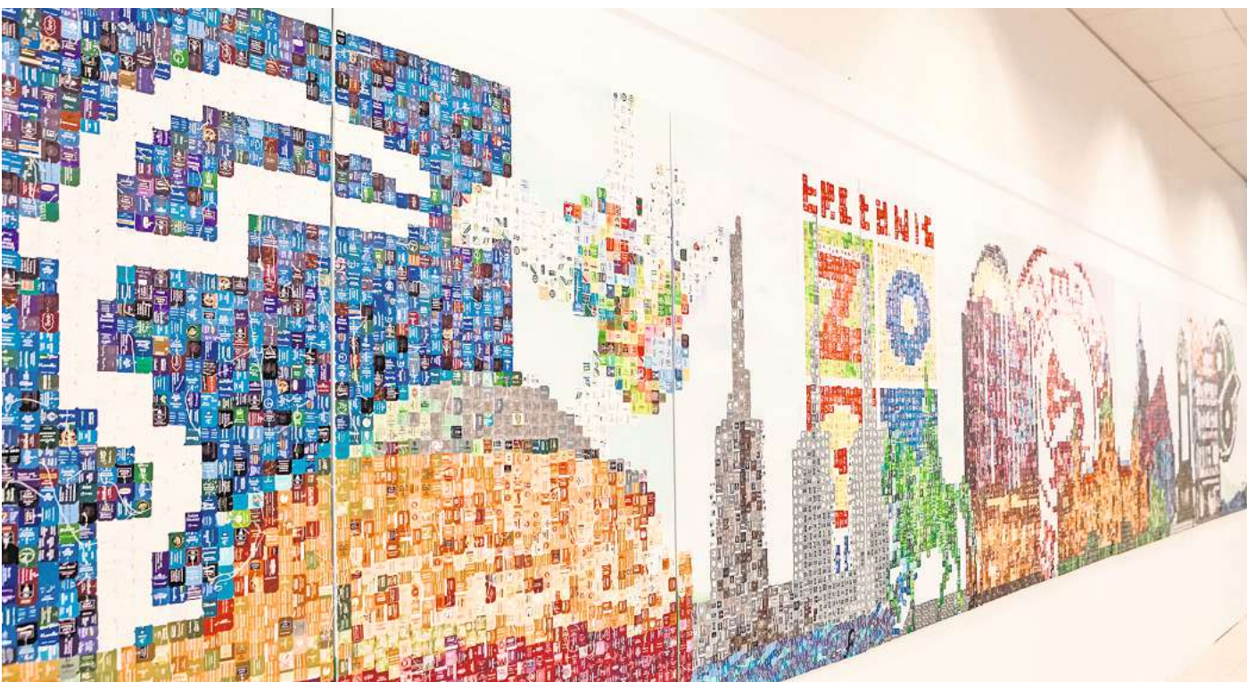
Im ehemaligen Kaufhof Schmiedestraße eröffnet das Projekt aufhof.

Stadtentwicklung: Außer dem großen Stadtmodell gibt es Areale, in denen über den Innentadt-dialog, die Mobilitätswende, die Digitalstrategie Smart-