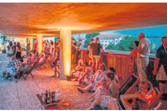
In der Sky Lounge des Histori- schen Museums lässt sich der Blick über die Altstadt genießen.

Im Landesmuseum treffen ra- sante Taiko-Trommelrhythmen auf Lagerfeuerstimmung im In- nenhof, und es sind drei sehr unterschiedliche Ausstellungen zu sehen. Von einer Reise „Nach Italien“ geht es „Tempo. Tempo! Tempo?“ durch die Geschichte der Geschwindigkeit, und Glenn Brown verknüpft mit „The Real Thing“ alte und neue Kunstwer- ke sowie das Landesmuseum mit dem Sprengel Museum.