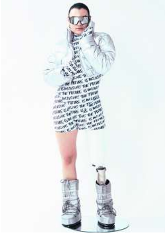
„The Future is inclusive“: Die Kollektion „Spotlight“.