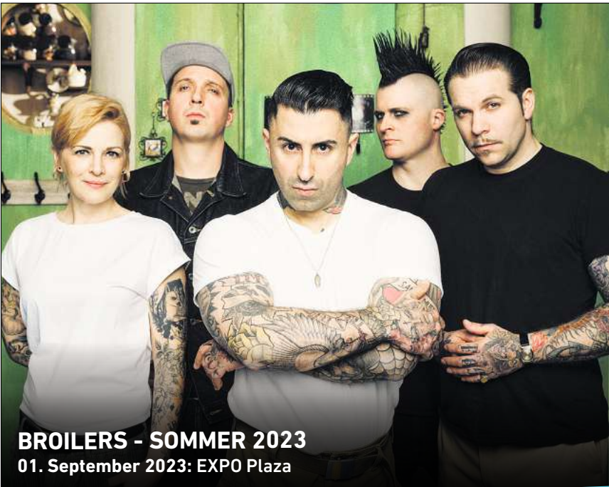
BROILERS - SOMMER 2023 01. September 2023: EXPO Plaza

Ihr persönlicher Ticketservice der HAZ & NP