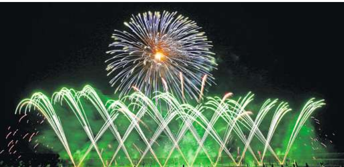
Nach der Eröffnung des Feuerwerkswettbewerbs durch Beisel Py- rotechnik für Deutschland geht nun das Team Brezac Artiffices für Frankreich an den Start.