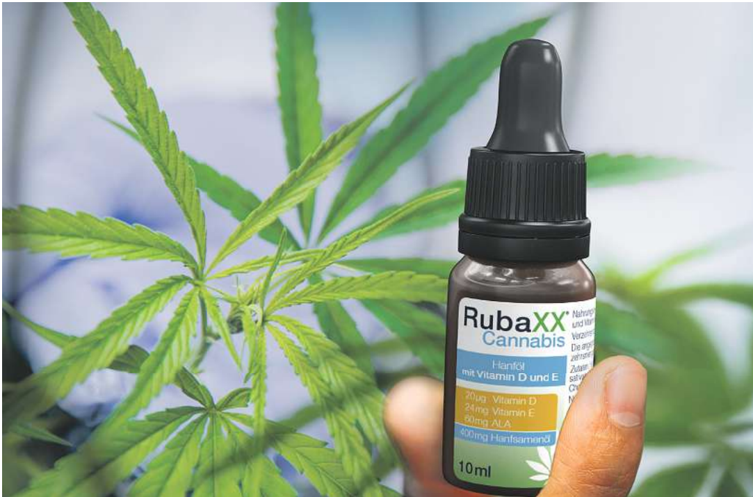
(Abbildung Betroffenen nachempfunden)

Die Kraft aus der Natur entdecken – darauf vertrauen mittlerweile immer mehr Menschen. So erfreut sich auch die Cannabispflanze großer Beliebtheit! Von der Qualitätsmarke Rubaxx gibt es ein wertvolles Cannabis Öl, das aus den Samen einer besonderen Cannabispflanze hergestellt wird (Apotheke, frei verkäuflich).