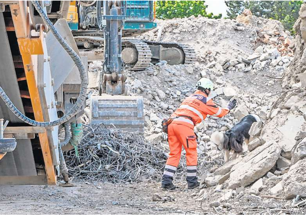
Zwischen Trümmern und Staub: Die Rettungshundestaffel der Johanniter bei der Prüfung auf schwierigem Gelände.

Johanniter in Hannover richten wichtige Prüfung für RETTUNGSHUNDE-STAFFELN aus