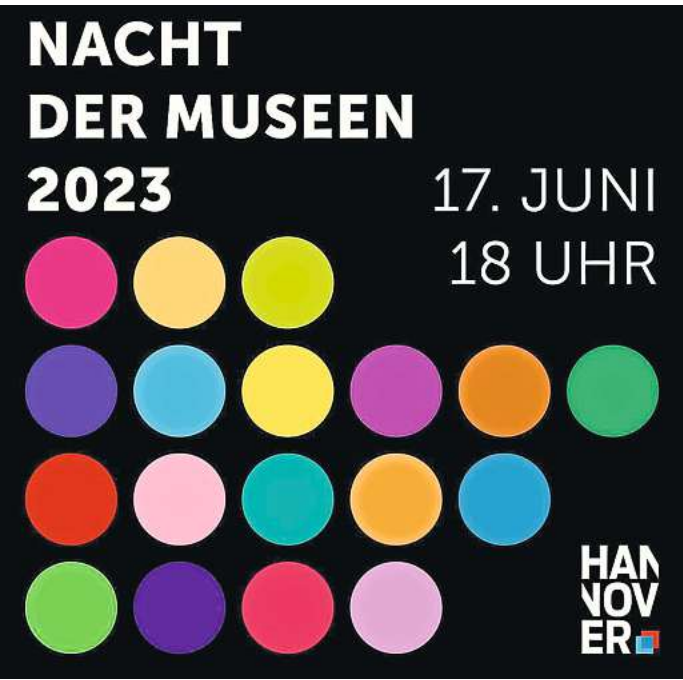
Die Nacht der Museen findet zum 25. Mal statt.

Der herrliche Garten der Villa Seligmann lädt zu Getränken und Austausch ein, auf dem Pro- gramm stehen zahlreiche Füh- rungen und jüdische Orgelmusik. Live-Musik auf der Gitarre und Kulinarisches gibt es bei fein- kunst e.V. , zudem finden stünd- lich Führungen und Gespräche mit dem Künstler Matten Vogel statt. Bei den Ausstellungen in der Architektenkammer Nieder- sachsen / Lavesstiftung geht es um (Um)Bauen auf dem Weg zur Klimaneutralität und architekto- nische Eingriffe in magische Orte.