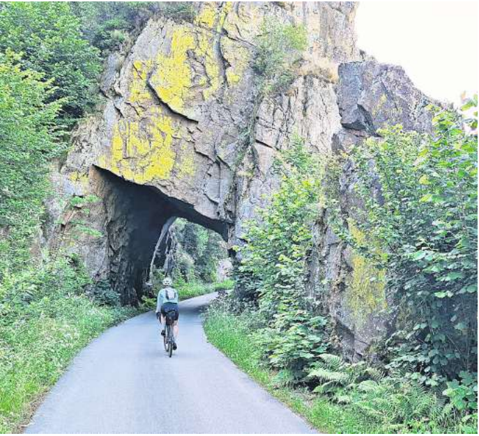
Spektakuläre Landschaft im Schwarzwald.

Die Idee, Radferien zu machen, hatte einen ganz banalen Ur- sprung. „Ich wollte im Urlaub nicht auf mein Fahrrad verzich- ten“, erzählt sie. Tagesausflüge hatte sie schon vorher gemacht. Sie schätzt, dass sie etwa 8000 Ki- lometer im Jahr auf ihren Rädern – es sind vier Stück – zurücklegt – eine anstrengende Art zu reisen. Aber morgens durch einen „spek- takulären Felstunnel im Schwarz- wald“ zu fahren, sei dabei eine der vielen Belohnungen.