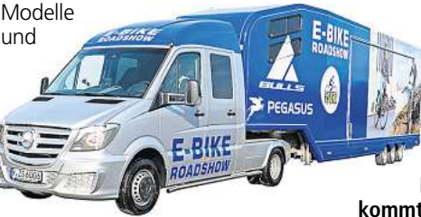
Der ZEG-Showtruck kommt zu Stadler.

und Kompakträder, Lastenräder, Fahrräder für Urban und Lifestyle - vom Einsteiger-Mountainbike bis zum Carbon-Renner für den Profisport. Dazu gibt es Infos über die neuesten Modelle und