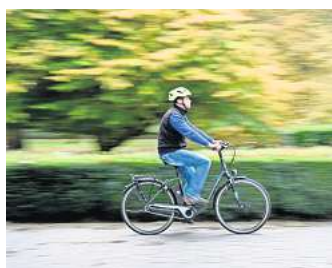
Eine Studie der MHH zeigt: Pedelec-Fahren hat trotz elektrischer Unterstützung positive Effekte auf den Körper.

alltägliche körperliche Aktivität. „Viele Pedelec-Nutzer waren vorher nicht unbedingt Radfahrer. Die Hemmschwelle ist deutlich niedriger, wenn in hügeligem Gelände oder bei starkem Gegenwind auf die Unterstützung zurückgegriffen werden kann“, sagt Boeck. Die E-Bike-Fahrer verzichteten deshalb öfter auf das Auto als die anderen Radfahrer.