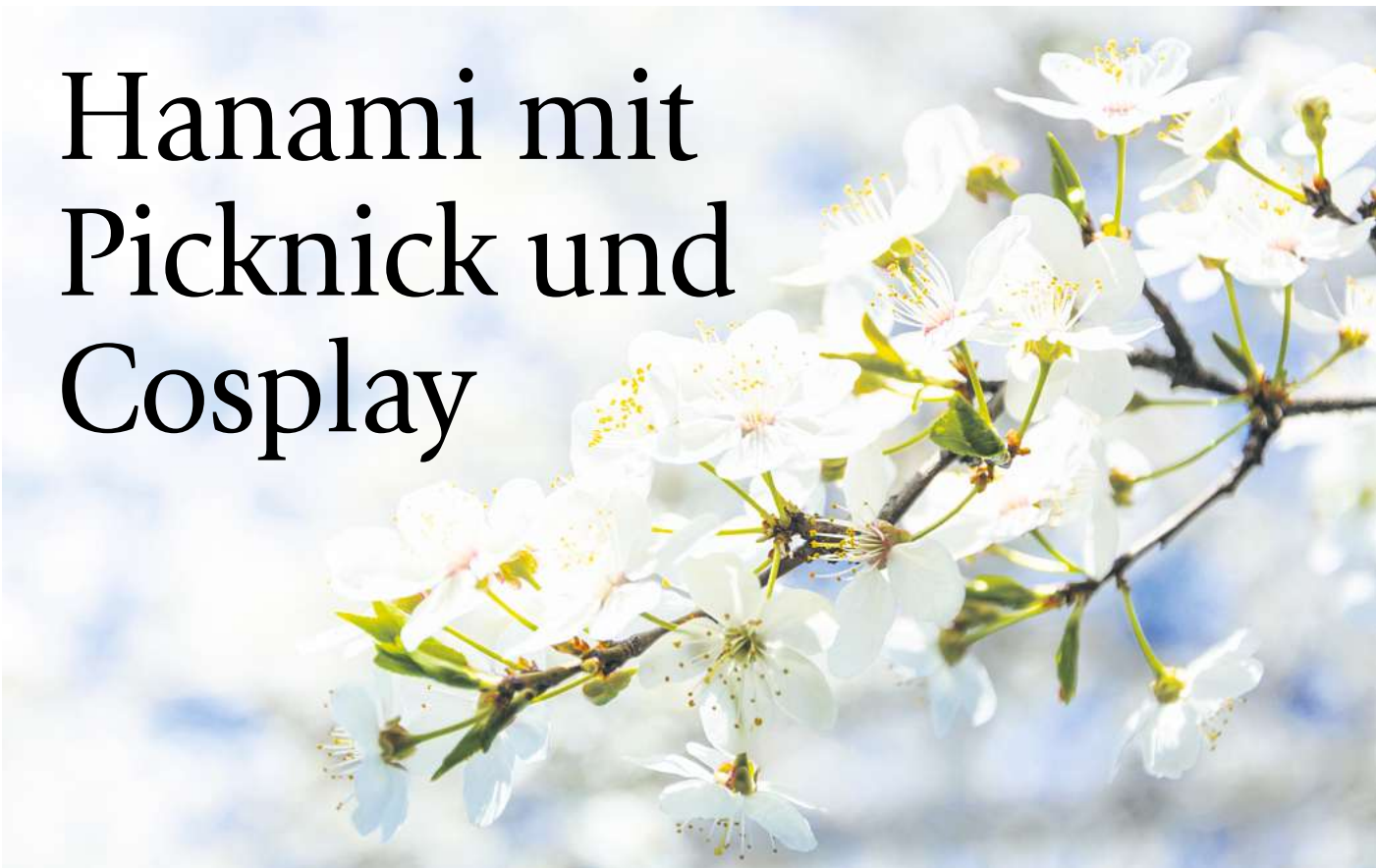
Unter blühenden Kirschbäumen wird das „Hanami“ gefeiert.

Zum Hintergrund: Der Hiroshima-Gedenkhain wurde im Dezember 1987 mit 50 japanischen Kirschbäumen offiziell eingeweiht. Bis 1989 wurden insgesamt 110 Bäume zum Gedenken an die 110.000 Menschen, die am 6. August 1945 in Hiroshima ums Leben kamen, gepflanzt. Jeder der Kirschbäume steht für je-