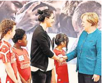
Ein Jahr nach Gründung der „Scoring Girls“ informierte sich die damalige Bundeskanzlerin Angela Merkel über das Projekt Tekkals.

Das ihre Gedanken aus Kindertagen wahr werden sollten, sie mehrfach über sich hinausgewachsen ist, hat Tekkal gesellschaftlich wie sportlich längst bewiesen – Glückwunsch!