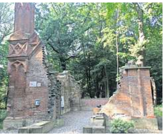
Im Hemminger Waldstück Sundern liegt die pittoreske Ruine des Mausoleums von Graf Carl von Alten.

Heute wird das Mausoleum im Waldstück Sundern in Hemmingen von einem rührigen Verein liebevoll gepflegt. Der tote Graf wurde übrigens schon in den Fünfzigerjahren in die Neustäd-