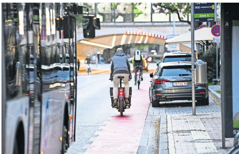
Sogenannte Schutzstreifen – wie hier in der Königstraße – sollen das Radfahren sicherer machen und sind doch wieder viel schmaler als laut StVO vorgeschrieben.

Gerne hätte die Stadt Hannover dieses Konzept auch im Bereich der Bahnunterführung am Schiffgraben umgesetzt. Doch das Land hielt diese Lösung für il-