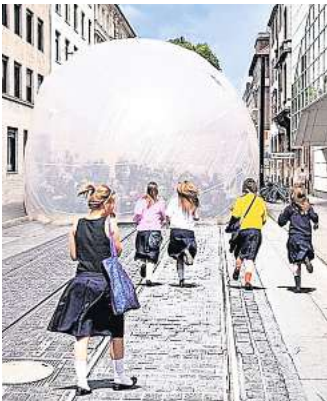
Das Städtoskoop kommt nach Misburg.

Ab 19 Uhr steht unter dem Titel „Junge Texte!“ eine Lesung der Autorin Lucie Kolb mit Kurzgeschichten und Gedichten sowie ein folk-jazziges Konzert von Nina Freckles auf dem Programm.