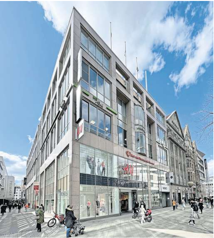
Wird geschlossen: Das Hennes & Mauritz-Geschäft (H&M) in der Georgstraße 14 in Hannover.

rain-Krieg, Kaufzurückhaltung und Inflation. Eine H&M-Sprecherin bestätigt nur, dass das Geschäft am 28. Oktober 2023 seinen letzten Verkaufstag haben wird. Andere hannoversche Standorte der Marke inklusive des Cos-Geschäfts seien nicht betroffen. Ganz im Gegenteil: Das Unternehmen suche für seine bisher in Hannover nicht vertretenen Geschäfte wie &Other-Stories, Monki und Weekday ständig attraktive Standorte. Es kann also sein, dass es demnächst auch wieder Zuwachs an Geschäften aus dem Schwedenkonzern gibt.