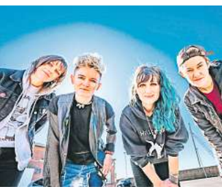
Die Ramonas rocken im Béi Chéz Heinz.

Mädels auch noch viel besser aus als die Originale Joey, Johnny, Dee Dee und Tommy. Auf dem Programm steht neben Ramones-Songs auch Material von ihrer neuen Platte „Haphazard“. Und natürlich eine furiose explosive Show, von der auch Ritchie und CJ Ramone Fans sind.