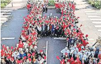
Möbel Höffner bietet auch in diesem Jahr wieder 200 Ausbildungsplätze an.

„Unser Erfolg ist auch der Erfolg jedes Einzelnen. Mit einer hochwertigen Ausbildung sichern wir unsere eigene Zukunft. Gleichzeitig bieten wir