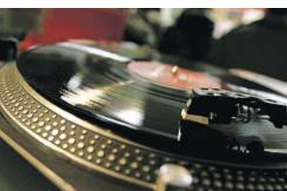
Oft totgesagt aber immer noch da: Die Schallplatte. Am 22. April ist wieder Record Store Day.