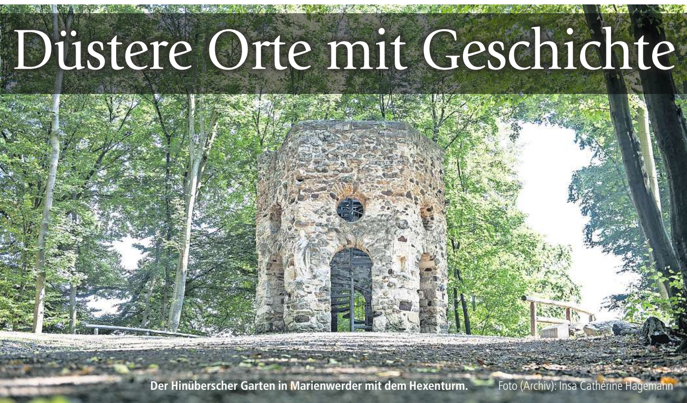
Der Hinüberscher Garten in Marienwerder mit dem Hexenturm.

HANNOVER. Das Düstere hat Konjunktur. Verwunschene Plätze, finstere Geschichten, aufgegebene Vorposten der Zivilisation: Sogenannte „Lost Places“, an denen der Verfall seinen pittoresken Charme entfaltet, faszinieren Menschen ganz unwillkürlich.