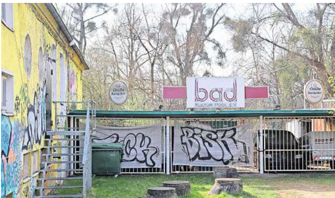
Musiktheater Bad: Hier spielte die Band Nirvana vor ihrem Welt- ruhm – damals vor rund 100 Leuten.

► Das Labyrinth findet sich grob gesagt in der Verlängerung der Lortzingstraße in der Eilenriede, etwa 250 Meter östlich der Bernadotteallee.