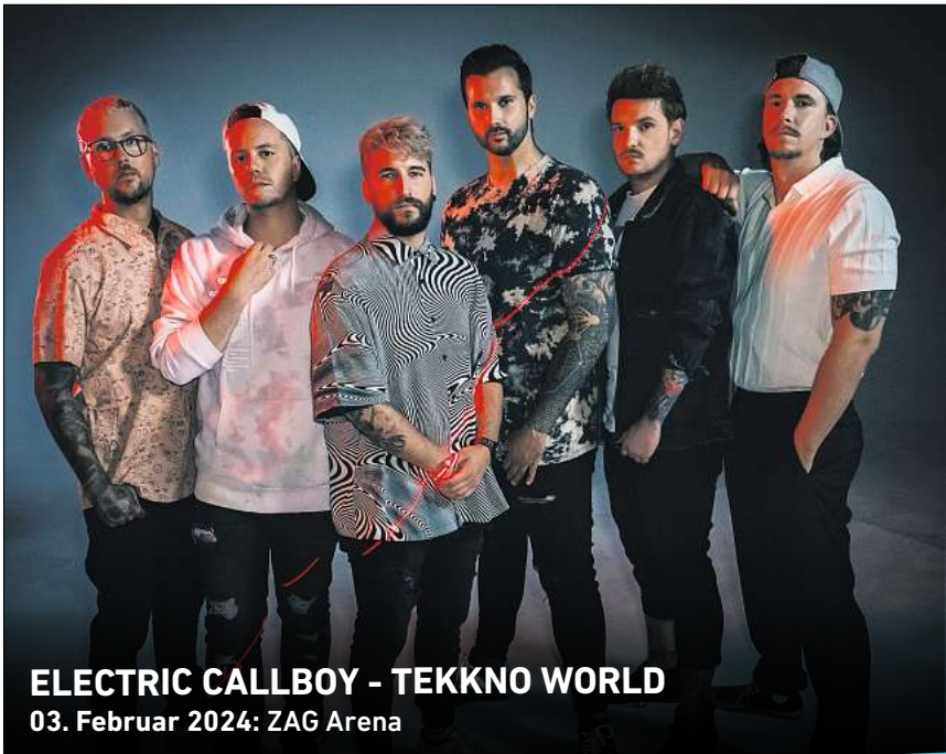
ELECTRIC CALLBOY - TEKKNO WORLD 03. Februar 2024: ZAG Arena

Musikparade 2023 30. April 2023: Swiss Life Hall