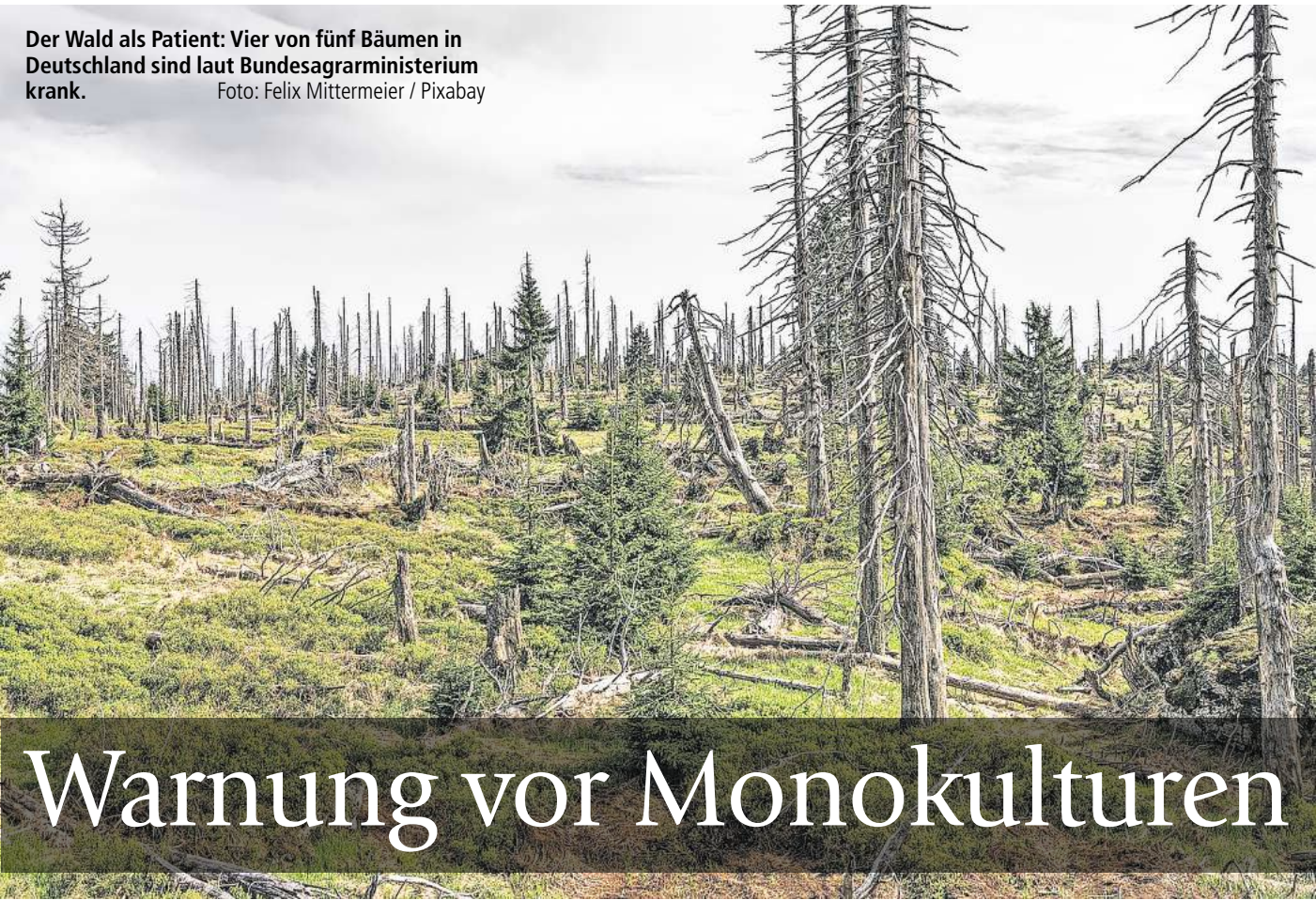
Der Wald als Patient: Vier von fünf Bäumen in Deutschland sind laut Bundesagrarministerium krank.