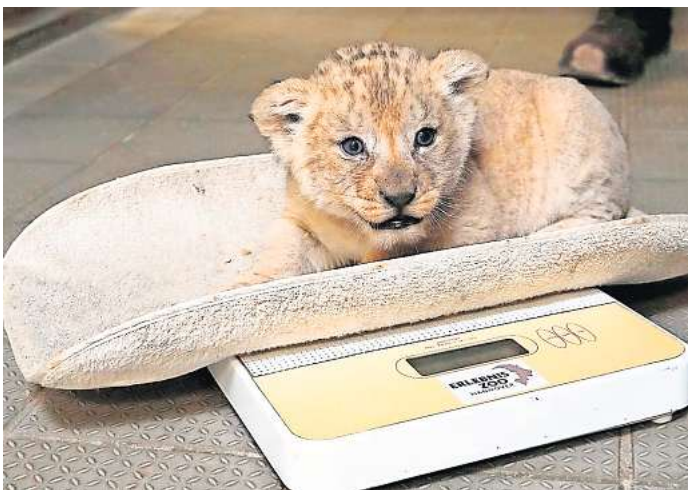
Der kleine Berberlöwen-Kater auf der Waage beim tierärztlichen Check.