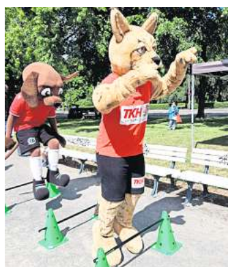
Sind mit den Kids in Bewegung: Die Maskottchen Eddi (Hannover 96) und Lucky Luchs (TKH).