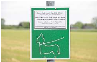
Brut- und Setzzeit: Vom 1. April bis zum 15. Juli müssen Hunde in der freien Natur an die Leine. Auf den städtischen gekennzeichneten Hundelaufflächen gilt weiterhin keine Leinenpflicht.

„Es gibt zu viele Hundebesitzer, die sich nicht an die Leinenpflicht halten“, sagte Stadthüter Pyka. Doch woran liegt das? „Viele Hundebesitzer achten auf die Pflicht, einige sind aber auch sehr arrogant. Kürzlich hat mir