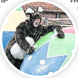
Der Osterhase auf Meyers Hof.

HANNOVER. Am Ostersonntag, 9. April, wird es ganz einfach, den Osterhasen zu finden. Im Großen Garten, Alte Herrenhäuser Straße 1, hoppeln sogar mehrere im Großen Parterre und haben Schokolade für Kinder im Körbchen. Von 10 bis 17 Uhr stehen beim Osterspaziergang in den Gärten außerdem Spiele, Märchen und Bastelaktionen auf dem Programm. Die Wasserspiele sprudeln durchgehend und es erklingen Frühlingsgedichte. Niedliche Osterküken können bestaunt werden. Das Museum Schloss Herrenhausen präsentiert die neue Sonderausstellung „Natur ist Kultur“, Grauwinkels Schlossküche bietet Snacks und Getränke an. Der Festsaal der Galerie ist zur Besichtigung geöffnet, Führungen beginnen um 13, 14 und 15 Uhr. An der Graft im