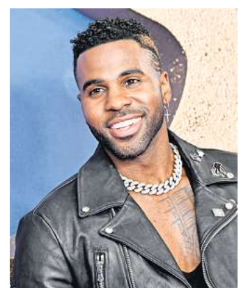
Der US-amerikanische Sänger Jason Derulo bringt die Plaza zum Kochen.