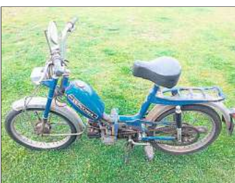
Suche altes Mofa Moped Motorrad auch defekt oder total verrostet ☎ (01 51) 11 52 02 65

Verkaufe meinen Renault Clio 16V, Bj 2011, 105.000 km, Farbe Grau Silber, TÜV Neu 01.2025 Allwetterreifen Neu, Service Neu Scheckheft gepflegt 4.5L Verbrauch günstig im Unterhalt. Fahrzeug im top Zustand. Von privat. Preis: 4750,- Euro 01782488730