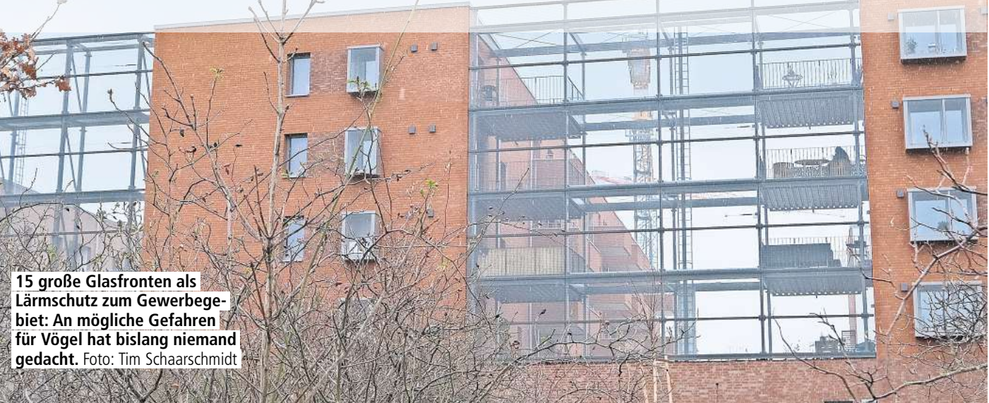
15 große Glasfronten als Lärmschutz zum Gewerbegebiet: An mögliche Gefahren für Vögel hat bislang niemand gedacht.

Gefahr bei Planung von RIESENGLASWÄNDEN offenbar nicht thematisiert