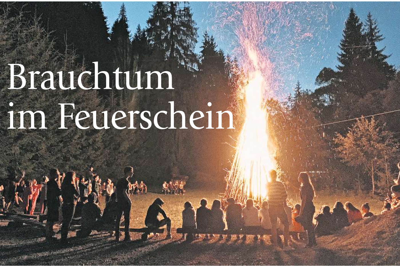
Tradition: Nachbarschaftliche Begegnungen am Osterfeuer gibt es am Sonnabend auch in der Stadt Hannover.