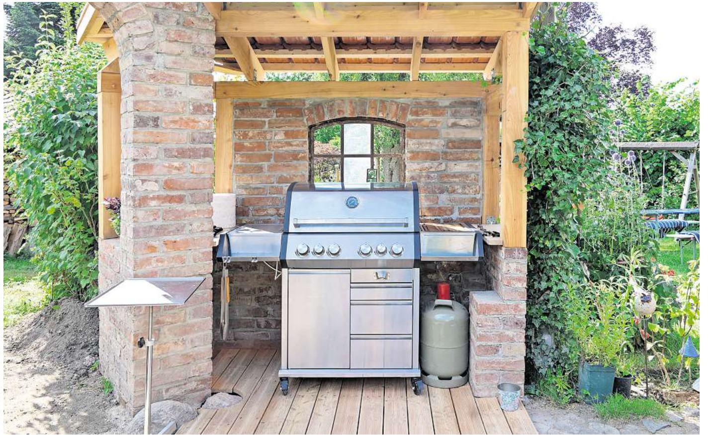
Der Gasgrill: Er ist das Herzstück vieler Outdoor-Küchen.

Andere Trends sieht Schaaf in ihrem Alltag deutlich seltener. „Nachhaltiges oder klimafestes