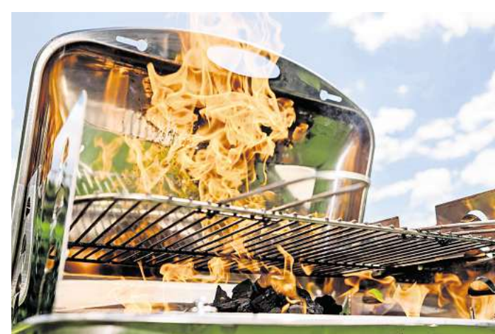
Finger weg: Spiritus und andere flüssige Brandbeschleuniger können hohe Flammen verursachen.

Kleinere Verbrennungen sollten man kurzzeitig kühlen, rät Hirche. Kaltes Wasser hilft, die