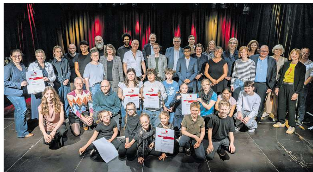
Preisverleihung im Kulturzentrum Pavillon: Mit der Vergabe des „KulturKometen“ zeichnen die Stiftung Kulturregion Hannover und die TUI Stiftung besonderes Engagement von Schulen der Region Hannover im Kulturbereich aus.

Ebenfalls mit einem zweiten Preis und 2.000 Euro wurde das Gymnasium Schillerschule Hannover ausgezeichnet. Dort verbindet das Profilprojekt „Klappe die Erste – Akademie der Künste“ kulturelle Bildung, künstlerische Praxis und digitale Medienarbeit. Das Angebot richtet sich an Schülerinnen und Schüler der Klassen 8 bis 10 und ist auf drei Jahre angelegt. Während viele Unterrichtsformate zwischen Theorie und Praxis trennen, setzt die Schillerschule auf einen Lernraum, in dem beides zusammenkommt. Die Jugendlichen schreiben Drehbücher, entwickeln Bühnenideen, produzieren Filme, komponieren Musik, gestalten Podcasts, arbeiten mit Licht, Ton und Schnitt oder stehen selbst auf der Bühne und vor der Kamera.