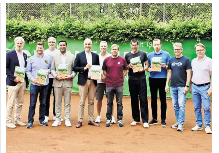
Rund 350 Gäste, darunter Mitglieder, Familien, Ehemalige sowie Vertreterinnen und Vertreter aus Politik, Sport und Stadtgesellschaft, kamen zusammen, um auf die Vereinsgeschichte zurückzublicken und den Blick nach vorn zu richten.