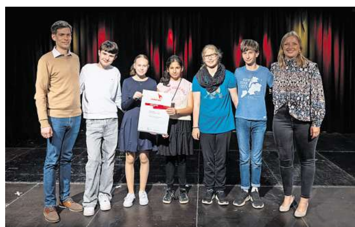
Preisträgerprojekt der Hartwig-Claußen-Schule: die neue Theater-AG.