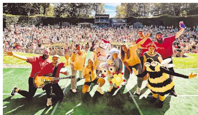
Kommen in den Stadtpark: Die beliebten Lichterkinder treten am 21. Juni beim „Open Air Kinderfest“ in Hannover auf.

draußen feiern wollen, und darauf reagiert“, so Polomka. Mit dem Stadtpark war der perfekte Ort für das „Open Air Kinderfest“ am 21. Juni gefunden: „Im Grünen, viel Platz, eine gute Infrastruktur mit ausreichend Parkplätzen, idyllisch, zentral, aber