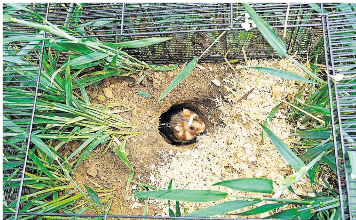
In vorgebohrten Bauten konnten die Feldhamster gleich unter der Erde verschwinden.

Der Erlebnis-Zoo Hannover sieht in dem Projekt einen wichtigen Beitrag zum Schutz heimi-