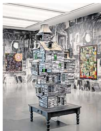
Die Kestner Gesellschaft zeigt in der Ausstellung „Potentialities“ Arbeiten von Richard Hawkins und lädt zur Collagen-Werkstatt ein.

Der Hannover Kiosk verwandelt Stadtgeschichte in Bewegung. Beim „Crashkurs Stadtgeschichte“ gibt es Führungen ab 19 Uhr, 21 Uhr und 23 Uhr. „Unsere Hannover – Schwarze Geschichten“ startet ab 20 Uhr und ab 22 Uhr. Eine Altstadtführung beginnt ab 20.30 Uhr, dazu läuft ein Kreativprogramm für alle Generationen von 19 bis 23 Uhr.