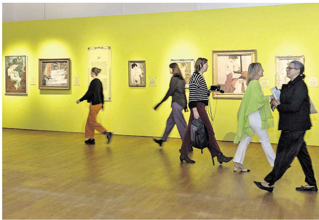
Das Landesmuseum zeigt die Ausstellung „Aufgetaucht. Philipp Klein im Kreis der Impressionisten“. Zur Nacht der Museen gibt es ein Programm mit Maskenball und Mitmachaktionen.

Die Kestner Gesellschaft mischt Kunst, Musik und Werkstattbetrieb. Der Norddeutsche Figurenchor tritt von 18 bis 21 Uhr jeweils zur vollen Stunde auf. Für Kreativ-ve aller Altersgruppen ist von 18 bis 20 Uhr eine offene „Crazy Collage“-Werkstatt eingerichtet.