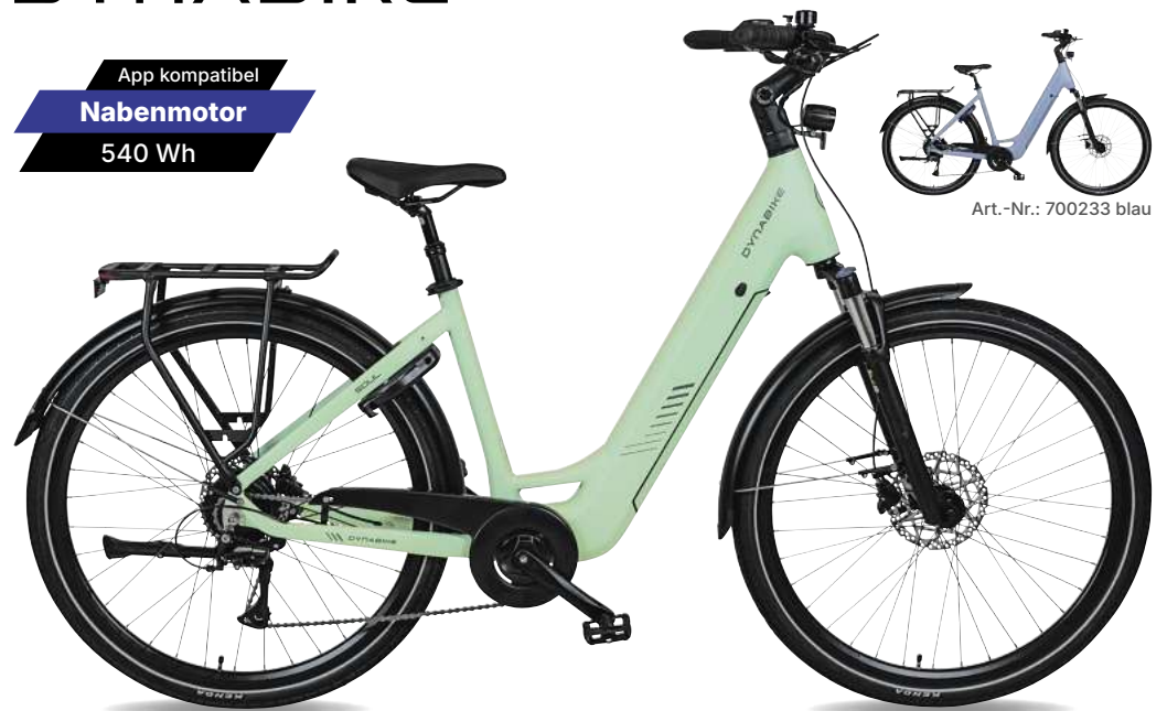
Art.-Nr.: 700233 blau