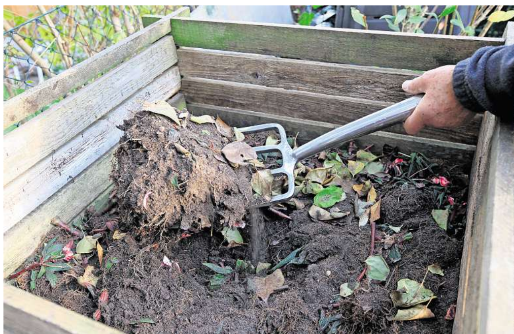
Sauerstoffzufuhr: Regelmäßig umsetzen hält den Kompost locker und aktiv.

Den Kompost richtig schichten: Der Kompost sollte gut durchlüftet sein und aus einer guten Mischung an unterschiedlichen Materialien bestehen. Das erreichen Gärtnerinnen und Gärtner am besten durch einen schichtweisen Aufbau. Der Naturschutzbund (Nabu) emp-