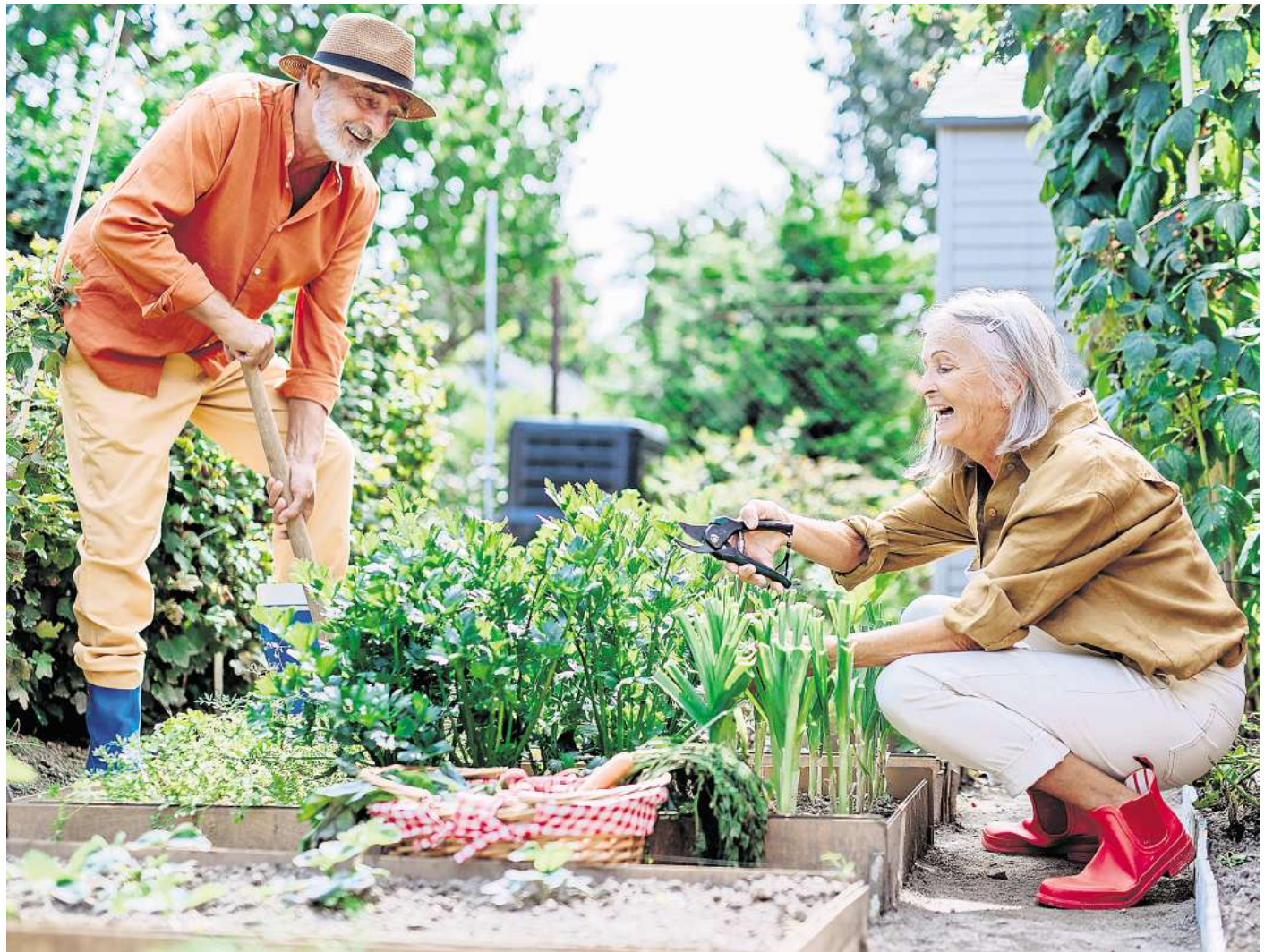
Die schönste Jahreszeit: Gartenarbeit an der frischen Luft ist ein wertvolles Ganzkörpertraining – und eine Wohltat für die Seele.

Die Patienten hatten weniger Schmerzen und ein besseres Gefühl für Stabilität in der Bewegungskette – Sprunggelenk, Knie, Rumpf. Dadurch werden Bewegungen wieder sicherer und alltägliche Aktivitäten einfacher. Hinzu kam das gute Lebensgefühl, das die Teilnehmer hatten. Menschen mit chronischen Beschwerden sind sozusagen eingezwängt durch ihre