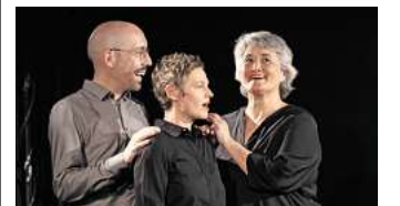
Auf Zuruf: „Tapetenwechsel“.