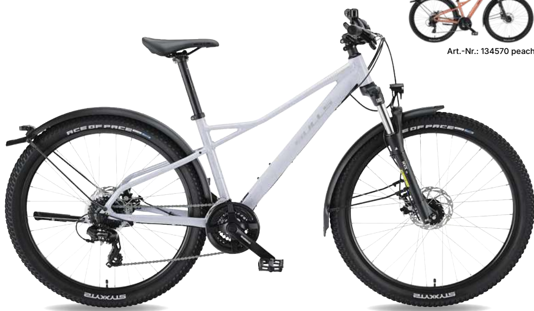
Art.-Nr.: 134570 peach