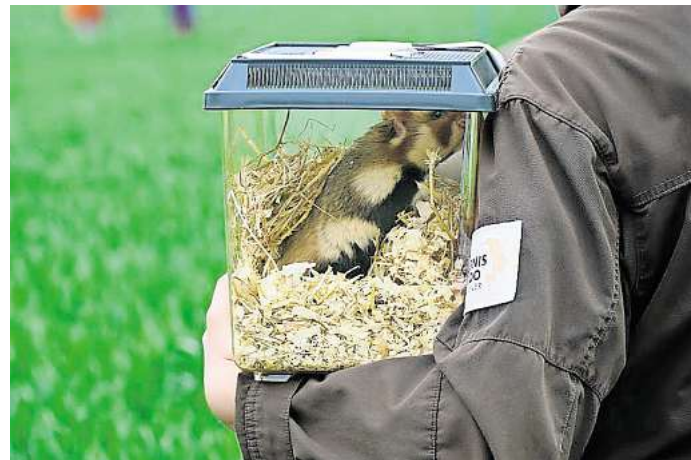
Aus der Transportbox aufs Feld: Zwölf Feldhamster wurden ausgewildert.