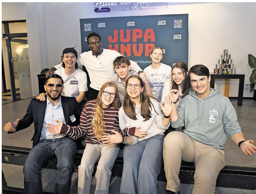
Haben sich vier Jahre lang für ein Jugendparlament in Hannover eingesetzt: Mitglieder der Initiative Jupa.

Wahlberechtigt sind alle Einwohnerinnen und Einwohner der Stadt Hannover zwischen zwölf und 20 Jahren. Das sind rund 38.000 Menschen.