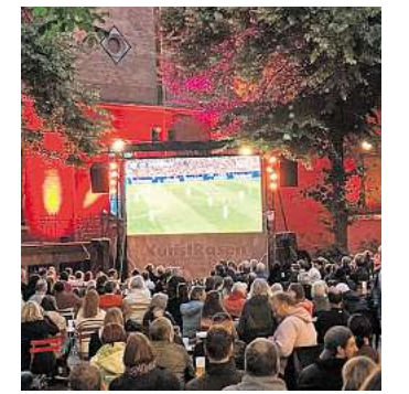
Zur Fußball-EM 2024 feierte der KunstRasen seine Premiere.

Public Viewing. Der Eintritt zu allen Veranstaltungen im Rahmen des KunstRasen ist frei. Das Platzangebot ist begrenzt. Bei Regen werden die Top-Spiele und das Kinoprogramm im Kino im Künstlerhaus gezeigt.