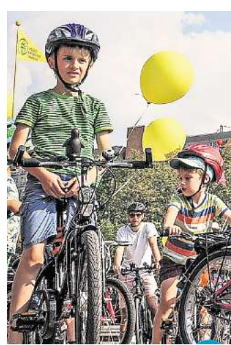
Die „Kidical Mass“ versteht sich als bunte Mitmachaktion für Familien, ist zugleich aber auch eine politische Demonstration.

➔ Weitere Informationen zur Veranstaltung gibt es im Internet unter velohannover.de/kidicalmass .