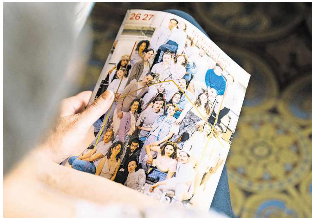
19 Premieren sind für die neue Spielzeit angekündigt, darunter sieben Uraufführungen und eine deutsche Erstaufführung.

Vielleicht ist das kein Zufall. Vielleicht sehnen sich viele Menschen gerade nach genau solchen Orten: nach Räumen, in denen die Welt nicht einfacher gemacht wird, aber gemeinsam ausgehalten werden kann. Das Schauspiel Hannover scheint diese Sehnsucht verstanden zu haben. Die neue Spielzeit jedenfalls wirkt nicht wie eine Flucht aus der Gegenwart. Sondern wie der Versuch, ihr offen zu begegnen.