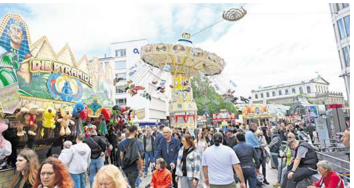
Autoscooter an der Oper, Wellenflieger am Kröpcke: Es ist wieder Kirmes mitten in der Innenstadt.

HANNOVER. Die Fahrgeschäfte drehen sich wieder: Die City-Kirmes ist zurück. Nach der Premiere im vergangenen Jahr bringt die Arbeitsgemeinschaft für Volksfeste Hannover (AGVH) das bunte Innenstadtfest erneut mitten ins Herz der Landeshauptstadt. Seit zwei Tagen und noch bis 17. Mai verwandeln sich Georgstraße, Kröpcke und erstmals auch der Opernplatz in eine große Jahrmarktsmeile zwischen Einkaufsbummel, Fahrspaß und Budenzauber. Damit setzt Hannover rund um das lange Himmelfahrtswochenende erneut auf ein Konzept, das klassische Kirmesatmosphäre direkt in die City holt. Wo sonst geschoppt und flaniert wird, stehen dann Autoscooter, Spielstände und Imbisswagen. Besonders markant: Der Wellenflieger überragt das Zentrum und bietet Fahrgästen einen ungewöhnlichen Blick auf den Kröpcke und die Innenstadt. Vor der Oper lädt ein Autoscooter