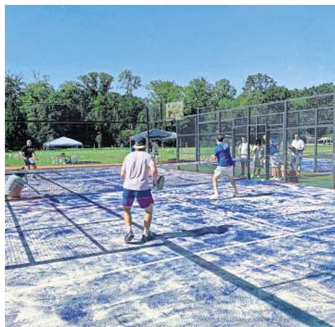
Bei den NP-Padelturnieren messen sich am Samstag die Einsteiger, am Sonntag die Fortgeschrittenen.

Auch sportlich hat das Wochenende einiges zu bieten. Bei den