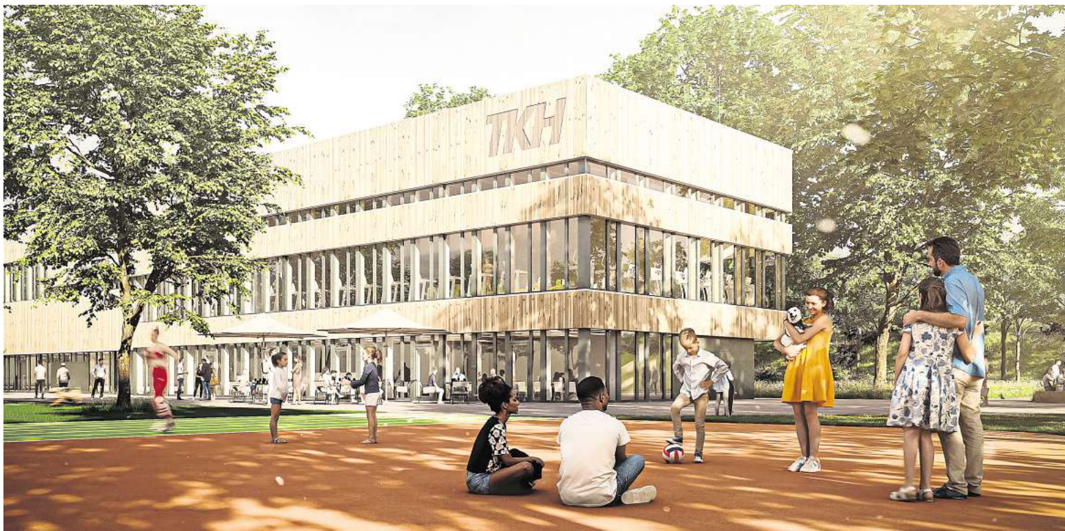
Am 9. und 10. Mai geht es in Kirchrode sportlich zu: Auf der TK Hasenheide steigt Kirchrodes erstes Stadtteilstfest.