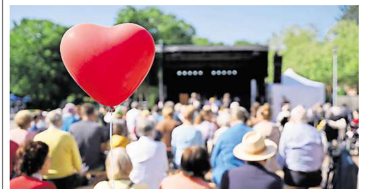
Das Stephansstift lädt zum Jahresfest ein.