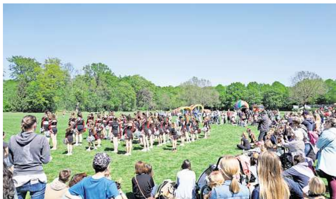
Am kommenden Wochenende dreht sich auf dem 1. Kirchröder Stadtteilstfest alles um Sport, Bewegung und Genuss.

Im Mittelpunkt stehen nicht nur der Sport, sondern vor allem die gemeinsamen Erlebnisse – für alle Generationen. Während sich die Kinder auf den Hüpfburgen austoben oder beim Fahrrad-Mobilitätstraining mit Bike-Check ihre ersten Runden drehen, wachsen Familien bei der VGH-Familien-Olympiade über sich hinaus. Ein