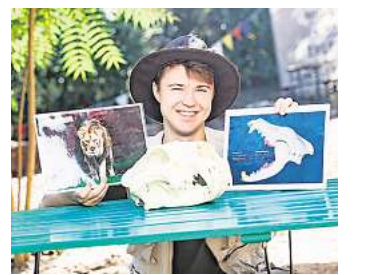
Zoo-Scouts vermitteln Wissen rund um Tiere.

Der Eintritt zum Familienfest ist im regulären Zooeintritt enthalten, Jahreskarten gelten ebenfalls. Einige Mitmachangebote werden gegen einen Selbstkostenbeitrag angeboten. RED