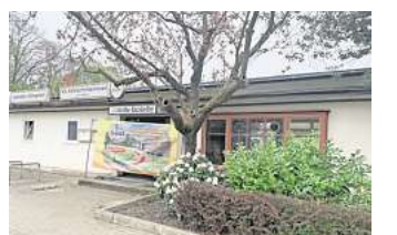
Die Gaststätte 11 A des VfL Eintracht wird grundlegend saniert.