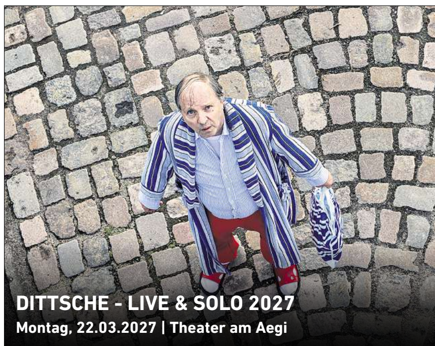
DITTSCHKE - LIVE & SOLO 2027 Montag, 22.03.2027 | Theater am Aegi

HANNOVER. Egal ob Zimmerpflanze, Kräuter oder Gartenpflanze: Ein Aktionstag rund ums Gärtnern findet am Sonntag, 19. April, im Freizeithaus Linden / Palettengarten Linden-Nord (PaGaLiNo), Windheimstraße 4, statt. Von 14 bis 17 Uhr gibt es eine Pflanzen- und Samentauschbörse. Gäste können Setzlinge, Ableger und Saatgut mitbringen und untereinander tauschen. Ergänzt wird das Angebot durch einen Workshop zur Herstellung von Pflanzenkohle, bei dem gezeigt wird, wie sich Boden verbessern lässt. Die Veranstaltung richtet sich an Interessierte ab acht Jahren und ist kostenfrei zugänglich, eine Anmeldung ist nicht erforderlich. RED