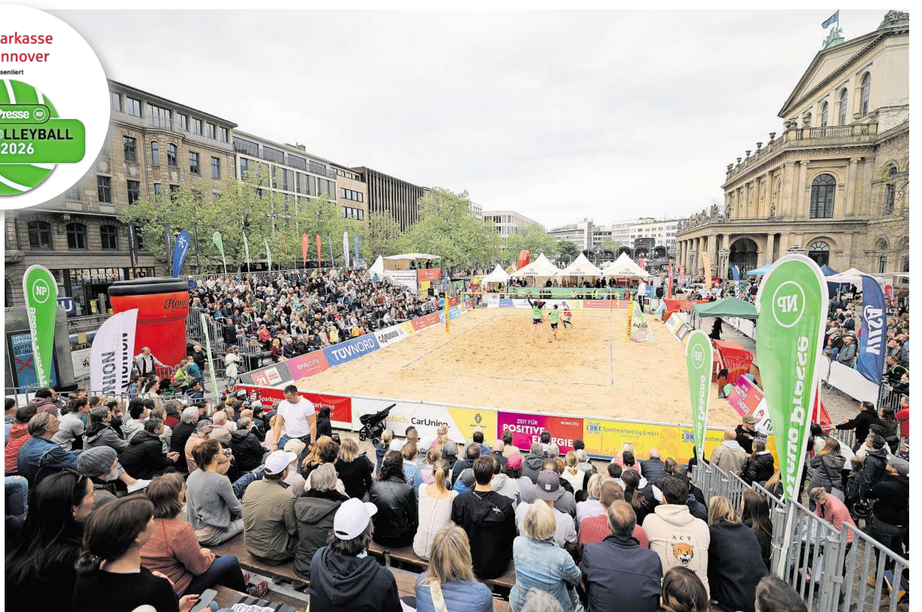
Volle Tribünen: 2024 und 2025 zog es Zehntausende Besucherinnen und Besucher an die Oper.