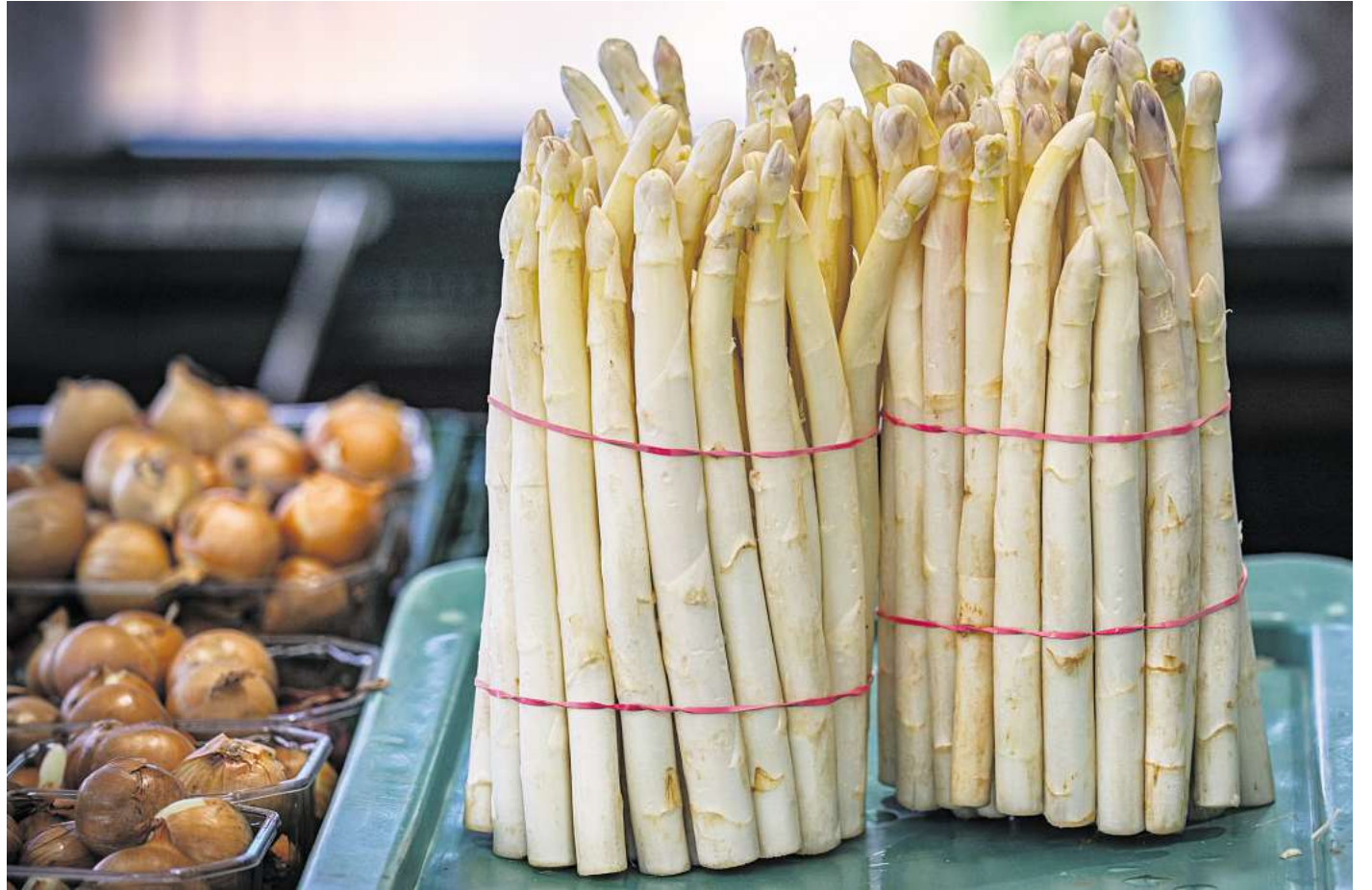
Heißgeliebtes Gemüse: Rund 1,4 Kilogramm Spargel pro Jahr isst jeder Deutsche im Durchschnitt.