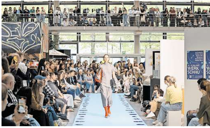
Mode made in Hannover: Studierende präsentieren ihre aktuellen Kollektionen.