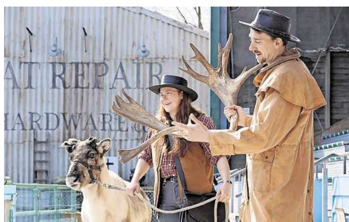
Lebensräume im Wandel: Bei der neuen Tierpräsentation geht es um die Beziehung von Mensch und Tier im Wandel der Zeiten.

Nachdem im Februar die Giraffenkuh Jamila gestorben war