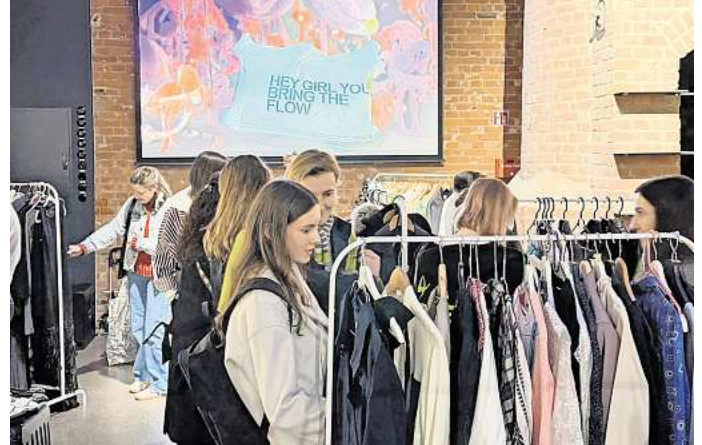
Mode und mehr: Beim „Flowmarkt“ können Gäste in entspannter Atmosphäre ausgewählte Second-Hand-Kleidung shoppen.

Außenbereich sorgen Foodstände des „Foodtruck Klub“ und die „Weinbar gegenüber“ für das kulinarische Angebot. Musikalisch begleiten die DJs von „Electric Cuvée“ den Tag. Dazu kommen Bühne, Pop-up-Aktionen und Walk-ins – auch Tattoo-Angebote sind geplant.