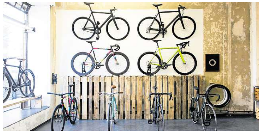
Hochwertige Räder, die nach Maß gefertigt wurden: Die Premium-Kategorie der Fahrradbranche verzeichnet deutliche Zuwächse.

Beim Verkauf dominieren weiterhin die Trekkingräder. An zweiter Stelle kommen Mountainbikes (MTB), wobei die E-Varianten weit vorne liegen. Gravel-Bikes, geländetaugliche Rennräder ohne Hilfsmotor, waren die Aufsteiger des Jahres – mit einem Marktanteil von mittlerweile 10 Prozent. Die Branche schwankt zwischen Hoffen und Bangen. Ist die Talsohle erreicht