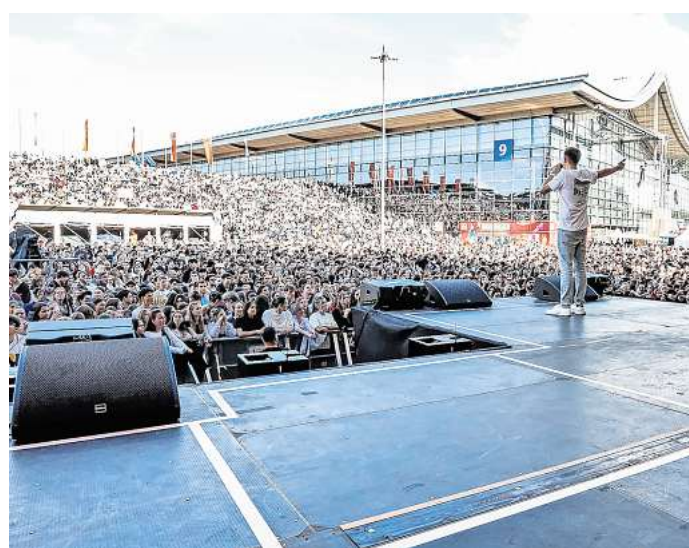
Newcomer STNA durfte bei der IdeenExpo 2024 vor 10.000 Menschen im Vorprogramm von Cro auftreten.

Bewerbungsformular auf: ideenexpo.de/bandcontest