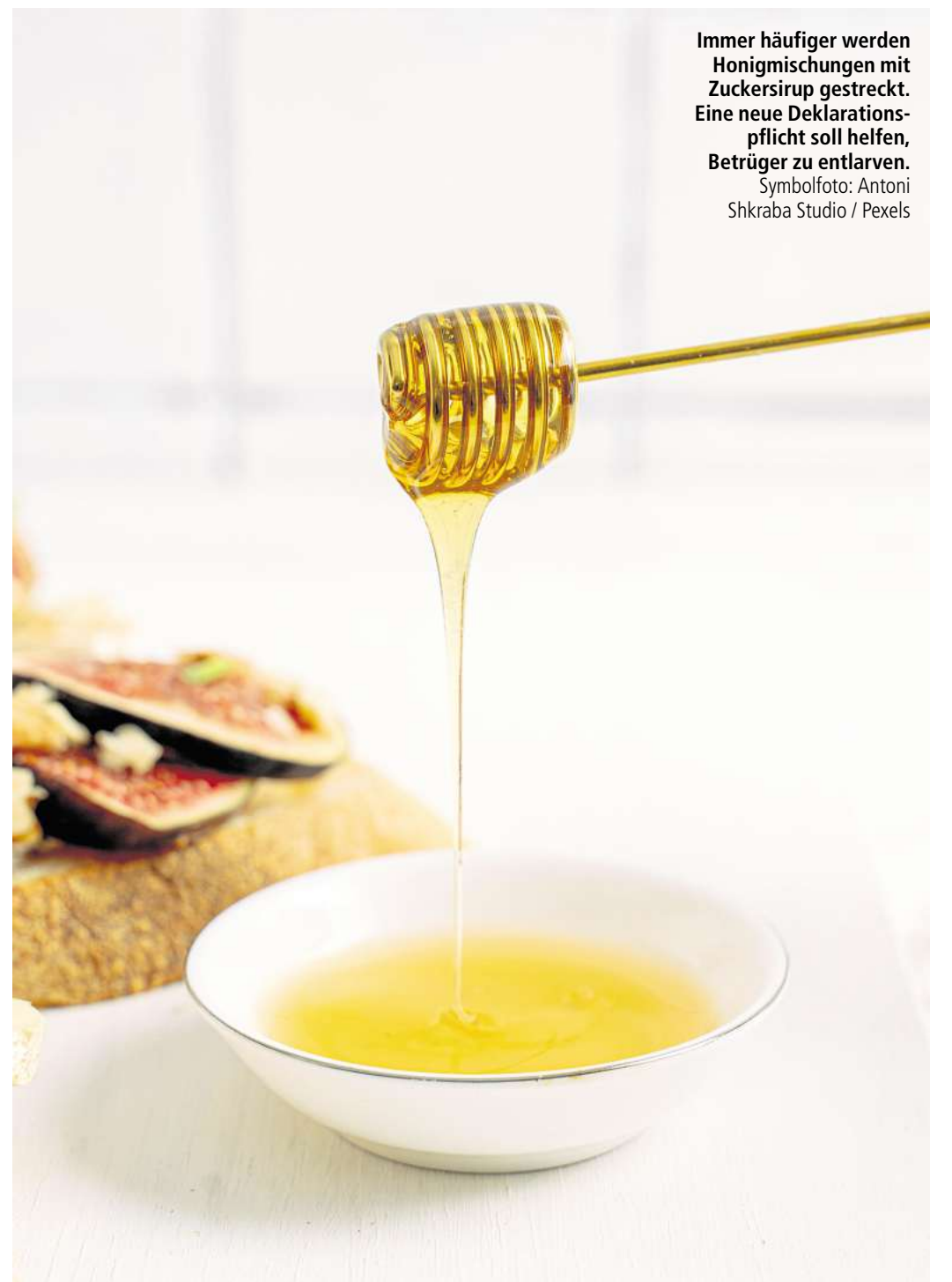
Immer häufiger werden Honigmischungen mit Zuckersirup gestreckt. Eine neue Deklarationspflicht soll helfen, Betrüger zu entlarven.

Die deutschen Supermärkte sind auf Importware angewiesen. Laut Bundeslandwirtschaftsministerium lag der Honigverbrauch in Deutschland 2024 bei rund 85.100 Tonnen.