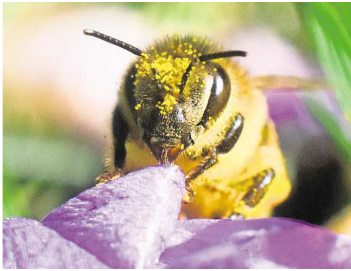
Frühe Tankstelle: Krokusse versorgen Bienen schon am Frühlingsanfang mit Pollen und Nektar.