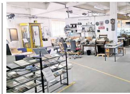
Besonders die Telex-Abteilung mit ihren zahlreichen funktionsfähigen und miteinander verbundenen Fernschreibern erfreut sich großer Beliebtheit.