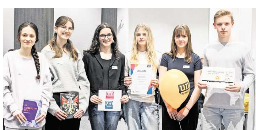
Ausgezeichnet: Das Redaktionsteam des Kepler-Gymnasiums aus Garbsen nimmt seinen Preis entgegen.