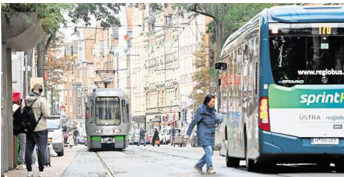
Bus und Bahn auf der Limmerstraße: „Wir wollen weitere Fahrgäste mit dem eTarif gewinnen.“